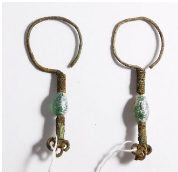
Рис. 11. Сережки з могильника Усть-Балик в Тюменській області РФ (XI-XV ст.). За (Владимиров, 2018, с. 10, рис. 2).

10-11. Сережки №№ АЗС-1200, АЗС-1201 (рис. 10) парні, по Г.А. Федорову-Давидову можуть бути віднесені до варіанту VI г, було передано музею Б.І. та В.Н. Ханенками, у п'ятому томі "Древностей Поднепровья" зазначено, що вони походять з Києва (Ханенко, 1907, с. 43, табл. XVI, № 911-912). Їхні описи ідентичні: верхня частина – незамкнене дротяне кільце досить великого діаметру – 38,5 мм, відігнутий стрижень завершується круглою запаяною петлею. У центрі стрижня нерухомо закріплена бочкоподібна намистина 5,5 × 5 мм, виготовлена зі згорнутої в трубочку пластини, з наповнювачем з ндм. З двох боків від намистини стрижень обвитий плющеною сканню. Можна припустити, що сканна обмотка повинна фіксувати намистину, але насправді у верхній частині кожної сережки обмотка не зафіксована, а рухається вільно стрижнем, намистина ж нерухома на стрижні. Сережки досить великі – їх висота 74 мм, можливо петля в нижній частині стрижня використовувалася для додаткових підвісок, які ще збільшували розміри прикрас.