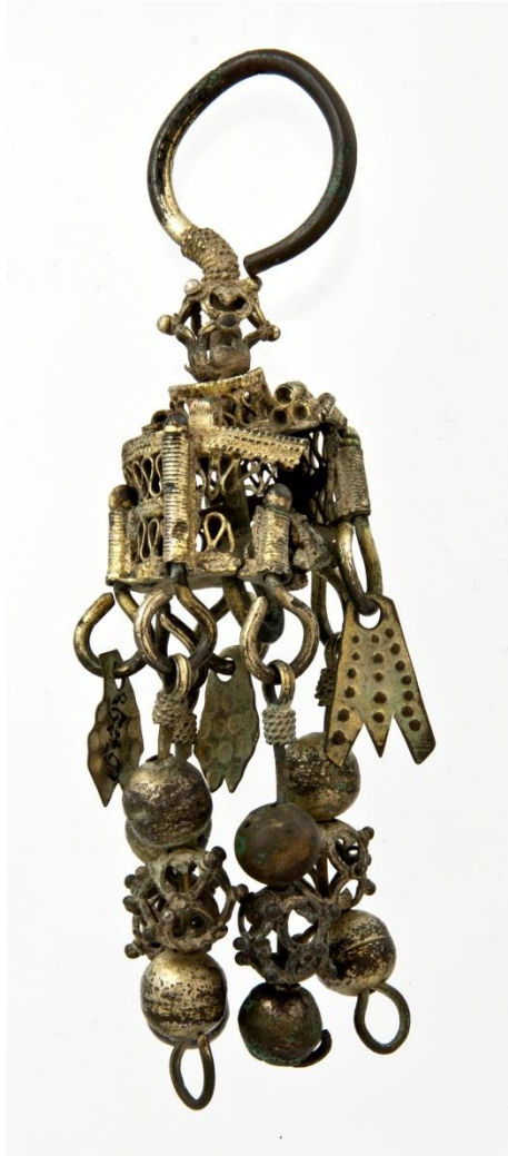
Рис. 12. Прикраса № АЗС-578. М. Київ (?). Колекції Б.І. та В.Н. Ханенків.

Відрізняє ці сережки спосіб обмотки. Стрижень обвитий не гладенькою дротинкою, як у всіх інших екземплярів з нашої колекції, а спірально перекрученою. Подібна скана обмотка досить часто використовувалась в декорі сережок з території Болгарії (Владимиров, 2018). Найбільш подібні до цих сережок бронзові прикраси з могильника Усть-Балик в Тюменській області XI-XV ст. (Владимиров, 2018, с. 10, рис. 2) (рис. 11).