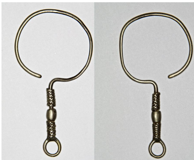
Рис. 10. Сережки №№ АЗС-1200, АЗС-1201. м. Київ (?). Надійшли від Б.І. та В.Н. Ханенків.

Оформлення верхньої частини однакове для всіх сережок цього типу у вигляді не до кінця зімкнутого кільця (діаметр ~ 23 мм) з відігнутим донизу стрижнем. У нижній частині стрижня підвіска, що нагадує гроно. Гроно складається з п'яти, виготовлених із двох тиснених півсфер кожна, пустотілих кульок (діаметр 6,8-7,0 мм), у нижньої з яких найбільший діаметр – 8,5 мм. Верхня кулька-намистина нанизана на стрижень, до неї у вигляді перевернутої пірамідки припаяні ще чотири. Між кульками напаяно шість маленьких кульок зерні. Висота сережок – 52 та 54 мм, виконані вони з круглого у перетині дроту діаметром 1,8 мм. Сережка № АЗС-598 досить сильно пошкоджена, на кульках суттєві втрати металу, що, власне, і дозволяє краще уявити конструкцію прикрас.