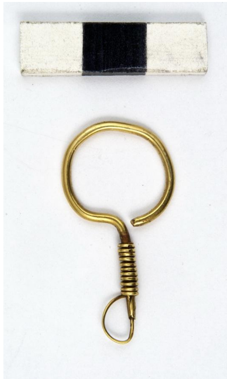
Рис. 2. Сережка № АЗС-3372. \

Сережка виготовлена з круглого в перетині золотого дроту діаметром 1,5 мм, невелика за розмірами, її довжина 41 мм. Верхня частина – майже замкнуте кільце, трохи деформоване, діаметр ~ 17,5 мм, один кінець відігнутий до низу у вигляді стрижня. У нижній частині стрижень був злегка розклепаний і вертикально згорнутий у трубочку. У трубочку вставлена тонка (0,5 мм) дротинка, зігнута петелькою і обвита щільними витками навколо стрижня знизу вгору (зараз дротинка розламана в місці вигину).