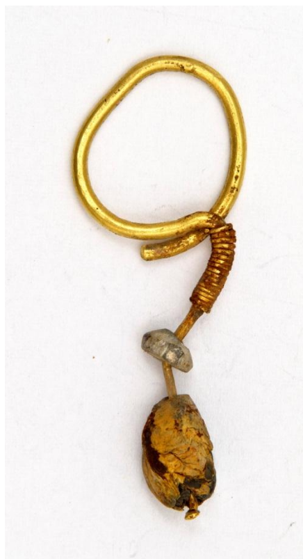
Рис. 4. Сережка № АЗС-1887. Городище «Великі Кучугури», Запорізька область. Розкопки 1953 р.

Очевидно, частина стрижня витончена проковкою або волочінням, вигнута в петлю і обвита навколо нього ж. На петлі зберіглася досить велика краплеподібна перлина 8,5 \times 6,5 мм. Такі золоті сережки з перлинами були знайдені на Болгарському городищі, в похованні Увекського мавзолея (Полякова, 1996, с. 175), в похованні № 94 могильника Мамай-Сурка (Ельников, 2001, с. 51-52, рис. 16,5). Найбільш схожа сережка з краплеподібною перлиною знайдена в 1991 р. під час розкопок на Красноярському городищі Астраханської області (Золота Орда, 2005, с. 201, кат. 112).