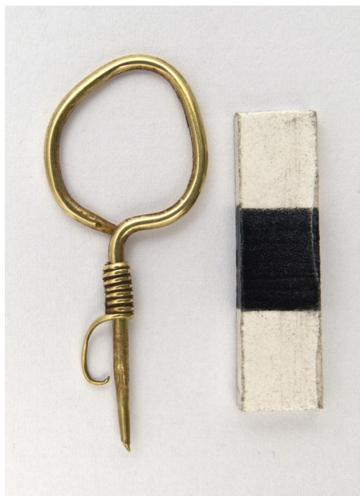
Рис. 1. Сережка № АЗС-2024.

В колекції Скарбниці налічується 11 сережок різних варіантів. Вони виконані із золота та срібла й походять як із добре задокументованих археологічних комплексів, так і з колекцій, походження предметів яких складно точно встановити. Золотих сережок налічується 7 екземплярів, 3 з них за Г.А. Федоровим-Давидовим відносяться до варіанта VI б – односкладові з дротяною обмоткою та намистиною на петлі (Федоров-Давидов, 1966, с. 39), ще одна, деформована, може бути віднесена до цього ж варіанту із поправкою на спосіб фіксації намистини.