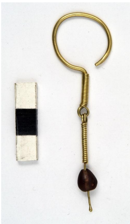
Рис. 6. Сережка № ДМ-6272. Таращанський повіт (?).

Форма нижньої привіски досить своєрідна, тому безпосередні аналогії складно вказати. Однак прикраси з напаяними на стрижень кастами відомі в Сайрамському та Симферопольському скарбах (Байтанаєв, 2013, с. 205, кат. № 4; Мальм, 1987 рис. Золотые серьги с жемчужиной и шпинелью), з поховання у Литві, де, щоправда, до верхньої частини з кастом прикріплені дві підвіски (Gediminskaitė, 2018, р. 201).