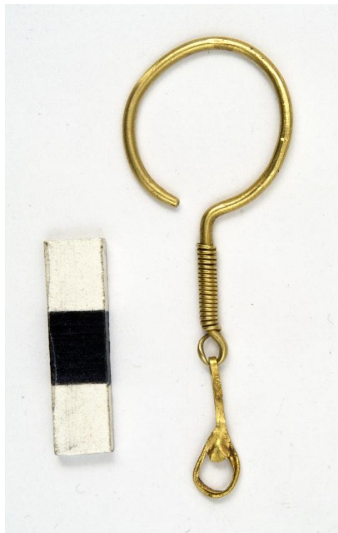
Рис. 5. Сережка № ДМ-6271. Болгарське городище, Республіка Татарстан (?).

Золоті сережки №№ ДМ-6271, 6272, відомості про походження яких не досить ясні, можна віднести до варіанта VI а за Г.А. Федоровим-Давидовим: двоскладові з дротяною обмоткою та намистиною (сережки такого типу були знайдені в жіночих похованнях Таганського і Новохарківського могильників в Подонні, в Башкирському Приураллі, у складі скарбів Волзької Булгарії) (Федоров-Давидов, 1966, с. 39). В даному випадку визначальним для віднесення їх до цього варіанту є двоскладовість, спосіб оформлення нижньої частини не цілком збігається з описаним Г.А. Федоровим-Давидовим.