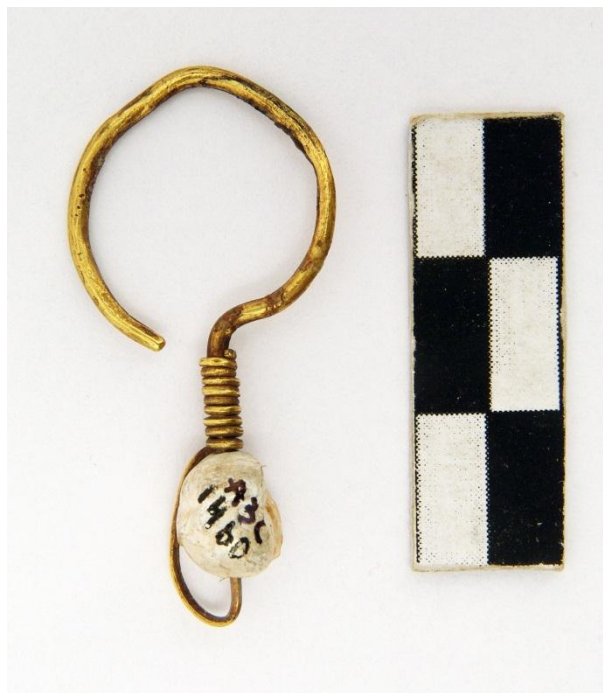
Рис. 3. Сережка № АЗС-1460. Передана з Херсонського обласного краєзнавчого музею у 1963 р., обставини знахідки не вказані.

Петелька в описаних сережках була, можливо, призначена для намистини, як у сережці № АЗС-1460.