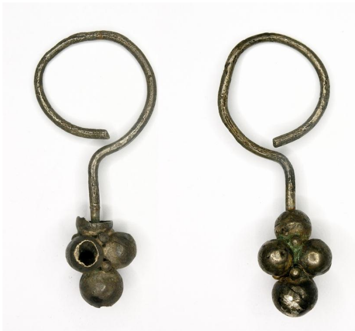
Рис. 9. Сережки №№ АЗС-598, АЗС-599. м. Чигирин, Черкаська обл. (?).

У колекції представлено також кілька срібних сережок. До варіанта VI в – з односкладовим стрижнем без обмотки, з намистиною на кінці – можуть бути віднесені срібні сережки №№ АЗС-598, АЗС-599.