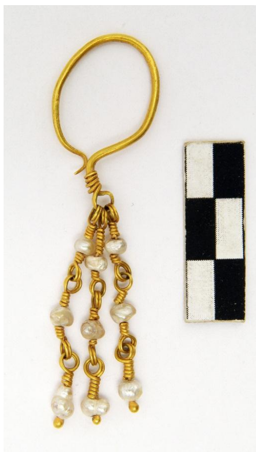
Рис. 8. Сережка № АЗС-3327. Поховання, м. Білгород-Дністровський. Розкопки 1980 р.

підвісками ~ 65 мм. Форма верхньої частини сережки близька до овалу, один кінець незамкнутого кільця потоншений і злегка відігнутий назовні, вертикально відігнутий стрижень дуже короткий, в одному місці трохи сплющений і відігнутий, утворюючи круглу петлю. Тонкий кінчик нещільно, трохи навскоси, обвитий навколо стрижня. У петлю просунуто три підвіски. Кожна складається з трьох деталей-ланок, з'єднаних у ланцюжок. Кожна ланка – дротяний стрижень із нанизаною на нього перлиною. Обидва кінці шести верхніх стрижнів згорнуті подвійними петлями, за допомогою яких вони з'єднані, і обвиті навколо стрижня зверху вниз і знизу вгору, фіксуючи перлинки. Три нижніх стриженьки відрізняються: верхня їх частина з'єднана аналогічною подвійною петлею з попередньою ланкою, нижній кінець, на який нанизана перлина, завершується краплеподібним потовщенням. Подібні сережки з кількома привісками присутні, крім знахідок в Румунії, (Oța, 2013, p. 302) в жіночих похованнях XV ст. в Литві (Gediminskaitė, 2018, p. 202, il. 4, 5; Vėlius, 2005, p. 55; Svetikas, 2003, p. 57). Від них, ймовірно, відбувався перехід до пізніших сережок-двійчаток і трійчаток.