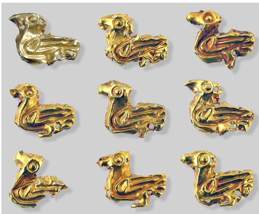
Рис. 2. Золоті пластинки із зображенням водоплавного птаха.

Слід відмітити ще варіанти декору на ріжках корпусу сережок: мініатюрні фігурки водоплавного птаха (качки), аналогічні – прикріплені на ланцюжках знизу до корпусу.