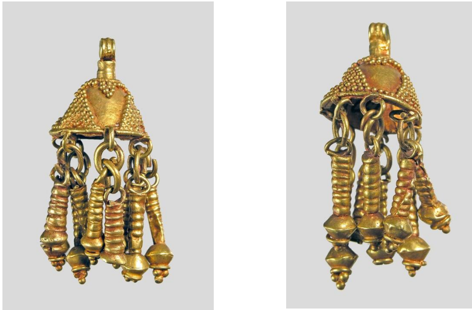
Рис.3. Підвіски у формі дзвоника.

Особливу увагу привертають персні. Два з них: золотий і електричний – археологи побачили на фалангах пальців на правій руці небіжчиці, а ще один золотий – трохи далі (Мозолевський, 1987, с. 70). Ця категорія прикрас, тобто, персні – предмети алегоричні, їх змістовне наповнення можна порівняти з головними уборами у жіночому костюмі.