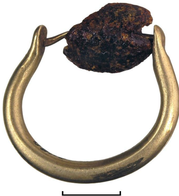
Рис.7. Прикраса у вигляді стилізованих рогів з бурштиною намистиною.

Привертає увагу ще одна прикраса, яку вважають перстнем, хоча вона не зафіксована на руці на відміну від описаних вище витворів. Отже, припустимо, що це перстень. Він складається з дугоподібної шинки з незімкненими кінцями і намистини (рис. 7). Шинка виготовлена із майже круглого у перетині дроту, кінці якого дещо відігнуті, розширені та сплюснені. З внутрішнього боку до кінців дужки припаяні золоті дротинки. На них нанизана бурштинова (?) намистина. Загалом перстень можна охарактеризувати як дротяний з рухливою вставкою. Слід відмітити досить значні розміри виробу: довжина шинки – 30 мм; намистина – 15 × 12 мм; перетин дроту – 2,5 мм. Можливо, перстень поклали до інших знімних декоративних елементів убрання при здійсненні поховального обряду.