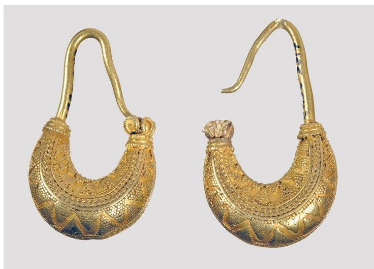
Рис.1. Золоті сережки – човники.

Почнемо, як завжди, з голови. Йдеться про сережки, які належать до групи так званих човників (h – 44 мм; 41 мм; ширина – 25 мм, 24,5 мм). Кожна сережка зроблена з двох елементів: корпусу у формі півмісяця, оберненого “ріжками ввєрх”, чи човника, та дротяної дужки з відігнутим кінцем. Корпус зроблено з об'ємних половинок, прикрашених орнаментами з гладеньких дротинок та дрібної зерні. З обох боків сережки напаяно дугоподібні (за контуром корпусу) візерунки, які нагадують косу. Кожна “кіска” – плетінка з двох тоненьких дротин, зверху і знизу підкреслена вузькими дротяними смужками та трикутниками зерні. Останні розміщені чотирма ярусами: вершиною вниз і ввєрх. Проміжок між ними відкриває гладеньку поверхню у вигляді ламаної смужки. “Ріжки” корпусу оформлено трьома дротяними обідками (два з них рубчасті, один гладенький). Завершення сережки – розетка на одному кінці, пелюстки якої виділені золотим дротом. На розетці однієї з сережок він гладенький, на розетці другої – рубчастий. Всередину ріжка без розетки вставлено дротяну дужку (рис. 1).