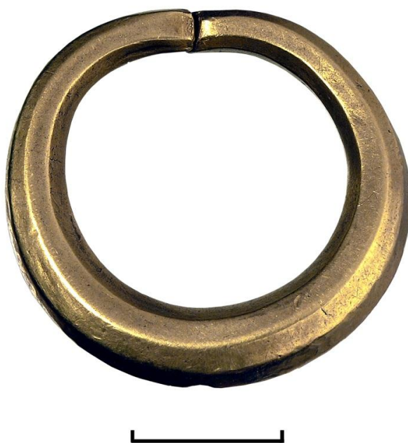
Рис.6. Золоте кільце із 8-ми гранного стрижня.

Чи знали міфи про Діоніса мешканці Північного Причорномор'я – греки і скіфи – невідомо. Але деякі сторони його культу, можливо, збігались з із загальними уявленнями про вшанування богів плодючості: у вигляді містерій чи календарних свят. Згадаємо пасажі в «Історії» Геродота про скіфського царя Скїла, який був прихильником еллінських звичаїв, зокрема діонісійських містерій (Геродот IV, 79). З оповіді «батька історії» можна припустити, що скіфи не сприймали форму вшанування бога (містерії), оскільки мали свої обряди. Хоча, мабуть, Скїл поплатився життя не за прихильність до культу Діоніса, а в результаті політичної боротьби (Мурзин, 2013, с. 199–200).