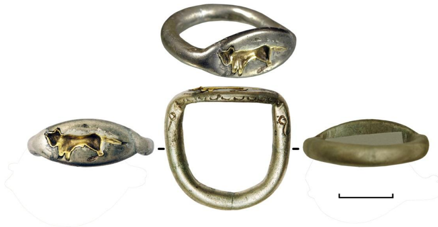
Рис.4. Перстень з листоподібним щитком і суцільною шинкою.

Особливу увагу привертають персні. Два з них: золотий і електричний – археологи побачили на фалангах пальців на правій руці небіжчиці, а ще один золотий – трохи далі (Мозолевський, 1987, с. 70). Ця категорія прикрас, тобто, персні – предмети алегоричні, їх змістовне наповнення можна порівняти з головними уборами у жіночому костюмі.