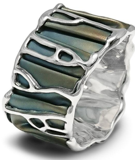
Рис. 1. Titargium каблучка ІН: 0026.