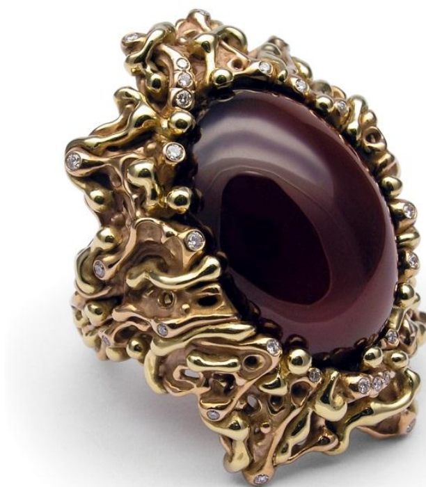
Рис. 5. Каблучка «Гібридне лиття #2: Карменер».

Під час лиття С. Дрокін використовує різні метали. Для поділу біметалевого лиття за видами різних металів йому довелося вводити власні терміни: «Titargium – титан, срібло; Titaarium – титан, золото; Titargarium – титан, срібло, золото; Cupargium – мідь, срібло; Cuparium – мідь, золото; Cupargarium – мідь, срібло, золото; Argarium – срібло, золото; при використанні золота різних сплавів та кольору – Aurarium, Viaarium» (Дрокін, 2020, с. 465).