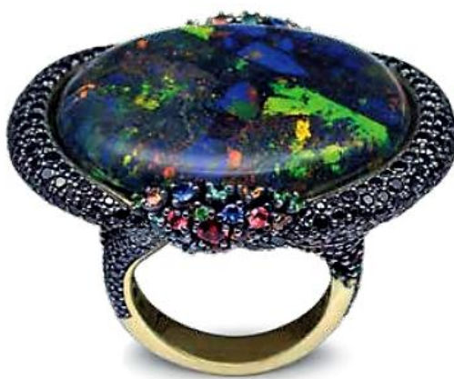
Рис. 3. Каблучка «Австралійська ніч».

В рамках фестивалю пройшла виставка робіт сучасних авторів, конкурс проектів ювелірних прикрас і упаковки серед молоді і студентів, а також семінар В.В. Індутного «Оцінка культурних цінностей».