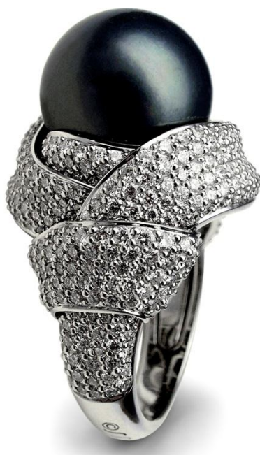
Рис. 4. Каблучка «Обі».

Каблучка «Австралійська ніч» (рис. 3) стала переможцем конкурсу «Краща ювелірна прикраса року» у номінації «Краща каблучка» та володарем призу «Золоте сузір'я» в рамках виставки «Ювелір Експо Україна 2012» в Києві, організованої ТОВ «Київський міжнародний контрактний ярмарок». Згодом, ця каблучка перемогла в номінації «Високе ювелірне мистецтво» конкурсу «Русская линия» в Москві в 2012 р. (Лауреаты и финалисты, 2013, с. 58).