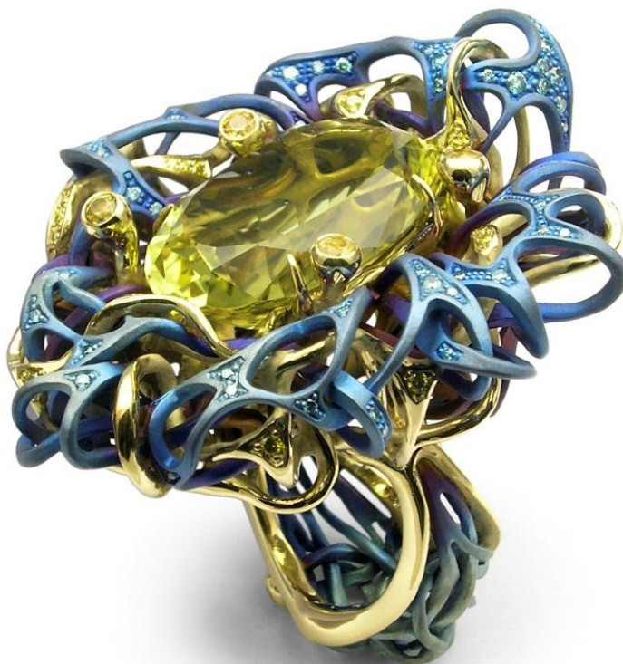
Рис. 7. Каблучка «Гніздо».

була третя перемога в США. «Я вирішив через мистецтво виразити проблеми демократії, рівності й свободи пересування. Каблучка «Гніздо» була виконана в національних українських синьо-жовтих кольорах... Я писав про перелітних птахів, для яких не існує кордонів, на відміну від художників – послів культури своїх країн, для яких не має бути перешкод, щоб ділитися своєю культурою та вивчати культуру інших країн» (Інтерв'ю з С.А. Дрокіним, 2021, арк. 29).