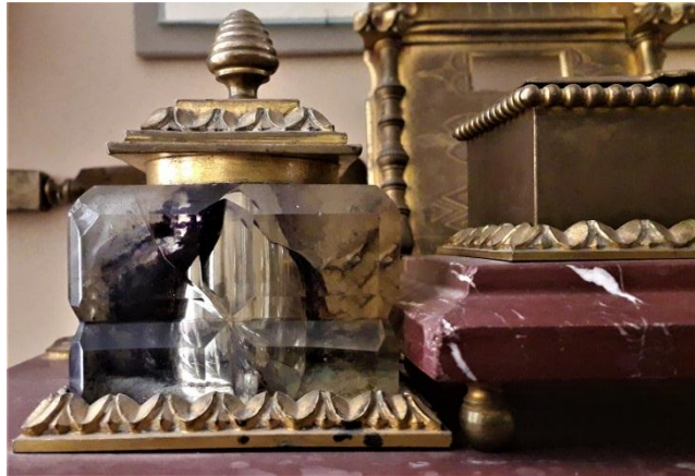
Рис. 5. Чорнильниця з чорнильного прибору Д. Граве. НМІУ

прихильник вищої жіночої освіти Д. Граве читав лекції на математичному відділенні Київських Вищих жіночих курсів. У 1920 р. Д. Граве було обрано першим математиком – дійсним членом Української Академії Наук і він очолив кафедру прикладної математики на фізико-математичному відділенні УАН. Пізніше Д. Граве викладав в Інституті народної освіти, Інституті народного господарства, інших київських вишах, у 1934 р. очолив новостворений Інститут математики АН УРСР 31 , на фасаді будівлі якого (вул. Терещенківська, 3) 13 лютого 2004 р. було встановлено меморіальну дошку Д. Граве (Самойленко, Строк, Сукретний, 2005, с. 97).