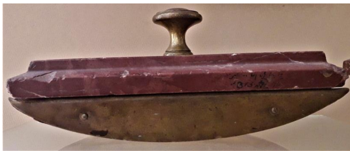
Рис. 3. Пресс-пап'є з чорнильного прибору Д. Ґраве. НМІУ

У нижній частині бронзової підставки для паперів гравійовано дарчий напис, про який йшла мова на початку статті.