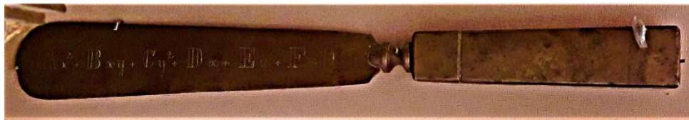
Рис. 7. Ніж для паперу з чорнильного прибору Д. Ґраве. НМІУ

зиму 1892 /93 рр. та відбувались двічі на тиждень. Їх дуже старанно відвідували не лише молоді офіцери останнього випуску, прикомандировані до піхотних полків Петербурзького гарнізону, а й літні топографи; не кажучи вже про те, що ні я, ні Бонсдорф не пропустили жодної з них. Певно, і тепер багато хто із вдячністю згадує безкорисливу працю нашого великого математика, нині професора університету у Києві. Він з чудовим мистецтвом умів викладати найбільш абстрактні та важкі питання з рідкісною простотою та ясністю. Добровільні слухачі подарували Ґраве після завершення “Курса” розкішний письмовий прибор з дарчим написом (курсив мій. – О. П.), який, певно, донині прикрашає робочий стіл Дмитра Олександровича... Лекції Ґраве так заохотили петербурзьких топографів до заняття науками, що деякі із них звернулись до мене з проханням детально пояснити їм ті розділи геодезії, які викладались в училищі дуже коротко або взагалі не вивчались... Він [Д. Ґраве. – О. П.] блискуче викладав в нашому училищі цілі три роки...” (переклад мій. – О. П.) (Витковский, 1927, с. 274–275, 280–281; Добровольский, 1968, с. 14–15).