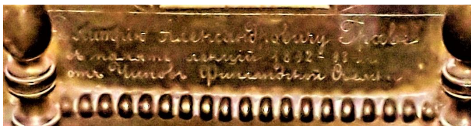
Рис.1 Дарчий напис Д. Граве на чорнильному приборі з НМІУ

У передній частині постаменту чорнильного прибору виготовлено видовжене заглиблення для ручок та олівців.