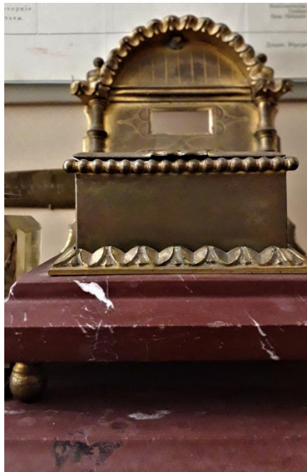
Рис. 6. Підставка для паперів з чорнильного прибору Д. Граве. НМІУ

він у 1893 р. став власником означеного чорнильного набору. Його Д. Граве подарували вдячні слухачі лекцій з вищої математики, які науковець читав в Управлінні військової топографічної зйомки Фінляндії та Санкт-Петербурзької губернії 34 для військових топографів, що прагнули підвищити власну кваліфікацію.