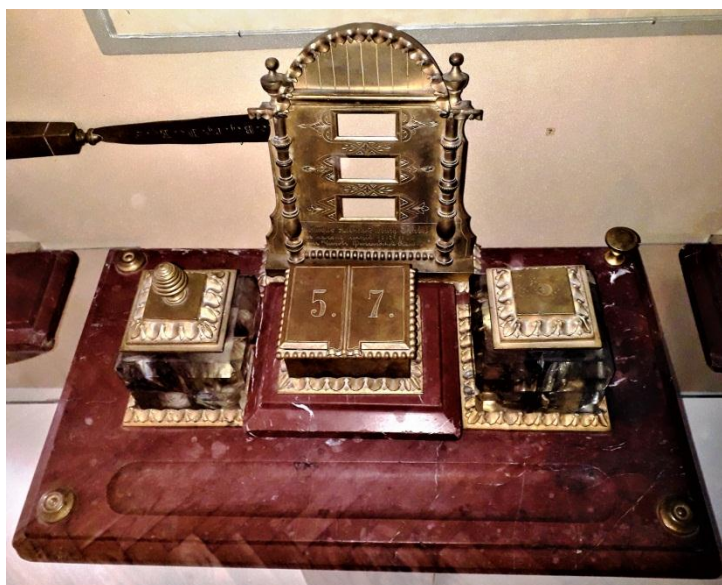
Рис. 2. Чорнильний прибор Д. Граве. НМІУ

Позаду чорнильниць та скриньки для марок на кам'яному постаменті вертикально встановлено бронзову пластину із заокругленим верхнім краєм та двома профільованими стовпчиками-балясинами – тримач для конвертів та аркушів паперу. Поверхня підставки для паперів декорована трьома розташованими один над одним прямокутними наскрізними отворами. Ці вирізи оконтурені гравійованим флористичним орнаментом, у малюнку якого можна вбачати мотиви, характерні для псевдо-російського художнього стилю 29 .