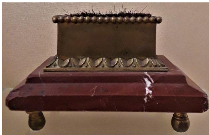
Рис. 4. Очисник для пер з чорнильного прибору Д. Ґраве. НМІУ

До означеного комплекту для письма також належить мармурово-металева прес-пап'є 30 з бронзовою ручкою, металева щітка для очищення пер на мармуровій підставці та бронзовий ніж для відкривання конвертів, прикрашений гравійованою алгебраїчною формулою.