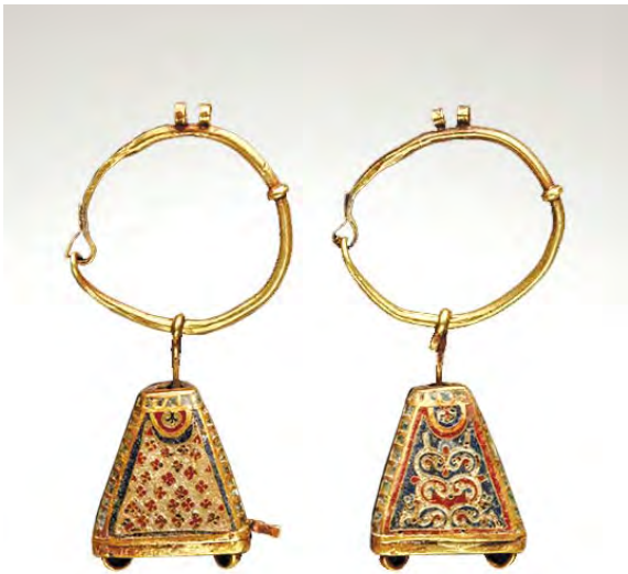
Рис. 5. Серезки з Національного археологічного музею в Таранто. XI ст.