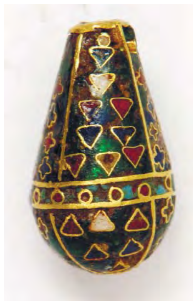
Рис. 17. Намистина (інв. № ДМ-1801). Варіанти геометричного орнаменту.