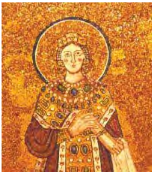
Рис. 1. Мозаїка із зображенням святої Агнії у вітарі церкви Сант-Аньезе-фуорі-ле-Мура в Римі. VII ст.