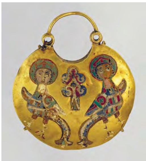
Рис. 3. Колт (інв. № АЗС-908) з Миропільського скарбу 1938 р..

Безперечно, вони могли використовуватись в якості самостійних підвісок до головного убору, оздоблених додатковими дрібними привісками. Саме такі підвіски зберігаються в музеї «Старовинний Несебр» в Болгарії (рис. 2). Представлені вони серед прикрас XVI-XVII ст. (Сокровищата на Несебър, б/г), хоча варто відмітити надзвичайну їх подібність за формою та мотивами декору експонату нашого музею, щоправда, меншого за розміром. Крім привісок, до краплеподібної підвіски могли бути прикріплені на стриженьках перлини, як в прикрасі, що зберігається в Британському музеї (museum number 1983,0502.1: інтернет-ресурс https://www.britishmuseum.org/collection/object/H_1983-0502-1 ). Вона, щоправда, названа сережкою, але якщо кільце не роз'ємне, не могла носитися у вусі, а мала бути прикріпленою, ймовірно, до якогось убору. Можливо, отвори на підвісці з нашого музею могли бути використані для кріплення такого декору.