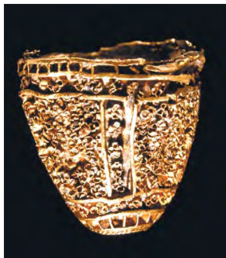
Рис. 11. «Наконечник» з Британського музею. X-XI ст. (за https://www.britishmuseum.org/collection/image/266364001 ).

Так, наприклад, прикрашені вже згадувані сережки з Таранто, «галицький колт», наверхня та підвіска з Метрополітен музею. Повністю покрита подібним орнаментом вся поверхня стіку із цього ж музею та «наконечник» з Британського музею (museum number 1985,1012.1; інтернет-ресурс https://www.britishmuseum.org/collection/object/H_1985-1012-1 ), який, судячи за формою, міг бути якраз частиною аналогічної підвіски (рис. 11). Цікаво, що такий прийом не застосований у виробих із