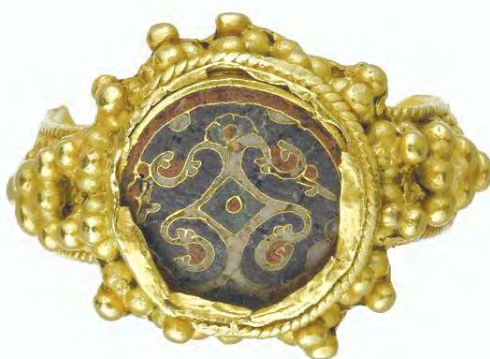
Рис. 10. Перстень з Музею Кюні. Остання чверть X – перша половина XI ст. (за https://www.photo.rmn.fr/archive/10-502550-2C6NU0Q57UOQ.html ).