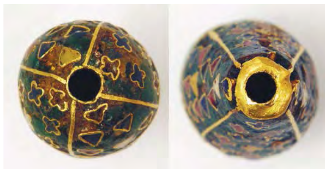
Рис. 18. Намистина (інв. № ДМ-1801). Вигляд верхньої та нижньої частин.