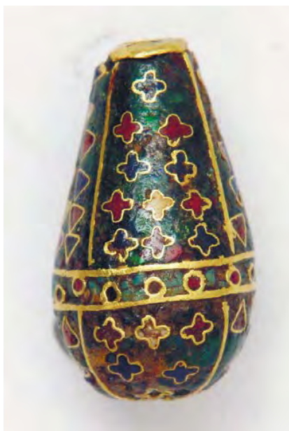
Рис. 16. Намистина (інв. № ДМ-1801). Варіанти геометричного орнаменту.

Відрізняється і техніка виконання цієї намистини, в якій перегородчаста емаль поєднується із виїмчастою емаллю ( champlevé ). Емалі гарної збереженості, без помітних втрат, перегородки чіткі та грубіші, ніж у виробу, що, ймовірно міг слугувати взірцем для майстра, який виконував цю намистину. Можна сказати, що основною рисою виконання ним малюнку є примхлива недбалість імпровізації, не властива середньовічному мистецтву взагалі і візантійському зокрема.