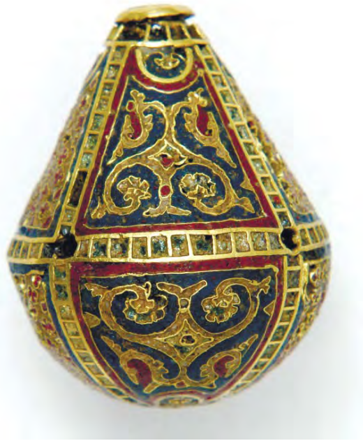
Рис. 7. Підвіска (інв. № ДМ-1803). Декоративне поле із зображенням пальмети.

По краях поля хрестики зображені не повністю, іноді помістилися в полі лише три лопаті хреста, іноді зображено півколо, яке можна сприймати як одну лопать. Емаль, що заповнювала хрестики, значною мірою втрачена. Поля синього кольору заповнює рослинний орнамент, який умовно можна назвати складною пальметою (рис. 7). Роздвоєне у нижній частині «стебло» розширюється в середині в ромбоподібну фігуру, від якої в сторони і вниз відходять два симетричні пагони, що закручуються до стебла і завершуються п'ятипелюстковою «квіткою», утворюючи серцеподібну фігуру. У місцях вигину від пагонів відходять невеликі відростки. У верхній частині «стебло» роздвоюється, перетворюючись на два також симетричні пагони, що круто згинаються до низу, з вигнутими вгору кінчиками. Малюнок пагонів ускладнюють кілька невеликих відростків. Емаль пагонів біла з невеликими червоними крапками. Особливість подібного орнаменту у використанні червоних крапок поза перегородками, у місцях вигину верхніх пагонів. Орнаментальні зображення дзеркально симетричні у верхній та нижній частині підвіски.