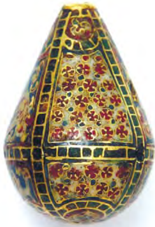
Рис. 14. Намистина (інв. № ДМ-1802). Декоративне поле із зображенням хрестиків.

блакитний, додається зелений, який теж змішується, створюючи враження райдужної плівки. Окремі елементи непритаманного для таких виробів жовтого кольору. Сам малюнок орнаменту не симетричний і створює враження начерку на відміну від виважено симетрично побудованих візантійських орнаментів, в яких кожний елемент органічно пов'язаний з іншими. Якщо в орнаменті предмета за інв. № ДМ-1803 пагони складаються у серцеподібну фігуру, то в даному випадку схоже, основою є серцеподібний елемент, доповнений завитками, «крапельками» та свослідною трипелюстковою «конюшиною». Ці трипелюсткові квіточки – ще один дивний мотив, який не зустрічається серед відомих візантійських перегородчастих емалей. Хоча загалом контури малюнку ніби знаходять відповідність у живописній орнаментиці XI ст. (Орлова, 2007, с. 326-357, рис. 340, 341), але його