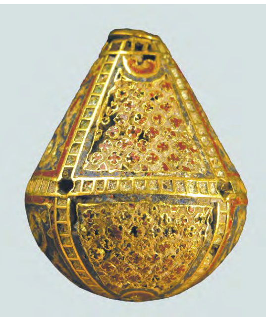
Рис. 6. ДМ-1803. Декоративне поле із зображенням хрестиків.

пояском, який охоплює підвіску по колу в найширшій її частині. Пояски утворені паралельними перегородками, між якими на рівній відстані розміщені короткі перегородки. Таким чином, утворюються квадратні ячейки, заповнені інкрустацією зеленого кольору, значною мірою втраченою. Такі ж пояски обрамляють отвори у верхній та нижній частині підвісок. У місцях перетину вертикальних поясів з горизонтальним розташовані отвори, які, ймовірно, могли використовуватися для кріплення додаткових привісок, як, наприклад, у підвісок з музею в Несебрі або для кріплення перлин на спнях, як на серезці з Британського музею. Горизонтальний поясок ділить поверхню підвіски на дві частини, у кожній з яких чотири поля, з синім і білим кольором емалі фону, що чергуються. Білі поля по периметру обрамлені синьою смужкою, сині червоною. Білі емалеві поля заповнені зображеннями численних (більше тридцяти на кожному) чотирикінцевих червоних хрестиків з розширеними лопатями (рис. 6).