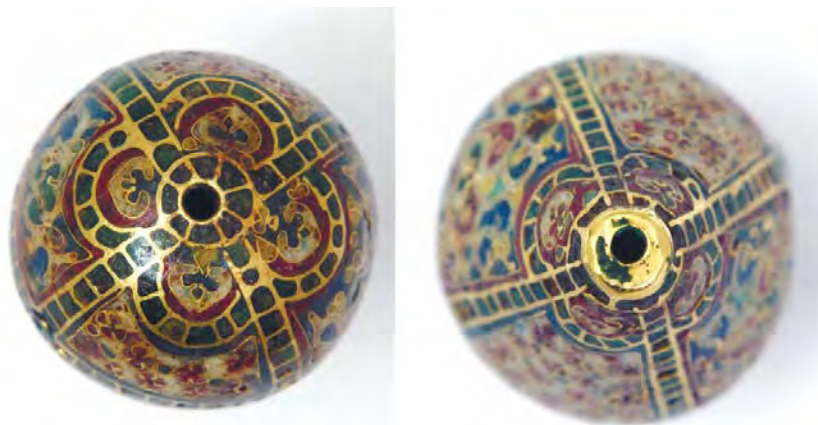
Рис. 15. Підвіска (інв. № ДМ-1803). Вигляд верхньої та нижньої частин.

Орнамент, що оточує отвори, побудований начебто за тим же принципом, що і на предметі за інв. № ДМ-1803, так само використана «манжета» навколо верхнього отвору, однак колір півкруглих виступів-пелюсток не чергується, присутні нелогічні деталі, відбувається змішування кольорів (рис. 15).