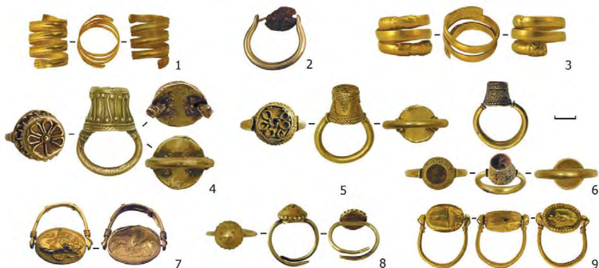
Рис. 7. Спіралеподібні та «оригінальні» персні: