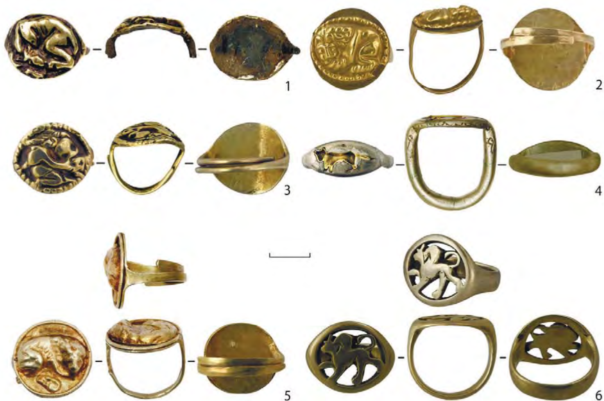
Рис. 6. Персні з зооморфним або антропоморфним зображенням на щитку:

Персні з рельєфними зображеннями на щитку були у складі декоративних елементів вбрання жінок з аристократичних шарів.