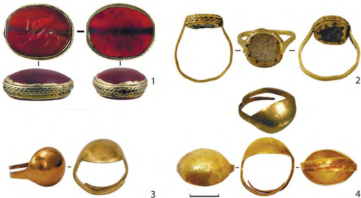
Рис. 5. Інші типи пернів