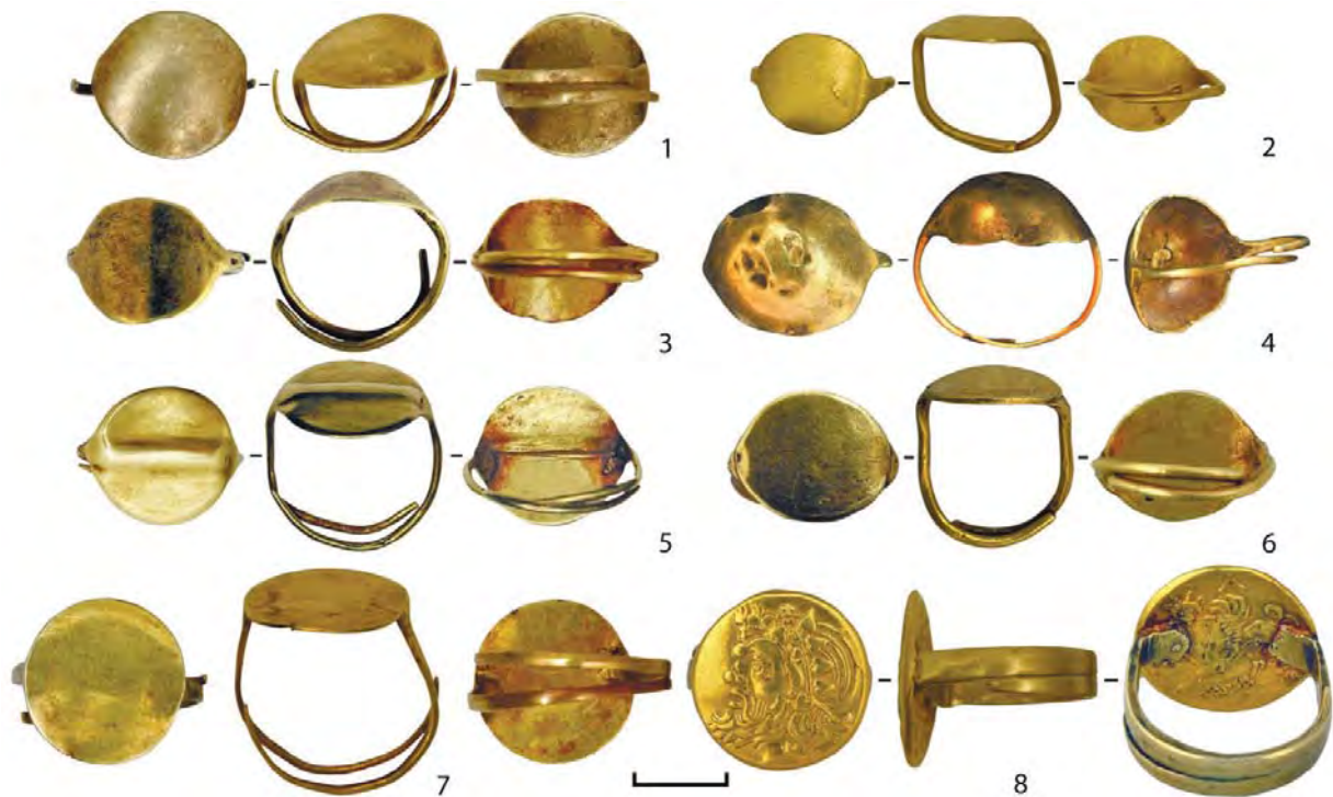
Рис. 2. Пластинчасті персні:

- з круглими та овальними щитками та незімкненими прямокутними дужками шинки: