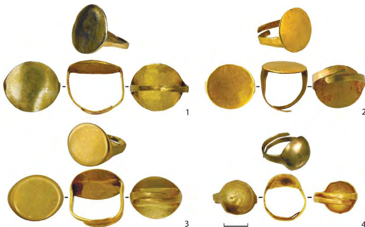
Рис. 3. Литі персні:

За такою ж схемою зроблено перстень зі щитком із грецької монети (статер Пантікапею, 5-й тип за В. А. Анохіним). До неї з двох боків припаяні дві пластинки зі звуженими кінцями. Вони заходять один за одного, утворюючи шинку (інв. № АЗС-3100) (Рис. 2, 8). Аверс монети: голова бородатого Сатира у вінку з плюща, обернена у профіль праворуч, реверс: образ рогатого левиноголового грифона. Зображена у профільному ракурсі міфічна істота крокує вправо по колоску зі списом у пащі. Над розправленим крилом грифона літера “А” від напису "ΠΑΝ", крайні літери якого закриті напаяними дужками персня (D щитка-монети – 20 мм; D шинки – 19 мм; дужки: ширина – 3-1 мм; товщина – 1,5 мм). За формальною типологією В. Г. Петренко прикраса відноситься до відділу IV, тип 18 (Петренко, 1978, с. 63). Перстень зі щитком-монетою в колекції музею тільки один. Знахідка походить з кургану № 9, поховання № 1 поблизу с. Мар’ївка Запорізької обл. У могилу в різний час помістили двох небіжчиків – чоловіка і жінку. Поховання пограбоване за давнини, проте в ньому залишились деякі декоративні елементи, мабуть, із вбрання жінки: золота кільцеподібна сережка з підвісками, пластинки-аплікації, напівсферичні гудзики, намисто зі склоподібної маси. Перстень, можливо, належав чоловікові і був знаком його високого положення у своїй соціальній групі (Бунятян, Фіалко, 2009, с. 58, 63, 66-67, рис. 9, 1).