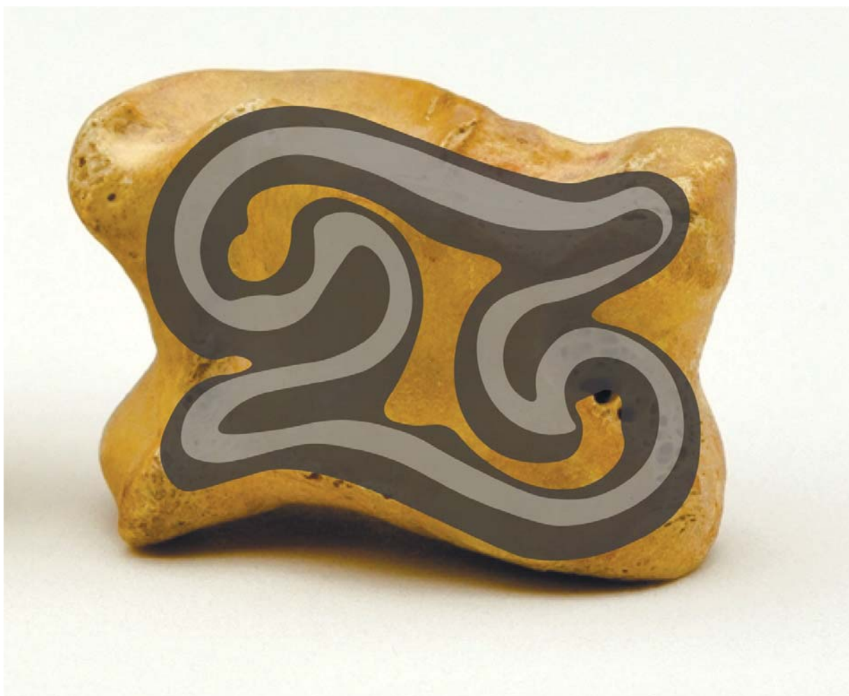
Рис. 2. Зовнішні контури астрагалу та пластинки з Ногайчинського кургану.

За конфігурацією та співвідношенням сторін такі нашивні пластинки більше нагадують астрагали, при цьому подається вид кістки дещо зверху, коли видно одну основну та одну довгу бічну грані (рис. 2).