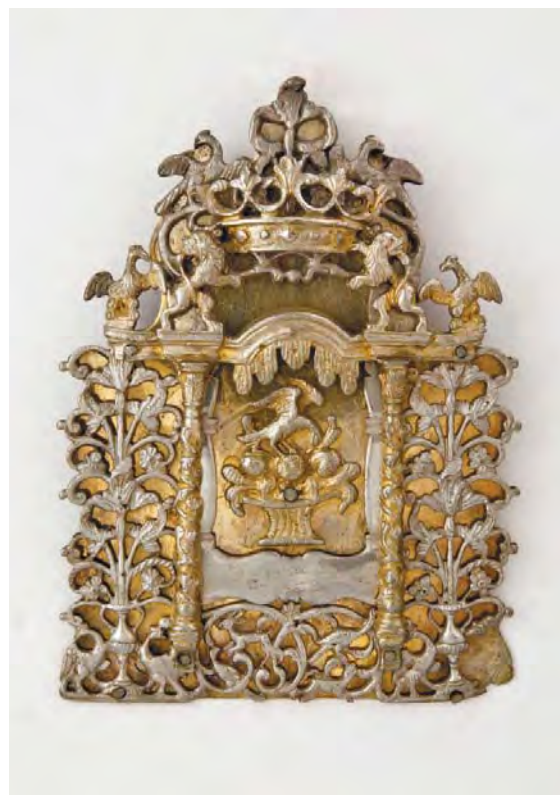
Рис. 1. Щит до сувою Тори із синагоги м. Чорнобиль.

Щит до сувою Тори з синагоги м. Чорнобиль (інв. № ДМ-2099) традиційний за формою – прямокутний з аркоподібною верхньою стороною. Срібна золочена пластинчата основа щита декорована ажурною прорізною накладкою. В центрі декоративного простору – рельєфне зображення кошика з плодами та листям, зображення орла з опущеною головою і розпростертими крилами. Оточує композицію зображення порталу у вигляді двох витих оздоблених гірляндами колон з капітелями, які з'єднані ступінчастим арочним фризом з трилисниками. Увінчують колони зображення левів, які стоять на задніх лапах, а передніми підтримують корону дворянського типу. Над короною – зображення двох орлів на фоні рослинного орнаменту. Дві скульптурні фігурки орлів розміщені і по обидва боки від левів. Справа та зліва від колон зображені «вазони» – пагони з листям та квітами у глечиках, які фланкують пари орлів. В нижній частині щита, між колонами, вміщені в стрічковий рослинний орнамент стилізовані зображення двох зайців та двох птахів.