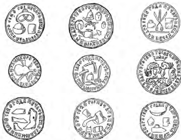
Рис. 4, 5. Печатки київських ремісничих цехів (за М. Корниловичем).

Відбитки київських цехових печаток на документах Управи київських ремісничих цехів 38 вивчав дослідник М. Корнилович (1928) (Корнилович, 1928, с. 307–311), п'ять матриць київських цехових печаток із зібрання ВІМ (попередника НМІУ) – Д. Щербаківський (1925) (Щербаківський, 1925, с. 45–48) (рис. 3–6).