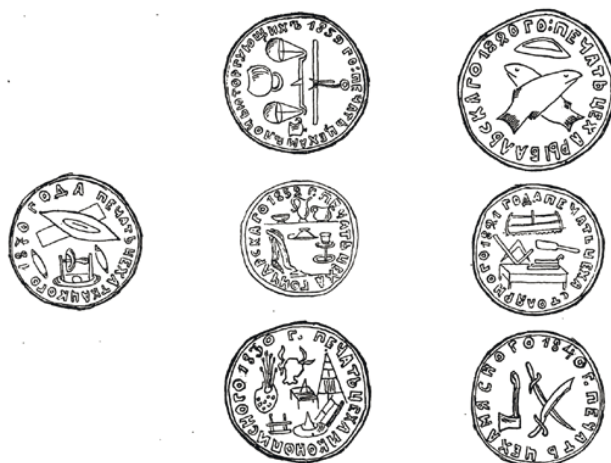
Рис. 6. Печатки київських ремісничих цехів у зібранні Всеукраїнського історичного музею ім. Т. Шевченка (за Д. Щербаківським).