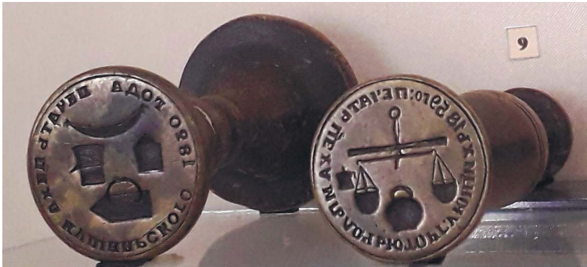
Рис. 3. Печатки кушнірського, ткацького та крамарського київських ремісничих цехів (за Д. Щербаківським та М. Корниловичем).

і характер виробництва кожного окремого цеху. На печатках не було таких символічних ознак, як герби, або релігійні виображення, що були на корогвах тих-таки цехів. Фахові ознаки на цехових печатках являли собою не якісь застарілі, постійні, за традиціями символічні виображення. Символи наших цехів на печатках – це, без сумніву, в більшості випадків досить примітивно сконструйований конгломерат усіх тих предметів, що їх намальовано було на вивісках цехових майстрів» (Корнилович, 1928, с. 308).