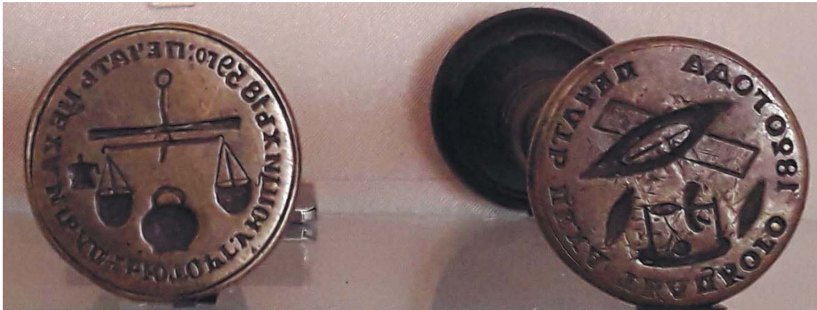
Рис. 1, 2. Матриці печаток кушнірського, ткацького та крамарського київських ремісничих цехів у експозиції НМІУ.