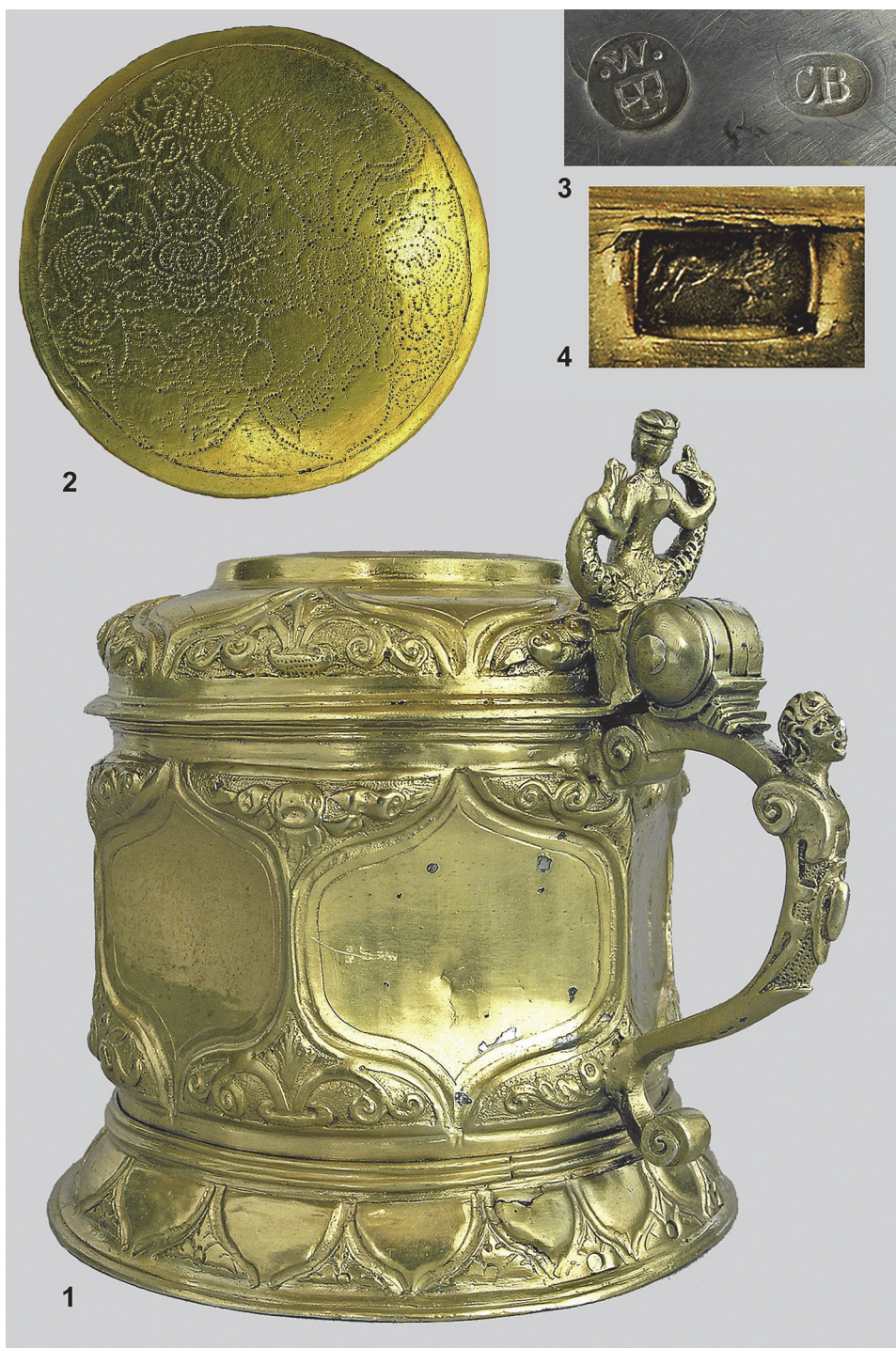
Рис. 1. Кухоль, початок XVII ст.: 1 – загальний вигляд; 2 – шлюбний герб на кришці кухля; 3–4 – клейма на кухлі