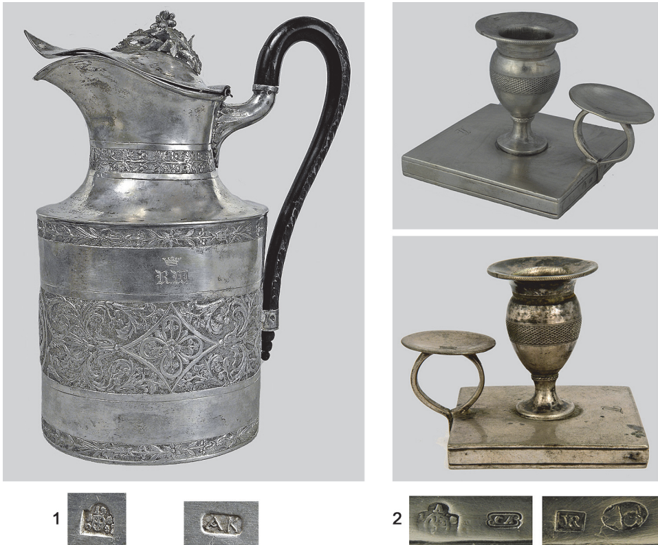
Рис. 3. 1 – глечик, клейма на ньому, 1706 р.; 2 – свічники, клейма на них, 1806 р.

Срібний глечик (ДМ-4811) за формою циліндричний з високою шийкою, з широким виливом, кришкою на шарнірі та дерев'яною С-подібною ручкою (рис. 3, 1). Шийку опоясує вузький обідок з узором-гірляндою у вигляді пагона, на якому симетрично розташовані по черзі листя та ягідки. Подібні вузькі орнаментальні паски прикрашають і корпус вгорі та знизу, а по середині він оздоблений широким орнаментальним паском з розеток, вписаних в геометричні фігури різної форми. На гладенькій поверхні над цим паском вирізьблена корона та ініціали «R.W.» (вірогідно, власника) під нею. На фігурній кришці, що плавно прилягає до виливу посудини, разом з останньою нагадуючи дзьоб птаха, накладна лита гілочка оливи з листям та плодами. Предмет виготовлено в стилі ампір, який часто розглядають як завершальний етап класичного стилю. На дні глечика поставлені наступні клейма: державне пробірне клеймо з гербом Відня, датою «1806», лотовою пробою срібла «13», яке ставили протягом 1791–1806 р. [Rohkwasser 1983, s. 74].