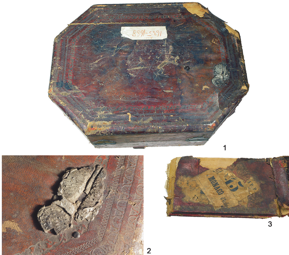
Рис. 7.1 – футляр для набору парадного посуду; 2–3 – печатки та марка на футлярі

Привертає увагу і нарядний кришталевий в срібній оправі глек для вина (ДМ-7256) (рис. 8, 1), що датується останньою чвертю XIX ст. Державне пробірне клеймо на ньому (рис. 8, 2) трохи збите, проте, безсумнівно, це витвір віденського майстра. Овоїдний корпус глека виконаний з кришталю, огранованого різними за формою повздовжніми смугами. Шийка посудини виготовлена зі срібла, позолочена, з фігурними вінцями з широким виливом, по контуру підкресленим профільованою смужкою. Ручка срібна, за формою S-подібна, гранчаста. Нижня частина ручки роздвоєна, приєднуючись одним кінцем (у формі закрученого листа) до срібного обідка на корпусі, а верхнім у формі завитка до ланцюжка, з допомогою якого прикріплена кришка посудини. Кришка глека півсферична, завершена литою фігуркою орла з піднятими догори крилами, розміщеною на постаменті у формі котушки. Основа предмету кругла, східчаста з загнутим донизу вузьким краєм. На ній і вибиті наступні клейма: австрійське пробірне клеймо (голова Діани у п'ятилиснику, що засвідчує третю австрійську пробу для срібла), яке ставили протягом у 1867–1922 р. [Rohkwasser 1983, s. 75]; клеймо фірми «G&S», на жаль, не ідентифіковане.