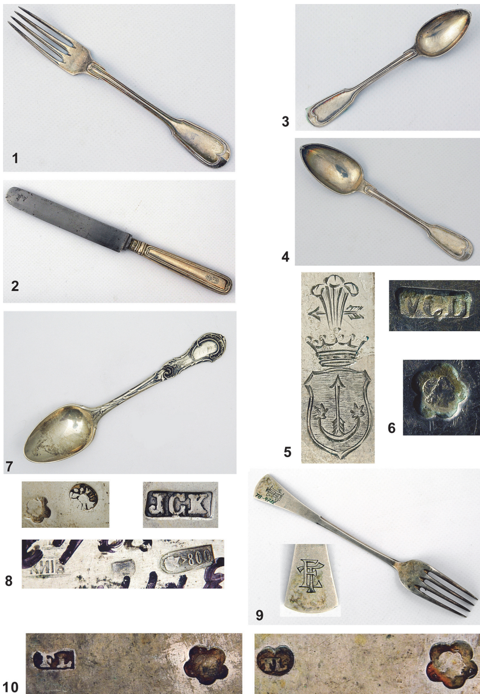
Рис. 9. 1–4 – столові прибори, кінець XIX ст., майстер Вінцент Карл Дуб; 5 – герб Сас на столових приборах; 6 – клейма на столових приборах; 7 – ложка десертна, 1872–1888 р., майстер Йозеф Карл Клінкош; 8 – клейма на ложці; 9 – виделка з набору, початок 1910-х рр.; 10 – клейма на виделках