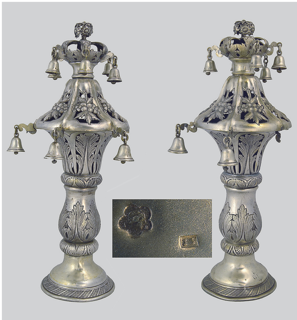
Рис. 10. Римони; клейма на римонах, остання чверть XIX ст.

Окремо хотілося б виділити віденську юдаїку. Мова йде про парні срібні римони (ДМ-7305, 7306), які датуються останньою чвертю XIX ст. (рис. 10). Вони вазоподібної форми, увінчані коронами, з підвішеними дзвониками по краях. В орнаментальному декорі обох – карбоване листя аканту, букети квітів. На обох поставлені наступні клейма: державне пробірне клеймо у формі п'ятилисника з головою Діани праворуч, цифрою 3 (800-тої проби срібла) та літерою «A» – шифром віденської пробірної встанови (клеймо ставили протягом 1872–1922 р.) [Rohwasser 1987, s. 75]; клеймо виробника «JZ» (не ідентифіковане). В них відчувається вправність майстра, котрий вдало поєднав струнку форму з вишукано-стриманими елементами оздоблення, виконавши їх в класичному стилі.