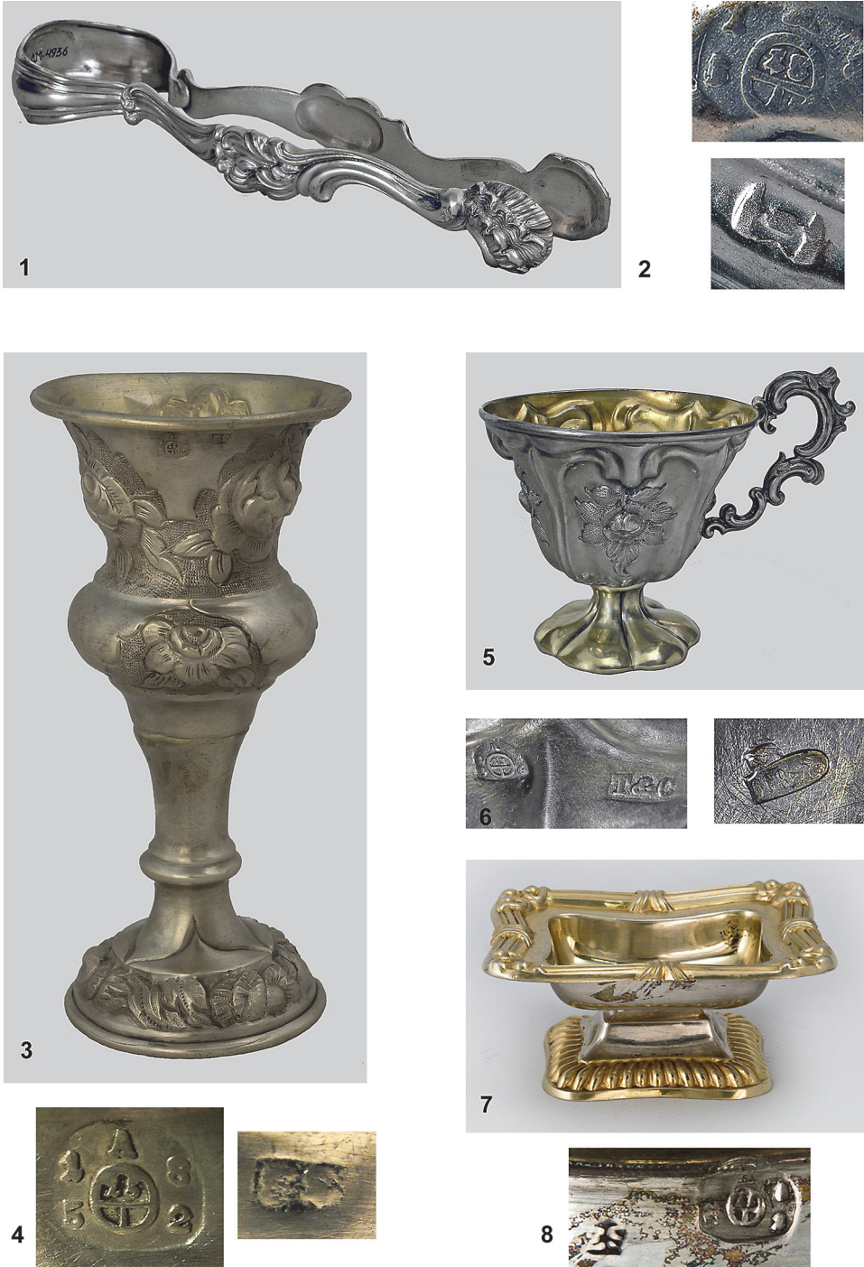
Рис. 4. 1 – щипці для цукру, 1850-ті рр.; 2 – клейма на щипцях; 3 – келих, 1856 р.; 4 – клейма на келиху; 5 – чашка, 1856 р.; 6 – клейма на чашці; 7 – сільничка. 1852 р.; 8 – клейма на сільничці