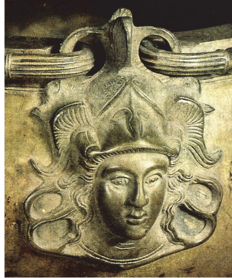
Рис. 5. Горельєфне зображення голови Афіні. Декоративна накладка на ситупі

походить з фракійських центрів Карпатського басейну і відноситься до VI–V ст. до н.е. [Ганіна 1965, с. 106–119]. Наукові висновки Оксани Давидівни увійшли до праць, в яких узагальнено матеріали археологічних досліджень на території України [Археологія 1971, с. 98, 100, 122, 123].