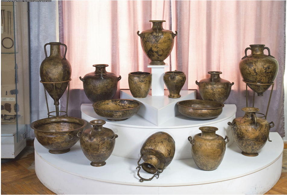
Рис. 3. Сервіз античного посуду. Знахідка поблизу с. Піщане (Черкаська обл.)

Деякі посудини прикрашені накладними скульптурними зображеннями. О.Д. Ганіна приділила багато уваги саме цим декоративним елементам. Серед них – бронзові лев'ячі маски, розміщені під ручками однієї з амфор (рис. 4). У наборі посуду 5 гідрій, на двох з них – металеві аплікації різних сюжетів: голова сирени, зображення орла, який тримає в кігтях і дзьобі змію. Рельєфними накладками оформлені обидві ситули. На одній вміщені пластини із зображенням пальмет з листям, що звисає донизу. На другій посудині – горельєфні зображення голів: з одного боку лева, а з другого – Афіни (рис. 5). На обох лутеріях також прикріплені накладки: на більшій посудині – сирена у фас, а на меншій – дві литі аплікації із зображенням грифона, який шматує лань. Вивчення цих зразків художньої обробки бронзи показало, що коло образів, манера їх відтворення – все це є втіленням традицій еллінського мистецтва рубежу VI – V ст. до н.е.