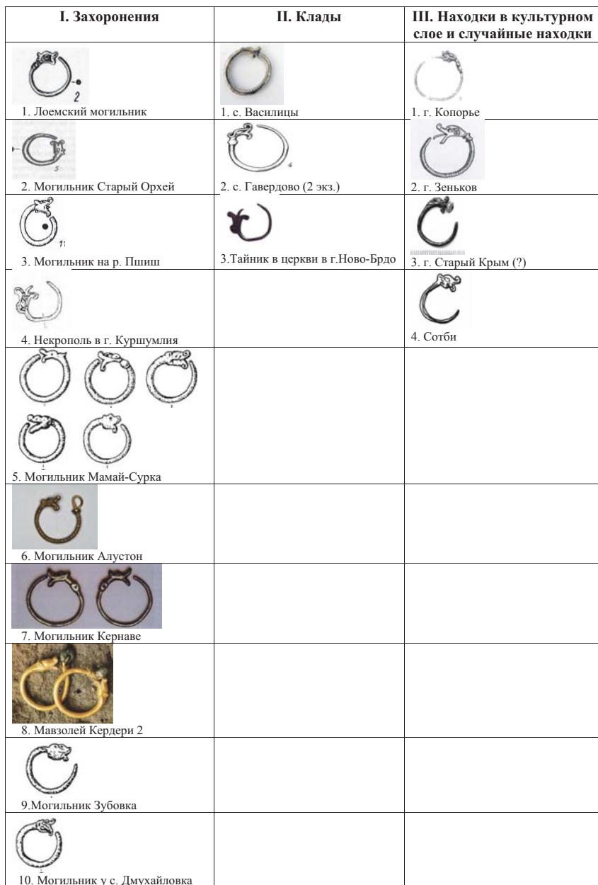
Рис. 1. Змеевидные кольца-серьги.