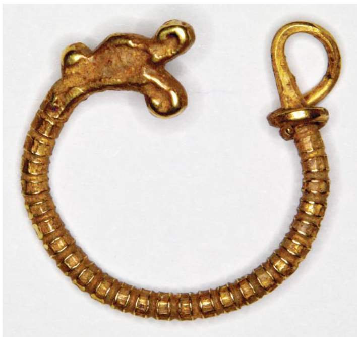
Рис. 2. Алустонский могильник, захоронение № 40 (инв. № АЗС-1571).