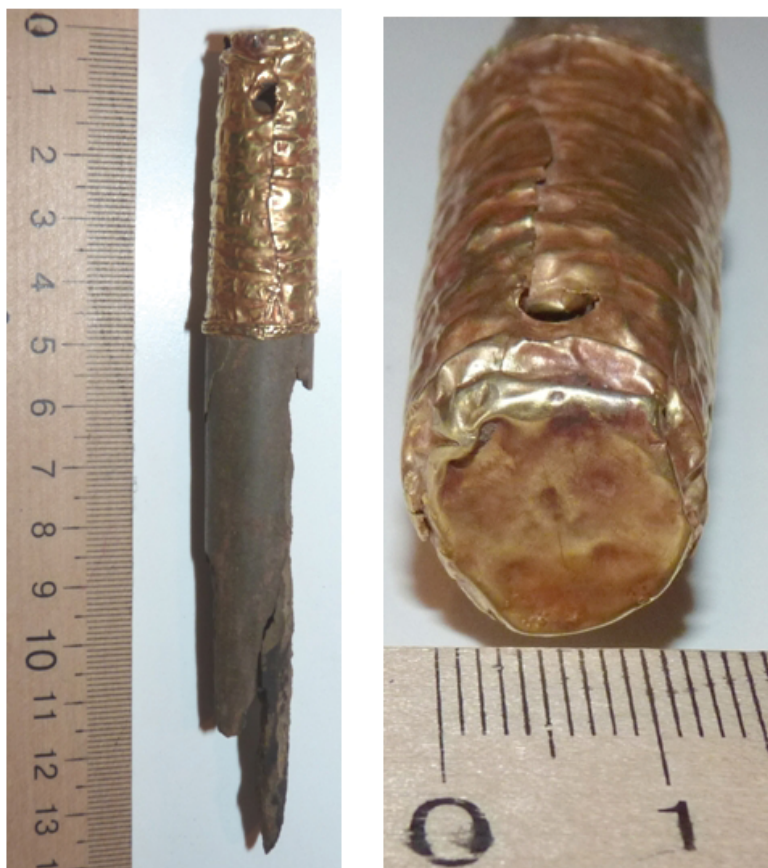
Кам'яний осілок з декоративною золотою ручкою курган «Скіфська Могила», Мотронинське городище, 2002