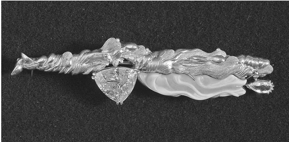
Рис. 2. Хоменко В. Брошка «Зелений затон». Срібло, перламутр, криштал, аметист. Ручне моделювання, литво, монтування. 1984. Власність автора

впевнено можна назвати його власними авторськими знахідками. Серію з трьох брошок «Зелений затон», «Дюна», «Комета Галлея» (1984 р.) виконано в техніці ручного моделювання металу в одному стилістичному ключі, проте кожна з них є самостійним довершеним арт-об'єктом.