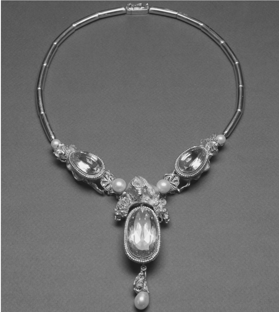
Рис. 6. Хоменко В. Кольє «Під сузір'ям Тільця». Золото, діаманти, берили, перлини. Ручне моделювання, литво, карбування, монтування, випилювання. 2011. Приватна колекція

Творча манера провідного ювеліра України Віталія Федоровича Хоменка сформувалася під впливом глибокого розуміння історії розвитку мистецької стильової парадигми України у царині ювелірного мистецтва та тонкого художнього світовідчуття. Діяльність В. Хоменка спрямована на оновлення художньої мови, зокрема за рахунок формального експерименту – основи творчого методу та вдосконалення художньої форми шляхом аналізу її складових. Ювелірним творам мистця притаманна технологічна складність, яскрава образність та пластичність, у них синкретично поєднано різностильові ознаки, а також свобода творчої фантазії, що відображається в оригінальній образності й формотворенні, характерних для світових модерних пошуків.