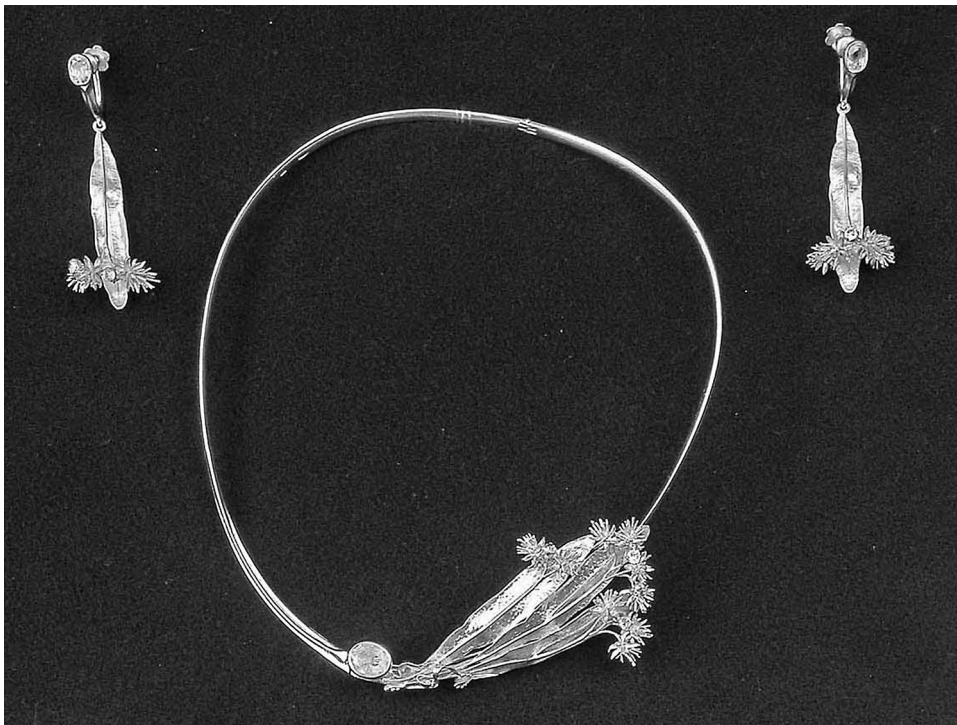
Рис. 1. Хоменко В. Гарнітур прикрас «Липовий цвіт»: сережки, кольє. Срібло, аквамарини, демантоїди. Воскове моделювання, литво, карбування, гравіювання, монтування. 1982. МІКУ

До особливо реалістично виконаних творів належить гарнітур прикрас «Липовий цвіт» (кольє, сережки), що, за висловом самого Віталія Хоменка, репрезентує так званий біонічний напрям у його творчості. Кольє, виконане у вигляді жорсткого срібного обруча з центральною частиною, формує образ гілочки липи. Підкреслений натуралізм виконання найдрібніших ліній на листках та суцвіттях рослини в техніках карбування та гравіювання, де природні форми та стриманий тон вставок із аквамаринів і демантоїдів є особливо подібними до реальних, створюють природний і рівноважений образ прикраси.