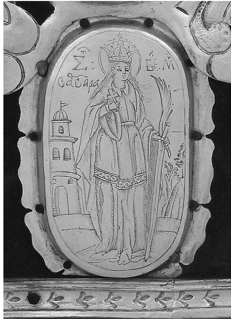
Рис. 5. Зображення Св. Варвари

Так, архангел Михаїл (на нижній дошці окладу) одягнутий на візантійський манер – у коротку туніку з оздобами та довгий хітон. Привертає увагу одяг на св. Варвари (рис. 5). На ній – довге плаття, поверх – каптан із довгими широкими рукавами, на талії – пасок, низ подолу облямовано широкою стрічкою з орнаментом. У XVII столітті різноманітний верхній одяг як жупан, каптан, кунтуш були складовою частиною гардеробу українських шляхетних жінок. В іконографії та живопису одяг відзначався надзвичайною декоративністю та насиченістю орнаменту, але відтворити святкову яскравість костюму не можна було у гравірованому малюнку на металі 9 . На гравірованому зображенні, використовуючи технічні прийоми,