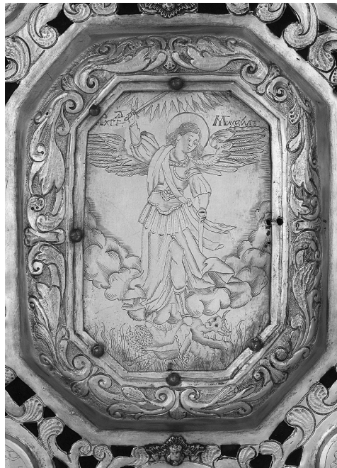
Рис. 4. Зображення архангела Михаїла

Розташування медальйонів планове з перспективою на основну центральну композицію – середник окладу (рис. 4). Ця пластина (зі зрізаними кутами) має гравіроване зображення архангела Михаїла, який попирає ногами диявола, у правій руці він тримає меч, в лівій – піхви. Зображення окантовано рамкою з карбованим візерунком у вигляді вузького листя аканту (саме не широкий акант був притаманний українській бароковій школі). Зверху та знизу головного зображення розташовані круглі медальйони з сюжетами з чудесами архангела Михаїла. Культ цього небесного заступника був поширеним ще з часів Київської Русі. Він вважався покровителем князів і патроном Києва. На честь архангела Михаїла була названа велика кількість церков по всій Україні. Образ архангела Михаїла знайшов широке поширення у сакральному мистецтві, зокрема в іконописі як невід'ємному атрибуті християнського віровчення. У давньоукраїнському мистецтві найбільшої популярності набула іконографія архангела зі сценами діянь. Вибір сюжетів діянь не був строго регламентований каноном і тому залишався за іконописцем чи замовником.