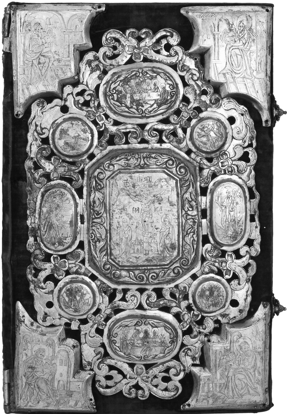
Рис. 6. Євангелія ДМ-4367 – верхня дошка