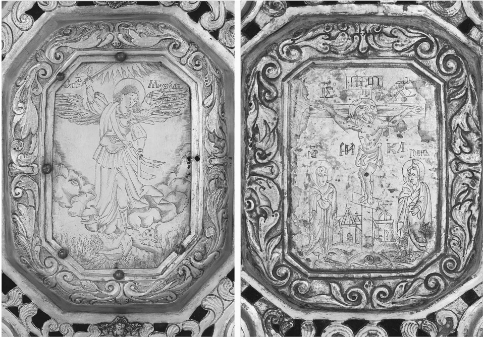
Рис. 7. Аналогічні пластини з окладів ДМ-1512 та ДМ-4367

Так, культова книга стала музейною одиницею. 20-ті роки ХХ століття роки, це той час, коли впроваджувалась політика нищення музейної галузі, експонати передавались з одної установи до іншої. В 1933 році Народний Комісаріат Просвіти України видав директиву про передачу музейних цінностей з дорогоцінних металів на зберігання Держбанку. Так, Євангеліє (інвер. № 4964) в 1934 році опинилось в Київській конторі Держбанку, в 1941р. – у Держсховищі СРСР у Москві. У 1946 році цінності, які виціли, повернули до Всеукраїнського історичного музею ім. Т.Г. Шевченко, в 1964 році частина експонатів була передана до новоствореного Музею історичних коштовностей України 12 . Ці рідкісні, унікальні та цінні речі прикрашають експозицію МІКУ або зберігаються у відділі фондів. Сподіваємось, що з часом найдавніші оклади Євангелія ХVІІ століття будуть демонструватися серед робіт українських золотарів в експозиції Музею історичних коштовностей України.