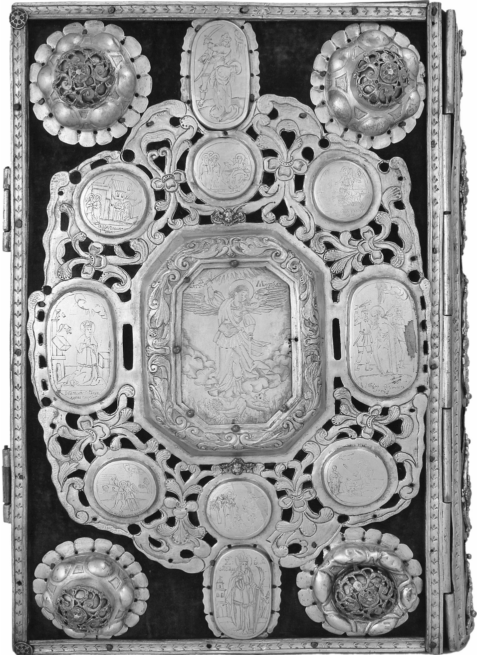
Рис. 3. Нижня дошка Євангелія

Після себе Феодосій Софонович залишив історичні праці, такі як відомий твір «Виклад о церкві святих», «Мучение святой великомучениці Варвари», «Житіє» (житія св. Володимира), «Хроніка з літописців