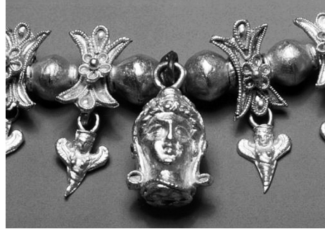
Рис. 4. Ожерелье из кургана Огуз.

цветочками. Снизу к этим звеньям подвешены интересные маленькие подвесочки в виде женской гермы с крыльями, очевидно – стилизованные изображения скифской крылатой богини («Первоначально герма – каменный столб, путевой знак, позже на верхней его части стали помещать изображение Гермеса – охранителя дорог и путников; со временем гермами стали называть поясные статуи, изображавшие богов и людей») 8 . Весьма интересный