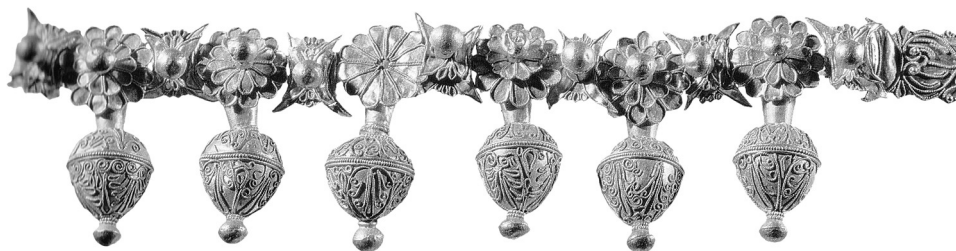
Рис. 3. Ожерелье из Гомолиона.

3) Ожерелье северогреческого происхождения, найденное в Гомолионе, Фессалия (рис. 3), 330–300 гг. до н.э. В тонком ювелирном изготовлении сочетаются зернь и филигрань. Подобные типы так же чередующихся деталей характерны для изделий северогреческого происхождения 5 . Также составлено из розанов, как и ожерелья из Таранто и из Нимфея. В качестве сердцевинки двухъярусных круглых розанов закреплены шарики. Шарики чуть покрупнее закреплены и в серединах цветочков с лунными серпиками. Богато декорированы подвески – амфориски.