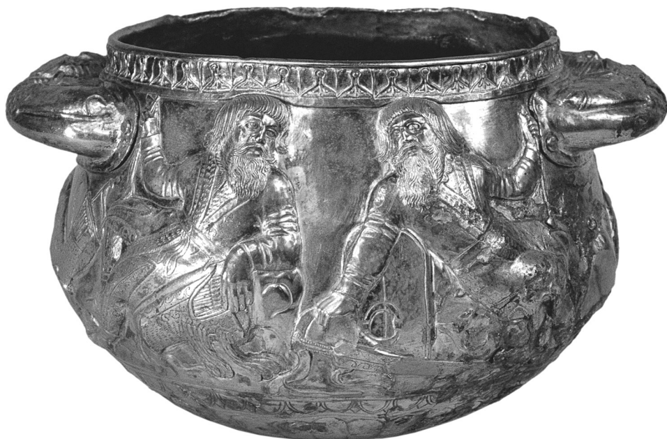
Рис. 10. Орнамент окантовки чаши из кургана Гайманова Могила.

Части эллино-скифской и древнегреческой торевтики с рассматриваемым орнаментом, в частности, золотые накладные орнаментальные ленты на бронзовом панцире и разделительные орнаментальные полосы на горитах из гробницы Филиппа II македонского и из Мелитопольского кургана, окантовка чаши из кургана Гайманова Могила тоже сохраняют функцию обрамления композиционных сцен или конструктивно-декоративных частей (рис. 10). Эти предметы военного снаряжения и вместе с этим декоративно-прикладного искусства тоже наделены определённой тектоникой.