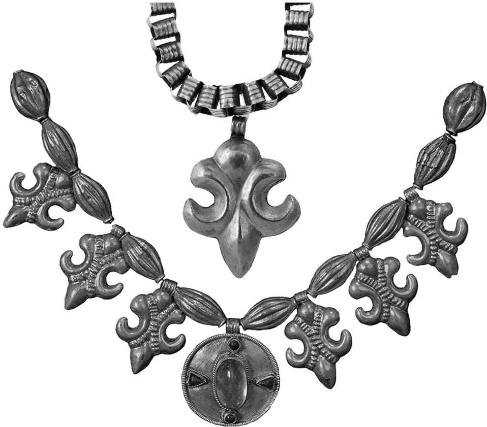
Рис. 7. Кривовая подвеска на цепочке с Княжей горы в Каневе. Крины из клада из села Сахновка.

Детали в виде выраженных и сильно стилизованных сдвоенных лун есть в старинных и, сделанных по их образцам – современных, серьгах голубцах и одинацах. Весьма плодотворна тема и в современном ювелирном искусстве. Например: серьги Мэтью Кэмпбелла Лоренца, основателя ювелирного бренда M.C. L Design. «Силянки» (от сила) – «крызы» нанизанные из разноцветного бисера тоже, встречается, сохранили архаичную схему. В частности, на крызе из Закарпатья, конца XIX ст., у горловины расположен узор, в котором просматриваются «розань» и охватывающие их «лунь».