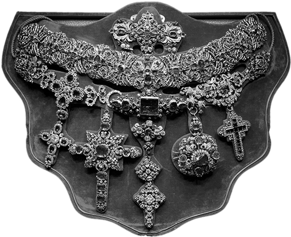
Рис. 6. Ожерелье Святого Януария.

К античным образцам восходит, наиболее вероятно, ожерелье Святого Януария (рис. 6), сделанное ювелирным мастером Микеле Дато в 1769 году для позолоченного серебряного бюста святого, установленного в капелле, где хранятся его мощи 15 . В композиции в центрах цветов-розанов, и круглых и с серпами звеньев, расположены крестовидные формы, но они дополнены и лепестковыми. Ожерелье очень насыщено и по композиции, и по рисунку, и по цвету. Оно изобилует самоцветами. Их невероятная роскошь и витражные цветовые сочетания соответствуют моде того времени и практике в эстетике драгоценностей католической церкви.