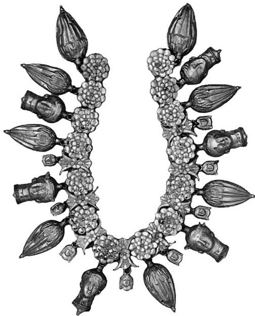
Рис. 2. Ожерелье из Таранто.

1) К богатому женскому погребению кургана IV некрополя Нимфея – по Е. Гарднеру (1884 г.), женскому погребению семейной гробницы по публикации А.Л. (вероятно, А. Люценко, работавший в то время директором Керченского музея) в «Древностях» (1869 г.) – относится ожерелье с подвесками в виде желудей. Изделие датируют V ст. до н.э. 3