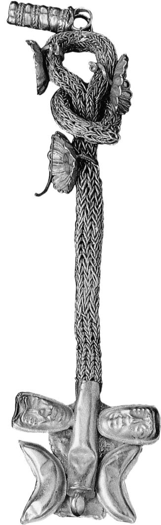
Рис. 1. Золотая подвеска из клада из Эворы.

Среди памятников ювелирного искусства Финикии есть золотая подвеска VII в. до н.э. (грануляция, филигрань) из клада из Эворы (рис. 1) 2 . Поскольку её детали выполнены реалистически, понятно, что мастер хотел изобразить. В частности, совершенно ясно видны две луны в такой же композиционно-знаковой увязке, как и на звеньях ожерелий. Они сделаны объёмными серпами – примерно как выглядит Луна 4–5–6 дня. Общее впечатление дополняют конструктивно и силуэтно: центральная ось, припаянная к ней