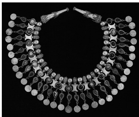
Рис. 5. Бактрийское ожерелье.