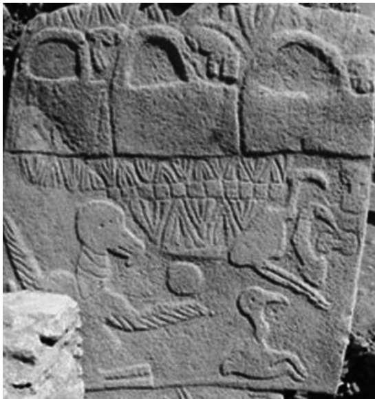
Рис. 9. Рельеф на каменной стеле святилища Гёбекли-тепе.

Орнамент, казалось бы, не выявляет чёткой эволюции. В комплексах храмового типа и на саркофаге, как модели храма, он предстает уже в готовом виде, служит обрамлением изобразительных плоскостей с рельефами, и почти таким же переносится в торевтику. Не дополняет знания о нём и цветовая раскраска. Однако, в плане очень отдалённого экскурса, просматривается, что его структурно-ритмические особенности, по всей вероятности, восходят к храмово-архитектурным истокам – частям плетеных сооружений.