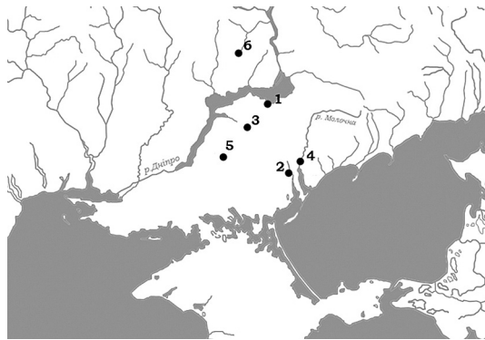
Рис. 2. Карта розташування курганів з дрібними пластинками із зображеннями членистоногих: 1 – Гайманова Могила; 2 – Володимирівка курган; 3 – Вишнева Могила поховання; 4 – Мелітопольський курган; 5 – Огуз; 6 – Олександрополь.

Типи було виділено на основі зображення, форми пластинок, а також їх виконання. Сюжет протистояння двох істот походить з трьох курганів, що