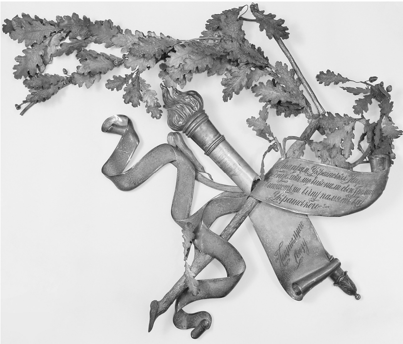
Рис. 1. Меморіальний вінок з Музею історичних коштовностей України. Інв. № ДМ – 6679.

У Музеї історичних коштовностей України (МІКУ), який функціонує з 1968 р. як філія Державного історичного музею УРСР (нині Національний музей історії України), зберігається унікальний експонат. Разом з іншими предметами із дорогоцінних металів він був переданий в МІКУ з фондів історичного музею. Основою новоствореного музею стала колекція, сформована ще в першій чверті ХХ ст. відомими вченими М. Біляшівським, В. Хвойкою, Д. Щербаківським, які стояли біля витоків музейної справи в Україні. Ймовірно, саме до неї належав і досліджуваний предмет – срібний вінок вагою близько шести з половиною кілограмів.