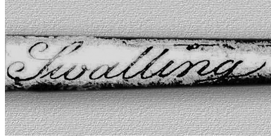
Рис. 6. Клеймо.

На обусі, під руків'ям – гравіроване слово “Svalling”, яке, хоч і не є зброярським клеймом у його “класичному розумінні”, проте на нашу думку, означає прізвище майстра – виробника клинка або й шпаги в цілому (рис. 6). Нам пощас-