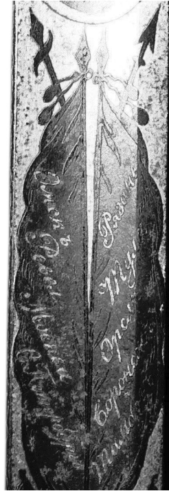
Рис. 4. Один з написів.

Гарда складається з дводольної овальної чашки і поперечної хрестовини, що плавно переходить у бічну дужку, з'єднану з голівкою.