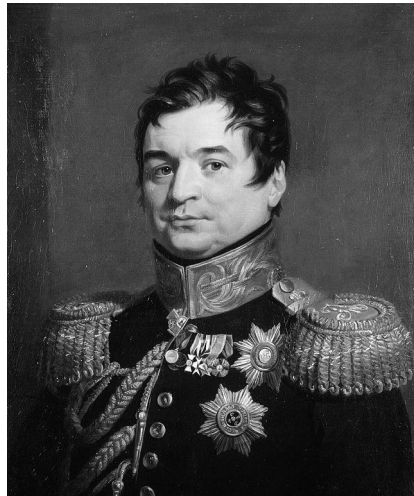
Рис. 1. О.Д. Балашов.

У 1800 р. О.Д. Балашов повернувся на службу як військовий губернатор Реве-