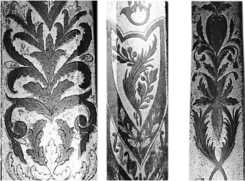
Рис. 3. Фрагменти декору.

Декор шпаги виконано в “ампірному” стилі чорнінням, гравіруванням та позолотою. Крім російськомовних написів, зображення герба та вензеля, на клинку розміщено лаврові та пальмові гілки, дубове віття, стилізовані рослинні орнаменти та композиції з предметів озброєння: перехрещені гарматні лафети, списи з вимпелами, барабан, шабля, шпага (рис. 3).