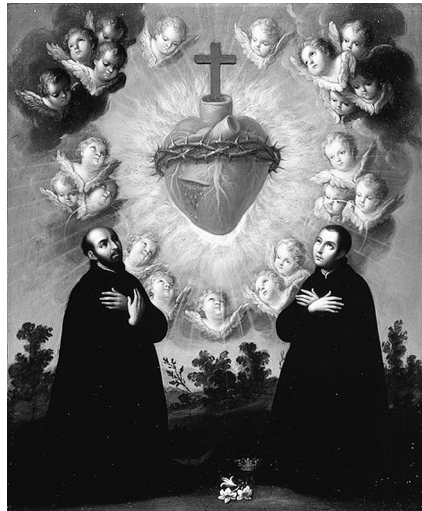
Рис. 7. Алегорія Святого Серця. XVIII ст .

Саме єзуїти з XVII ст. популяризують зображення Святого Серця. Особливо поширеними були зображення алегорії Святого Серця в оточенні ченців-подвижників (рис. 7). У всьому католицькому світі масово розповсюджуються медальйони із зображеннями Святого Серця.