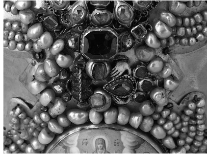
Рис. 1. Митра ДМ-5967. Деталь.

Оздоба митри – живописні емалі, коштовні камені – вражають різноманіттям, але особливу увагу своїм незвичним виглядом привертають декоративні елементи, що увінчують фініфтевий медальйон із зображенням преподобних Антонія та Феодосія Печерських (рис. 1). За описом 1778 р., “над фініфтью “Осенение св. Духа Богоматери с преподобними