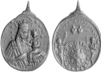
Рис. 8. Релігійний медальйон “Святе Серце”. XVIII ст.

ангелів, які тримають щит із зображенням Христа святого Бенедикта та над ним двох сердець і слів S. C. CORDA IESV ET MAR (Священні Серця Ісуса і Марії) (рис. 8). На іншому медальйоні бачимо зображення двох сердець поряд. Серце Ісуса оповите терновим вінцем, Серце Богородиці – трояндовим вінком 13 .