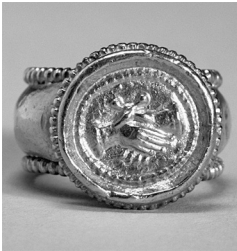
Рис. 2. Римський шлюбний перстень.V ст.

згадуються, зокрема, привіски до намісної Богородичної ікони – різноманітні ланцюжки та персні з коштовним камінням. Інколи подібні дари – сережки, персні, надходили від осіб, які побажали залишитись анонімними 4 . Можливо, серед таких внесків міг бути і так званий перстень-феде. Ці персні походять від римських шлюбних перснів із зображенням рукостискання (рис. 2). У середньовічній Європі як запорука кохання поширеними були кільця, шинка яких замикалась зображенням рукостискання (інколи кисті рук утворювали каст, в який вставляли камінь у формі серця), або кільця, що складалися з кількох поєднаних шинок, на двох з яких були зображення руки, на центральній – зображення серця. Поєднуючись, ці частини утворювали перстень із зображенням рук, що тримають серце, як, наприклад, німецький перстень 1575 р. з колекції Музею Вікторії та Альберта (М.224–1975) (рис. 3) 5 .