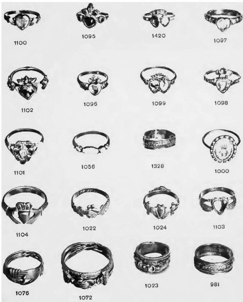
Рис. 4. Персні-федє з колекції Британського музею

Можна припустити, що емалеві серця на митрі – теж деталь персня, подібного до перснів з колекції Британського музею (№ 1099, 1420 в каталозі, рис. 4) 8 , однак дужка, що їх поєднує, хоч і схожа на елемент корони, проте могла використовуватись і як вушко підвіски. Зокрема, така деталь, як два серця, поєднані лавровим вінком, символом торжества