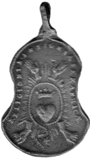
Рис. 6. Релігійний медальйон "П'ять Ран Христових". ХVІІІ ст.

У католицьких країнах середньовічної Європи набув поширення культ П'яти Христових Ран і увінчаної терням Глави Христової. В рамках цього культу виникали Братства Поклоніння Святим Дарам, а на їхній основі – Братства П'яти Ран Ісуса, що об'єднували чоловіків і жінок – шанувальників Милості Божої. Найвідоміше таке братство на теренах Речі Посполитої існувало при монастирі Корпус Крісті в Кракові. До нього вступив і король Ян ІІІ Собеський з дружиною та синами. Внаслідок популярності культу поширились медальйони із символікою П'яти Ран – серце, оточене зображенням кистей рук і стоп (рис. 6) 11 .