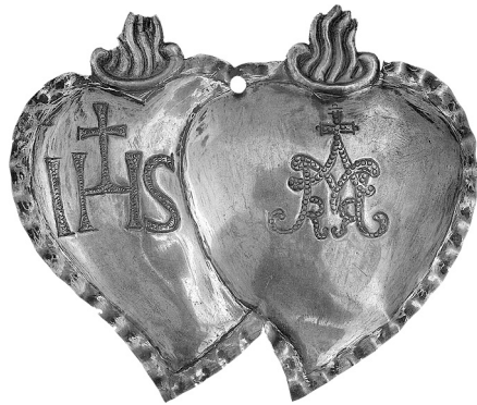
Рис. 9. Підвіска-вотум. Музей історичних коштовностей України, ДМ-821.

Культ Святого Серця поєднаний також з пошануванням Непорочного Серця Марії. Образ Святого Серця Ісуса часто супроводжується зображеннями Серця Марії. Інколи зображення двох сердець – Ісуса та Марії поєднуються. Цікавий медальйон XVIII ст. із зображенням на аверсі Богородиці Ченстоховської, а на зворотному боці – двох