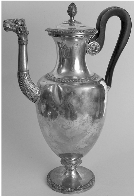
Рис. 2. Кавник. 1809-1819 рр. Париж.

На жаль, не ідентифіковане і клеймо майстра на двох інших предметах, що також виготовлені у Парижі у 1809–1819 р. 15 Щиток цього клейма ромбоподібний, в ньому вежа з прапорцем та латинські літери N A F. Воно поставлене на срібному кавнику (ДМ-4808) з дерев'яною ручкою (рис. 2).