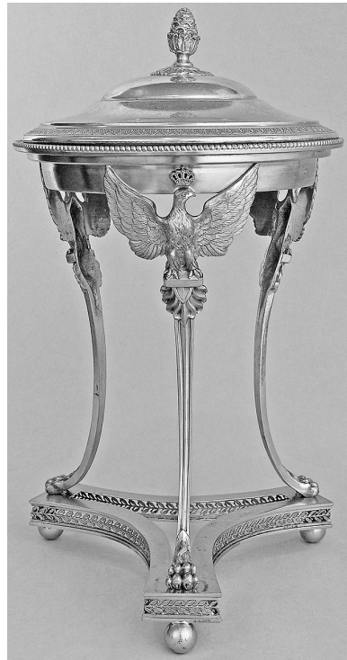
Рис. 7. Ікорниця. Початок XX ст. Париж. Тетар Фрере.

Оправа ємності посудини (скляної або кришталевої) з профільованими вінцями декорована по краю перлинником. Східчаста досить висока кришка оздоблена обідком з пальметок, ручка її має вигляд бутона квітки, “вправленого” в багатопелюсткову розетку. До основи прикріплені три вигнуті профільовані ніжки-штанги, що завершуються лев’ячими лапами.