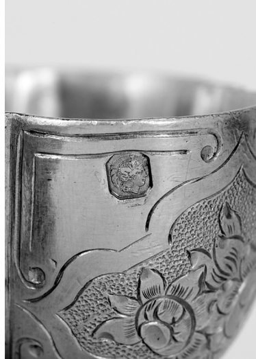
Рис. 6. Клеймо на сільничці.

до якої як до основи за допомогою двох гвинтів приєднана фігурна ручка. Ручка є складною, досить оригінальною конструкцією, в основі якої широкі стрічки із завитками (своєрідні штанги), листочки на вигнутих коротких стеблах, рифлені фігурні пластини, фігурки фантастичних тварин зі зміїним тілом, прикрашеним перлинником та звіриними головами з відкритою пащею. На предметі є два клейма: державне пробірне клеймо для 950 проби срібла (поставлене на кожній ємності): голова Мінерви праворуч з цифрою 1 (рис. 6) 18 ; клеймо майстра у ромбоподібному щитку зі зворотного боку на деталі між ємностями, в якому читається лише одна латинська літера G.