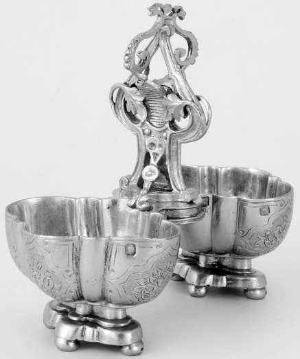
Рис. 5. Сільничка. Друга половина XIX ст. Париж.