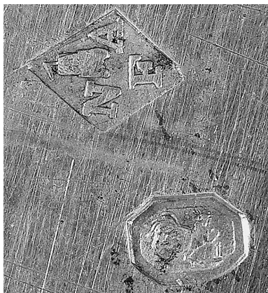
Рис. 3. Клейма на чаші для бульйону.

Корпус його яйцеподібний, горло – циліндричне, розширене вгорі та внизу, з профільованими вінцями, з обідком псевдозерні під ними. Місце з'єднання горла з корпусом декороване паском з густих ов. Кришка округла, приєднана до горла за допомогою шарніру, по краю прикрашена декоративним геометричним обідком. Посередні кришки – розетка, в центрі якої – фініал – ручка у формі шишки пінії. S-подібний носик складається з двох частин: нижня декорована рельєфним листям різної величини, видовженою пальметкою; нижня – гладенька, відділена від верхньої рельєфним обідком-перехватом. Виливом є стилізована голова барана з отвором посередині та віночком з квітів на лобі. Дерев'яна S-подібна гранчаста ручка приєднана до корпусу у двох місцях. Вгорі вона вправлена в простір між двома срібними, приєднаними до корпусу, розетками; внизу вставлена в конусоподібну втулку, припаяну до корпусу, під якою – маскарон. Ніжка невисока у формі балясини з нависаючим краєм вгорі, що нагадує шляпку гриба, та рифленим обідком в нижній частині (у місці переходу у піддон). Піддон округлий з загнутим донизу краєм, ближче до якого декорований обідком з густо поставлених ов (ідентичний прикрашає корпус вгорі). Предмет виконано у стилі ампір. Кавник має численні аналогії серед витворів французьких (і не тільки) майстрів.