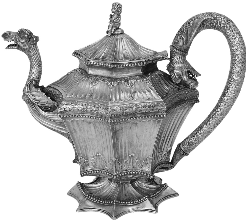
Рис. 1. Чайник. Друга половина XVIII ст.

Нижня частина носика – восьмигранна. До неї приєднані окремо виготовлені крила дракона. Ручка чайника – також S-подібна у вигляді тіла змії, покритого лускою. Вгорі завершується головою фантастичною тварини (дракона) з гривою та крилами (окремо виготовлені і припаяні), знизу – риб'ячим хвостом. Клейма (три) поставлені по краю піддону: клеймо – латинська літера L з короною над нею у прямокутному щитку, клеймо майстра ромбоподібної форми (збите), в якому читаються літери I C (G?), клеймо у вигляді довгоносика у прямокутнику. Останнє поставлене ще й на шийці чайника та на загнутому краї кришки. Клеймо у вигляді довгоносика у прямокутнику використовували на срібних виробках, ввезених до Франції, з 1893 до 1984 р. 12 . У даному випадку це клеймо, вірогідно, свідчить про те, що чайник знову з'явився на внутрішньому ринку більш ніж через 100 років після дати виготовлення; до колекції Б.І. Ханенка він потрапляє не пізніше 1913 р.