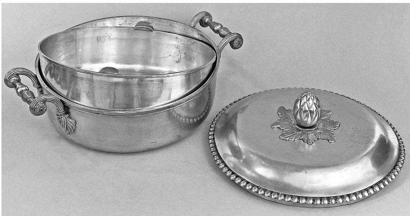
Рис. 4. Чаша для бульйону. 1809-1819 рр. Париж.

герб “Корчак”, такий самий, що й на предметах, згадуваних вище. В середині чаші – ще одна округла посудина з прямими стінками та пластинчастими ручками у формі півкіл.