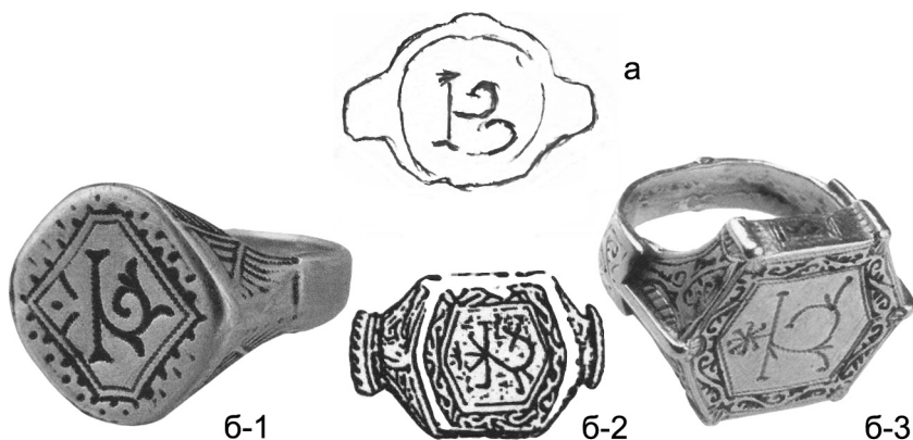
Рис. 2. а – геральдична емблема, гравірована золотом на щитку срібного персня зі скарбу 1910 року (графічна прорисовка автора); б – золоті персні з близькими за композицією знаками з Києва: 1 – Присутні місця, 1854 (МКУ, інв. ДМ 6478); 2 – садиба Раковського, 1889; 3 – Київ (ГРМ, інв. БК 3677).

Пара срібних колтів в техніці контурної черні по гравіруванню, з ажурним обрамленням, що являє собою мініатюрні арки з філіграні, які оточує круглий в розрізі дріт, із щільно нарізаними жолобками (дужки збереглася окремо).