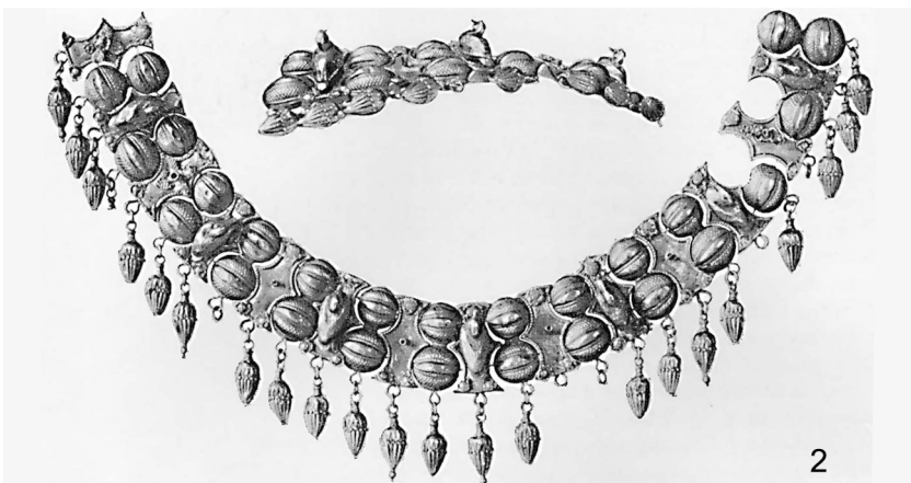
Рис. 2. Ланцюжки з курганів Скіфії: