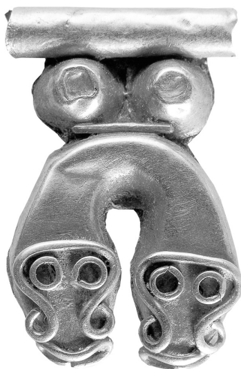
Рис. 9. Підвіска з кургану № 13 поблизу с. Мар'івка (Запорізька обл.).

Отже, ланцюжки з окремих елементів носили тільки жінки. Власниці таких оздоб мешкали в усіх регіонах Скіфії, але кількість знахідок у степових областях переважає. Конкретний зміст зображень можна “прочитати”, проаналізувавши поховальний обряд, склад декоративних елементів костюма, і загалом –