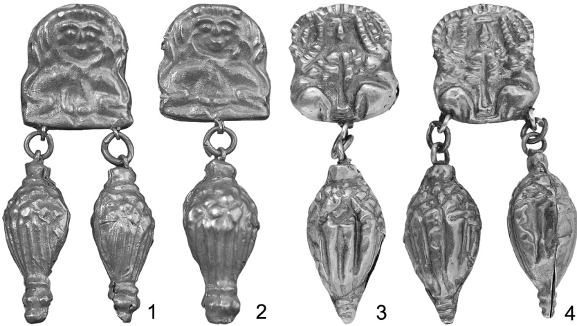
Рис. 4. Ланки від ланцюжків із зображеннями “здвоеного сфінкса”:

Окремі ланки із зображеннями так званого “здвоеного сфінкса” – тобто його тулуб подано у дзеркальній симетрії відносно голови, зафіксовано в похованнях жінок, які не належали до представниць вищої аристократії, хоча мали ознаки певного виділення у своєму соціумі. Увагу привертають прикраси з кургану № 3 (пох. 2) поблизу с. Ізобільне (Дніпропетровської обл.). Елементи ланцюжка зроблені за схемою: овальна коробчата ланка (розміри: 45×18 мм; 50×17 мм) з рельєфним візерунком на верхній пластині, оформлена знизу однією або двома підвісками (рис. 4, 1–2). Зображення сфінкса відрізняється від описаного образу, представленого на ланцюжку з Верхньорогачинського кургану.