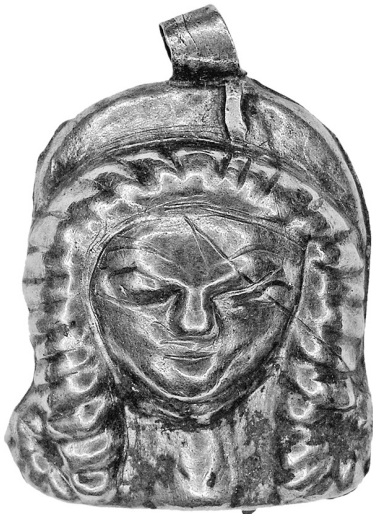
Рис. 8. Підвіски з кургану № 31 поблизу с. Софіївка (Херсонська обл.).

Для створення нашийних прикрас використовували також підвіски: фігурні об'ємні ланки, такі ж, як й описані вище, але з петелькою у верхній частині виробу. Більшість ланцюжків, створених з ланок цього виду, знайдено у жіночих похованнях в Степовій Скіфії. Слід відмітити різноманітність форм, своєрідність декору, варіанти поєднань з намистом. Зупинимось на деяких доволі рідкісних оздобах, які були складовими ланцюжків.