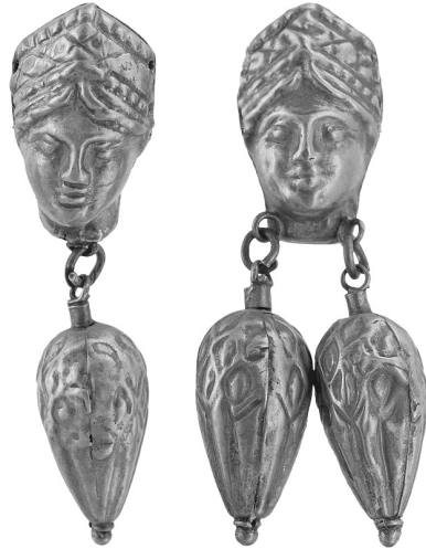
Рис. 7. Деталі ланцюжка з кургану № 4 поблизу с. Новосілки (Черкаська обл.).

Костюм жінки, похованої у Новоселицькому кургані, привертає увагу багатьма ознаками приналежності небіжчиці до соціальної верхівки: прикраси головних уборів та одягу: золота стрічка – метопада для оформлення налобної пов'язки, пластинки-аплікації для оздоблення конічної шапочки та сукні. Основні мотиви, вміщені на аплікаціях: голова лося (на метопаді), сфінкс з подвійним тулубом, рослинні візерунки. Особливе місце належало знімним прикрасам. Комплект містить усі категорії ювелірних виробів, тобто оздоби, призначені для голови, шийно-нагрудні,