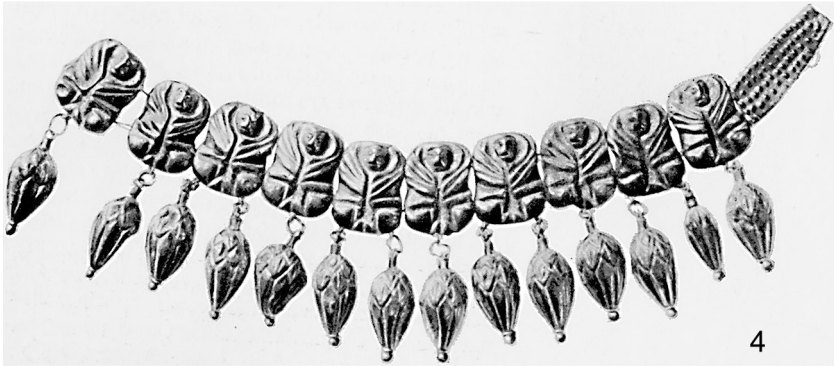
Рис. 2 (прод.). Ланцюжки з курганів Скіфії: