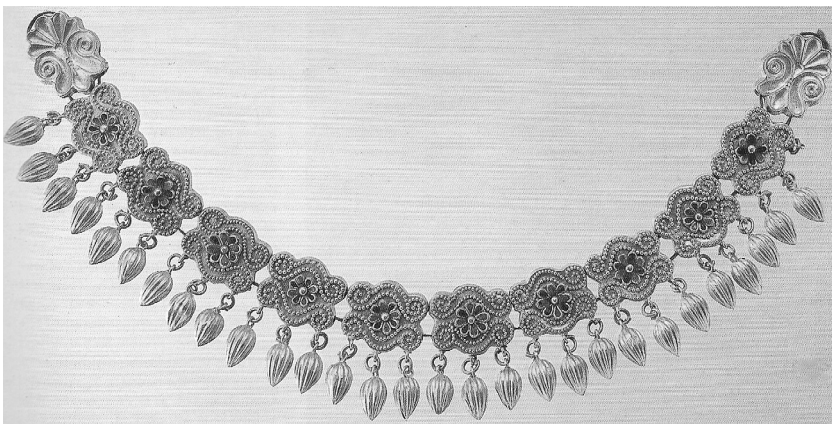
Рис. 1. Ланцюжок з кургану № 17 з Німфейського некрополя.