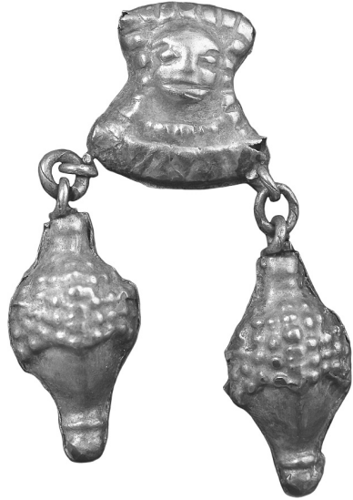
Рис. 6. Коробчаста ланка із зображенням жіночої голівки (курган № 2, пох. 2) поблизу с. Чкалове (Дніпропетровська обл.).

Звернемо увагу ще на один тип фігурних елементів. Йдеться про знахідки серед декоративних фрагментів костюма скіф’янки, поховання якої дослідили в кургані № 8 (пох. № 2) поблизу с. Волчанське Акімовського р-ну Запорізької обл. 26 Невеличкі коробчасті ланки вирізані за контуром зображення голови людини (15 екземплярів, розміри: 16×14 мм). На передній пластинці показано обличчя з невиразними рисами, облямоване (від скроні до скроні) вузьким рельєфним пружком, який імітує волосся, розділене пасмами. Шия персонажа коротка, ледь намічена. Можливо, давній художник передав образ чоловіка.