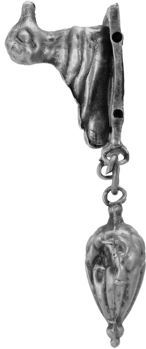
Рис. 3. Коробчаста ланка – елемент ланцюжка (к. 4, п. 1 поблизу с. Архангельська Слобода (Херсонська обл.).

З числа знахідок ланцюжків можна виокремити групу прикрас, на ланках яких вміщено міфічні образи. Найбільш поширеними є зображення сфінкса. Наприклад, оздоба, що походить з Ольвії. Ланцюжок складається з прямокутних пластинок, на яких з тоненьких дротинок створені візерунки (техніка скані). На вузеньких ланках (14×24 мм) – сфінкс у профільному ракурсі, а на ширших (24×24 мм) – розетки із загостреними пелюстками. Знизу до цих елементів нашийної оздоби припаяно по 2–3 петлі, до яких за допомогою дротяних кілець прикріплено амфороподібні підвіски. До крайніх ланок ланцюжка приєднано фігурні пластинки, на яких бачимо контури пальметки та спіралеподібні завитки (рис. 2,3). Загальна дов-