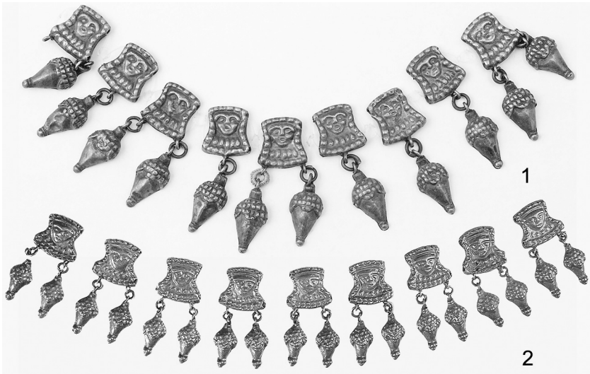
Рис. 5. Трапецієподібні коробчасті ланки з антропоморфним образом: 1 – ланцюжок з кургану поблизу с. Лазурці (Черкаська обл.); 2 – знахідка в кургані поблизу с. Софієвка (Херсонська обл.).

Абрис лицьової пластинки підкреслено мініатюрними опуклими прямокутниками. У цій же техніці в площину ланки вписано узагальнений антропоморфний образ. Перед нами маска: вузьким пружком окреслено контури обличчя з широкими вилицями, однією рельєфною лінією змальовані брови і ніс, окремо – невеличкий рот. Паралельно нижньому краю трапеції нанесено ряд невеличких опуклин, які, ймовірно, імітують разок намиста на ледь наміченій шиї. Отже, художник передав “портрет” жінки: форма пластини дозволила показати жіночу голівку у калафі – обриси головного убору вимальовує облямівка на верхній стороні трапеції, а квадратики на обабіч нагадують прикраси покривала. Архетипом зображення, ймовірно, є “портрети”, виконані у геометричному стилі, характерному для мистецтва Пелопонесу в VII – VI ст. до н.е. Схоже трактовано обличчя “Володарки звірів” на уже згаданих деталях ланцюжка з Родоса 25 .