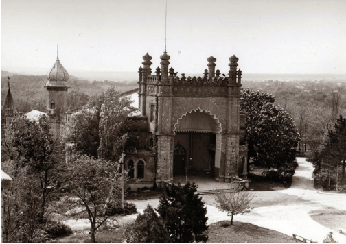
Рис. 6. Палац Курисів. Фото 50-х рр. ХХ ст.

тором Миколою Константиновичем Толвинським, молодим академіком Санкт-Петербурзької академії наук, нащадками Івана Онуфрійовича. Ця частина палацу збудована в мавританському стилі (рис. 6). На головному фасаді палацу можна бачити й герб Курисів, увінчаний рицарським шоломом зі страусовим пір'ям. На гербовому щитку зображено лева, квітку лілії, внизу на стрічці — гасло “ДА БУДЕТ ПРАВДА” (рис. 7). За життя Івана Онуфрійовича була побудована у 1824 р і церква покрови Пресвятої Богородиці, в огороженні якої він і був похований у 1836 р.