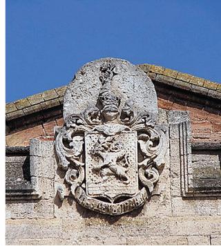
Рис. 7. Герб роду Курисів.