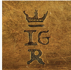
Рис. 5. Клеймо.

Клеймо, на жаль, не ідентифіковане, але за стилістичними особливостями, ймовірно, є французьким. Жодних інших клейм на табакерці немає. Це трохи дивно, адже Франція має найстарішу в Європі пробірну систему, що сягає ще глибини середньовіччя. Система клеймування в королівській Франції була дуже складною, що призводило до того, що на предметах знаходилось кілька клейм (наприклад, на старих витворах їх може бути п'ять), а інколи і більше. Форми цих клейм бували дуже різними, але дуже часто вони мали вигляд літер з незвичайним оздобленням з розміщеною вгорі короною. Таке саме клеймо є на табакерці.