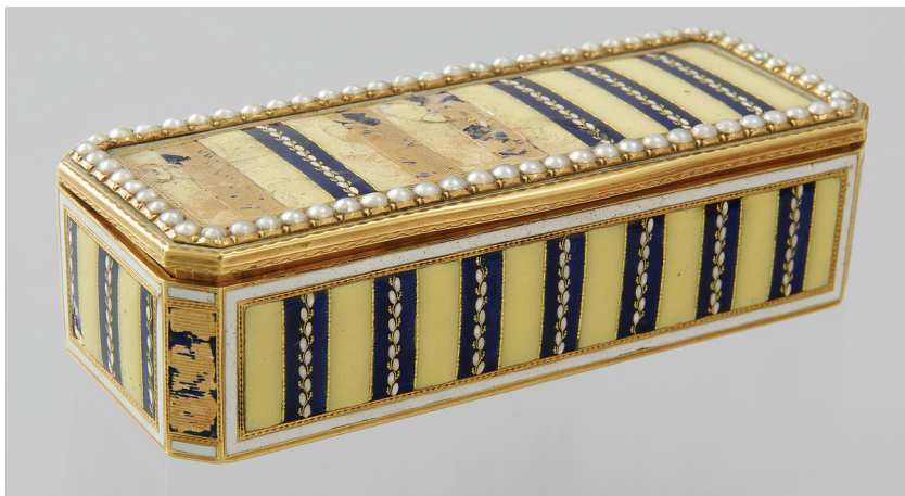
Рис. 1. Золота табакерка Загальний вигляд.

В експозиції МІКУ з дня його заснування зберігається золота табакерка (ДМ-1633) (рис. 1). Відомо, що вона до 1934 р. знаходилася в Музеї мистецтв (тепер Національний музей мистецтв ім. Богдана і Варвари Ханенків), про що є запис в інвентарній книзі за № 3244. 27 березня 1934 р. за актом № 2 (з грифом “секретно”) табакерка разом з іншими речами була передана на зберігання до Київської обласної контори Держбанку, а звідти, вірогідно, десь наприкінці червня 1941 р (з початком Вітчизняної війни) була вивезена до Держсховища СРСР в Москві. Вже звідти (звісно, разом з іншими численними матеріальними цінностями) була евакуйована в Уфу. У 1946 р. табакерка повернулася в Україну, але вже в Державний республіканський історичний музей, звідки у 1964 р. (тоді музей уже називався Київський державний історичний музей) була передана МІКУ.