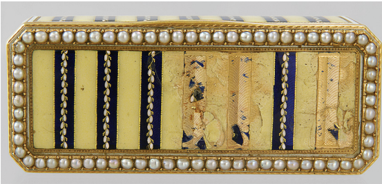
Рис. 4. Кришка табакерки, прикрашена перлинами.

Стрічки утворені такими деталями: між трьома кульками (обабіч більшої, менші за розміром) невеличка стрічка з заокругленими кінцями. Смужки синього кольору (емаль на гільшированої у формі “ялинки” поверхні) декоровані рослинним узором, в якому поєднується золото з емаллю. В основі візерунку — хвилястий золотий пагін з дрібними листочками у формі трьох кульок) та овальними емалевими плодами, облямованими тоненькими золотими дротинками. Смужки оточені подвійною рамкою: золотою і емалевою кольору слонової кістки. Такий же візерунок прикрашає і кришку предмета, приєднану до корпусу з допомогою шарніру. Але насамперед окрасою кришки є розташований по периметру бордюр з густо розміщених дрібних перлинок у глухих кастах (рис. 4). Є на предметі і клеймо майстра. Воно поставлене двічі (на кришці і на дні). Це латинські літери “I G R”, розташовані у два ряди під стилізованою тризубцевою короною (рис. 5).