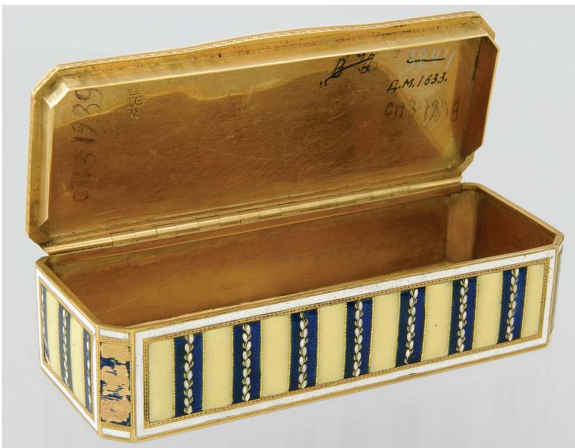
Рис. 3. Золота табакерка у відкритому вигляді.

Табакерка виконана з золота і прикрашена емаллю. Вона восьмигранна, з кришкою на шарнірі. Розміри: 90×36×25 мм. Всі її грані декоровані емалевими смужками (синіми та жовтими), що представлені по черзі та розділені золотими стрічками (рис. 3).