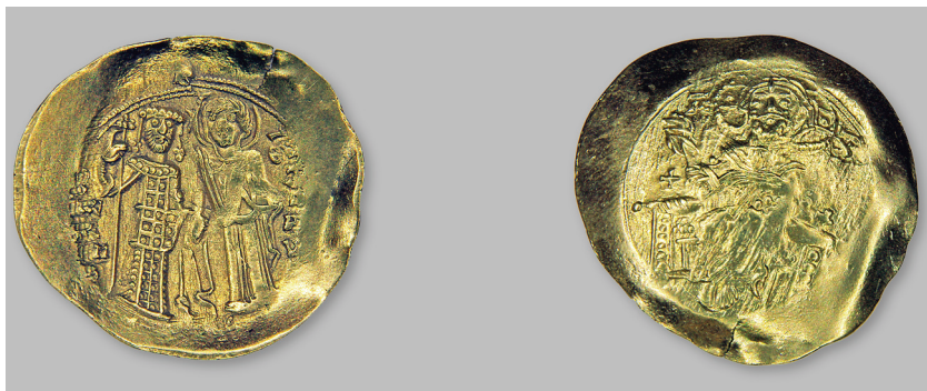
Рис. 7. Солид Иоанна II Комнина из курганного могильника у с. Сивашское Херсонской обл. (курган 5, погр. № 3).

В 1984 г. Херсонской археологической экспедицией проводились раскопки курганного могильника эпохи бронзы у с. Сивашское Новотроицкого района Херсонской области. Интересующий нас курган 5, высотой 1,2 м, диаметром 30 м, был исследован отрядом под руководством А. В. Симоненко. При раскопках, в яме с подбоем, археологи обнаружили впускное погребение № 3 воина-кочевника, по всей вероятности половца, вместе с конем. Сопровождающий погребальный инвентарь состоял из обломков железного шлема, фрагментов кольчуги, сабли и кинжала. Вдоль сохранившихся in situ костей левого бедра воина лежали костяные обкладки колчана с железными наконечниками стрел и деревянными черенками. Рядом находились кожаные остатки конской сбруи. В заполнении подбоя был найден наш золотой солид (рис. 7).