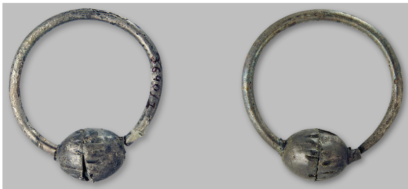
Рис. 5. Серебряные серьги-подвески из курганного могильника у с. Степовое Николаевской области (курган 1, погр. № 15).

из серебра и позолочена с припаянным серебряным ушком для подвешивания (рис. 4). Найдена в составе погребального инвентаря в 1908 г. в Киеве при раскопках Д.В. Милевым фундаментов Десятинной церкви, в погребении № 122 (хранится в Харьковском историческом музее) 8 .