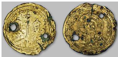
Рис. 1. Субератная монета Василия II и Константина VIII из курганного могильника у с. Степовое Николаевской обл. (курган 1, погр. № 15).

Наиболее ранней является субератная монета — подражание византийскому солиду Василия II и Константина VIII (976–1025 гг.) (рис. 1). Субератная монета — (от лат. Subaeratus — имеющий внутри металл: железо, медь, бронзу) — понятие, возникшее еще в античности как обозначение монет, главным образом, римских серебряных динариев, чеканенных из недрагоценного металла и покрытых с обеих сторон тонким слоем серебра. Субератные имитации изготавливались иногда официально, но главным образом в незаконных мастерских фальшивомонетчиков. Субератные монеты, имеющие дырочки, использовались вместе с подлинными, как в денежном обращении, так и в виде драгоценных нашивок на одежду или подвесок к конской упряжи. Известны хазарские подражания византийским монетам VII — VIII вв., а также найденная на Северном Кавказе имитация золотого гистамеона Михаила VII Дуки (1071–1078 гг.).