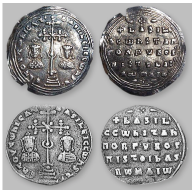
Рис. 2. Серебряные милиарисии Василия II и Константина VIII.

милиарисия — парное погрудное рельефное изображение византийских императоров: слева — Василий с короткой бородой, в лоре, справа — его брат-соправитель Константин, безбородый, одетый в хламиду и плащ, закрепленный на правом