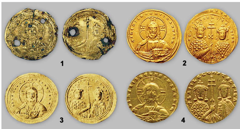
Рис. 6. 1 — субератная монета Василия II и Константина VIII; 2–4 — оригиналы солидов Василия II и Константина VIII.

диновой. В кургане 1, диаметром 52 м высотой 2,4 м, во впускном погребении кочевника-печенега № 15 были обнаружены кости юноши лет 12 вместе с конским скелетом. По бокам черепа лежали две парные серебряные серьги в виде кольца из тонкой круглой в сечении проволоки с пустотелой бусиной, состоящей из двух спаянных половинок полусферической формы. Данные серьги представлены в соответствующем разделе экспозиции МИДУ (рис. 5). Ниже черепа, на уровне шейных позвонков, находилось ожерелье из трех стеклянных биконических бусин зеленого цвета и медная круглая подвеска — бубенчик с ушком. Костяной двухсторонний гребень с железным кинжалом и шилом лежали возле костей левого бедра. Под черепом, среди кусочков ткани, была найдена субератная монета с двумя грубо пробитыми отверстиями. Она чеканена в виде медной монеты, 25 мм в диаметре, с обеих сторон покрытой позолотой способом амальгамы.