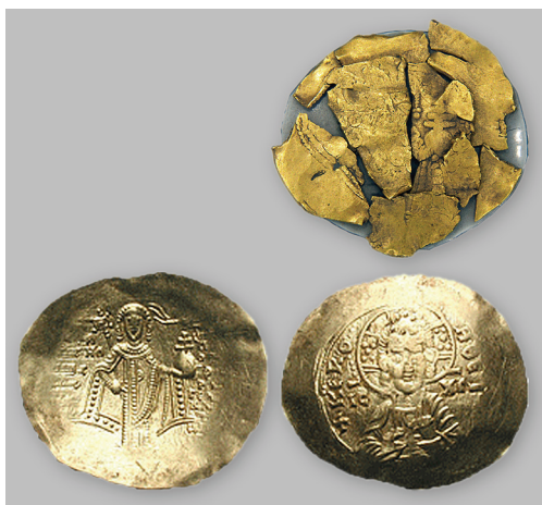
Рис. 8. 1 — фрагментированный солид Мануила I Комнина из курганного могильника у с. Малая Терновка Запорожской обл. (курган 11, погр. № 1); 2 — солид Мануила I Комнина.

В 1981 г. Херсонской археологической экспедицией под руководством А.И. Кубышева проводились раскопки скифского курганного могильника у с. Малая Терновка Акимовского района Запорожской области. В кургане 11 высотой 1,2 м и диаметром 25 м во впускном погребении № 1, почти полностью разграбленном, которое находилось в центре кургана, были обнаружены разбросанные кости чело- века — половецкого