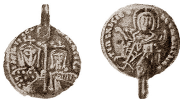
Рис. 4. Субератная монета Василия II и Константина VIII, обнаруженная при раскопках Десятинной церкви в Киеве (погр. № 122).

народной валюты в крупных торговых сделках выполнял золотой безант. Об этом свидетельствуют нумизматические находки, сосредоточенные по основному торговому пути, связывавшему Византийскую империю с кочевниками Северного Причерноморья и Киевской Русью — по Южному Бугу, Нижнему и Среднему Днепру и его основным притокам.