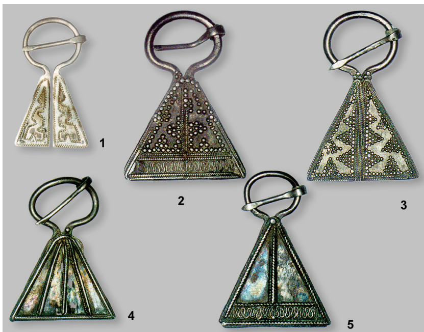
Рис. 3. Серебряные сьюльгамы Василицкого клада, выполненные булгарами (начало XIII в.).