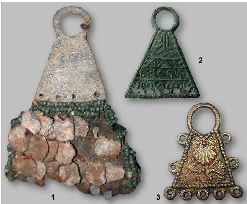
Рис. 6. 1, 2 — Чувашские сьюльгамы (Мартыновский могильник, XVII в.); 3 — чувашская сьюльгама (XVIII–XIX в.).

На сьюльгаме (рис. 6: 2) в верхней части изображен родовой знак (ана паллы), производный от знака “булгар” и пока корректно не дешифрованная руническая надпись.