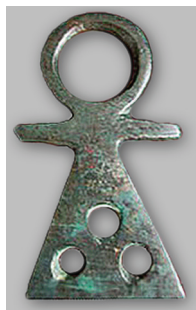
Рис. 10. Знак Танит (II в. до н.э. — II в. н.э.).

Ама (самка, женское начало) это название женского нагрудного украшения, частью которого была эта сьюльгама. Кстати, это название может сближать данный знак с символом праматери всех божественных сущностей Танит (рис. 10) 21 . Отметим даже сходные приемы орнаментирования, состоящие из трех окружностей на щитке 22 . Другое название — џестенкё , по мнению Н.И. Ашмарина, происходит от русского слова “жесть” 23 . Правда в этом случае не учитывается тот факт, что русское слово “жесть” само происходит от тюркского “жез”, “жиз” означющего “белая медь”, “латунь”. В таком случае “ џе(тенке) ” (латунная, мельхиоровая денгга (тенкё)) это собственное, чувашское название предмета, угаивающее его сакральный смысл.