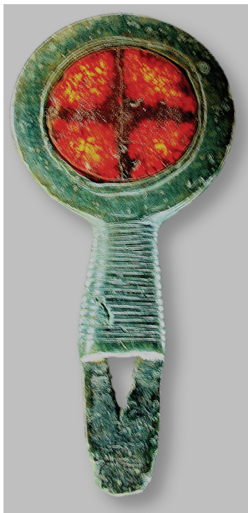
Рис. 8. Ритуальный жезл из Felsbilder (Швеция), около XVII вв. до н.э.

Чувашская скульгама носит ярко выраженный культовый характер и является одним из видов изображения символа веры в единое божественное начало “Тура”. В чувашском языке эту скульгаму называют турпаллы (знак бога (Тура)). Второе название, вероятно связано с попыткой скрыть истинное значение знака от наделенных политической властью миссионеров. В период насильственного крещения и запрета на металлообработку чуваша продолжали под угрозой казни с удивительным упорством носить этот знак.