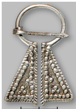
Рис. 2. Булгарская серебряная сьюльгама (Поволжье, начало XIII в.).

Найденные на Украине сьюльгамы относятся к XIII–XIV вв., и их происхождение связано с серебряными булгарами (рис. 3) и финно-угорским народом мокшей (рис. 4). Районы проживания этноса мокши в дозолотоордынскую эпоху находились под протекторатом Серебряной (Волжской) Булгарии 7 .