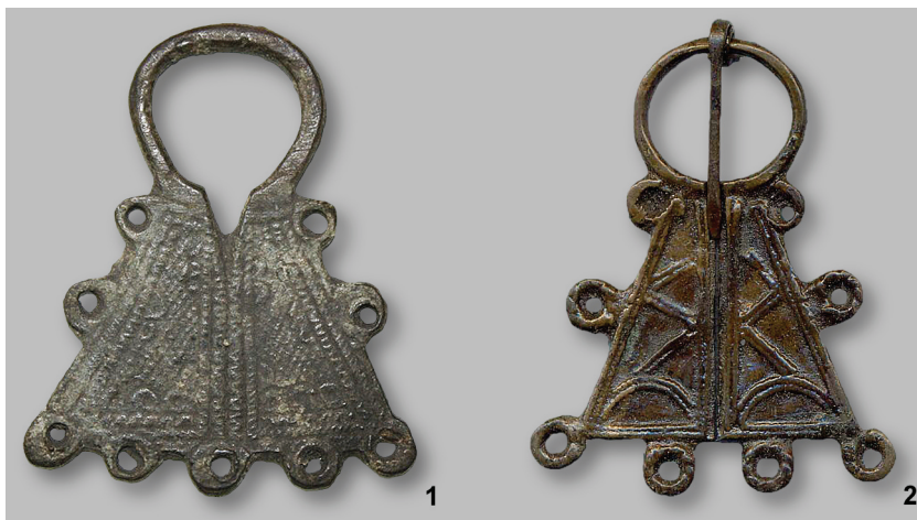
Рис. 7. Мокшанские сьюлгамы (XVIII — XIX в.) (ЧНМ).

булгарами в начале XIII в. в районах проживания мокши. В мокшанской традиции они продолжали существовать и дальше. Так, с XVI по XVIII вв. стали распространяться сьюлгамы со сросшимися лопатками и небольшим рудиментальным вырезом посередине 14 (рис. 7: 1). Этот знак, ставший символом, прочно закрепился и в резьбе по дереву эрзи и мокши, при этом изображался без выреза 15 .