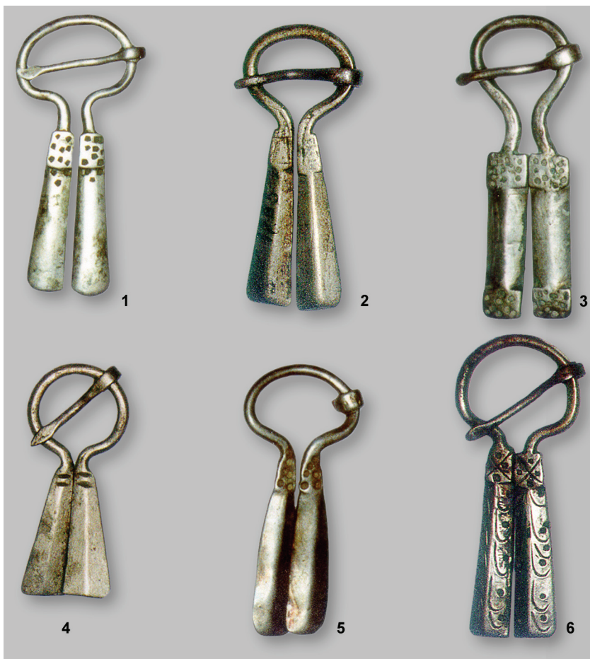
Рис. 4. Мокшанские серебряные сьюльгамы Василицкого клада, (начало XIII в.).

Технологические приемы исполнения части украшений (пайка серебра, зернь) наводят на мысли о работе болгарских мастеров, исполняющие украшения в местных традициях для ближайших народов, такая же ситуация прослеживается и в приуральских районах. Более того, в это время происходит трансформация форм мокшанских сьюльгам и, по-видимому, новое их идейное наполнение.