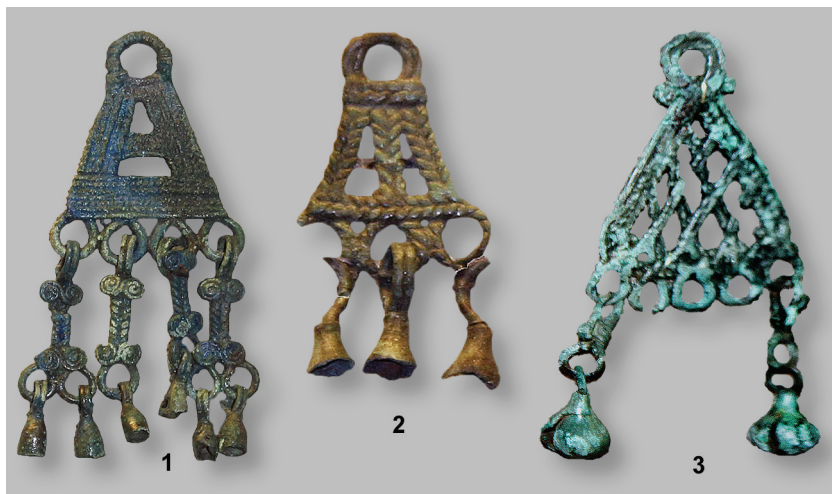
Рис. 5. Височные подвески финно-угорского населения Средней Оки (III–VII вв.) (ГИМ).

височные подвески 8 . Этот комплекс хорошо представлен в экспозиции Государственного исторического музея в витрине “Население средней Оки III–VII вв.” (рис. 5). В дальнейшем эта традиция не имеет своего продолжения.