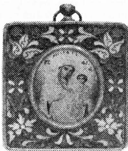
Рис.4. Икона «Богоматерь Иверская» (Российский дом «Геллеос»)