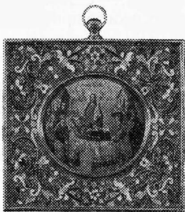
Рис.3. Икона на перламутре «Успение Богородицы» (Музей религии в Санкт-Петербурге)