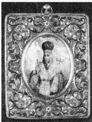
Рис.1. Икона с изображением Иосафа Белгородского из Музея исторических драгоценностей (ДМ -7648).