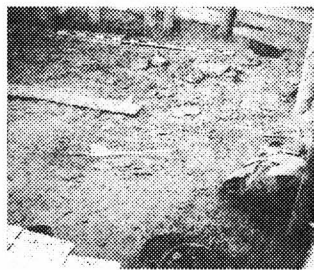
Знахідки в дромосі кургану Товста Могила.