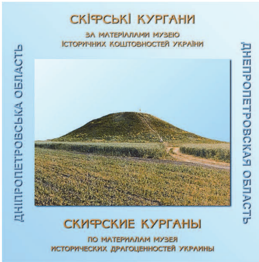
Рис. 3. Диск з електронним каталогом скифських пам'яток Дніпропетровщини.

основі розробленої бази, за допомогою нової програмної розробки — СМС “Смерека” створено спеціальний web-проект. Він включає все інформаційне наповнення бази даних, текст, ілюстрації та логічну схему подачі матеріалу. Система пристосована для представлення в інтернет-мережі, а також для локальної роботи окремого користувача. Сервісні елементи системи управління сайтами “Смерека” дозволяють користувачам продовжувати наповнення та здійснювати переробку в готових проектах.