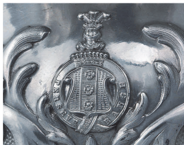
Рис. 3. Герб рода Бенкендорфов.

На каждом предмете сервиза, среди пышного рокайльного узора, выделяется родовой герб (рис. 3), являющийся как декоративным, так и идентифицирующим элементом.