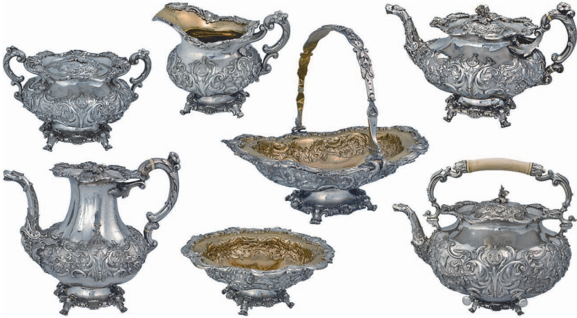
Рис. 1. Сервиз работы Адольфа Шпера.

В 1968 году, согласно указу Министерства культуры УССР, в Музей исторических драгоценностей были переданы раритетные предметы из фондов Киево-Печерского заповедника. Одно из самых выразительных произведений ювелирного искусства в этом списке — чайно-кофейный сервиз, который в настоящее время представлен в постоянной экспозиции “Памятники русского ювелирного искусства в Украине” (рис. 1). Во время изучения этого эксклюзивного произведения 40-х годов XIX века удалось восстановить подлинную историю его происхождения.