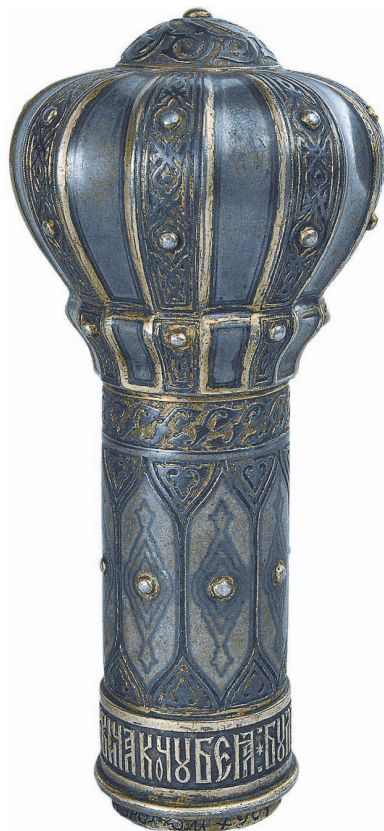
Рис. 5. Булава С.В. Кочубея.

Длительное время в музее существовала версия, что ювелирный комплект Бенкендорфа был вкладом в православный монастырь и таким образом попал в фонды заповедника Киево-Печерской лавры. Но чем дальше мы знакомились с биографией Бенкендорфа, его отношением к вопросам веры, тем большие сомнения вызывала прижившаяся история о сервизе. Граф Бенкендорф был