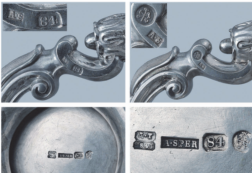
Рис. 2. Клейма на некоторых предметах сервиза.

На Руси издавна использовали серебряную посуду 3 — прочную, красивую, отличающуюся антисептическими свойствами. Первый столовый серебряный сервиз был заказан Петром I. Но серебряная посуда стала особенно популярной у знати лишь во времена правления Екатерины II, хотя до конца XVIII века сервизами пользовались только на праздничных пиршествах.