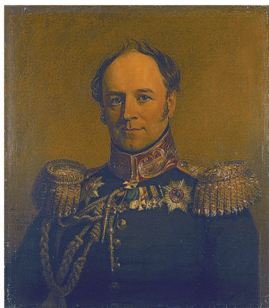
Рис. 4. Портрет А.Х. Бенкендорфа.

Граф Бенкендорф Александр Христофорович 8 (рис. 4) — шеф тайной полиции, преследователь Пушкина, верный друг и слуга царя Николая I.