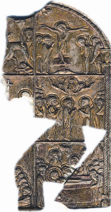
Рис. 3. Євангельський святковий цикл.

У 2002 році в місті Володимира (вул. Велика Житомирська 2) в господарському приміщенні (льосі) знайдено фрагмент стеатитової іконки з зображенням Богоматері та розквітлого хреста на звороті (№ 386). Тут же виявлено кілька предметів культового призначення та скарб золотих жіночих прикрас XII-XIII ст. 4