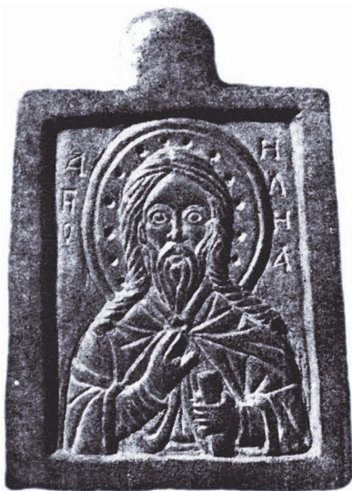
Рис. 5. Ілля Пророк.

Шиферна іконка (№ 359) знайдена під час розкопок В.Я. Якубовського в житловому комплексі городища XII-XIII ст. біля с. Теліженці Старосинявського р-ну Хмельницької області (рис. 6). Т.В.Ніколаєва визначила зображення як унікальне — Богоматір в позі моління перед св. Миколаєм. Очевидно, іконка є відображенням особливого місцевого культу св. Миколая 17 .