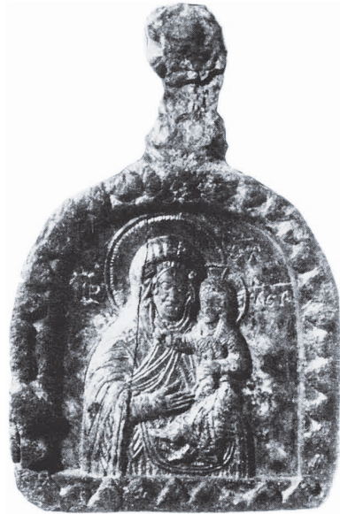
Рис. 8. Богоматір Одигітрія.

З Переяслав-Хмельницького князівства походить одна іконка № 382, знайдена під час дослідження валу XII ст. 27 .