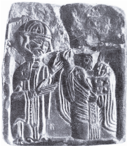
Рис. 6. Богоматір і св. Миколай.

На теренах Волинської землі знайдено три іконки. Під час розвідок на Шумському городищі в 1961 р. П.А. Рапопорт виявив двосторонню іконку із зеленого каменю “Богоматір Одигітрія” — “Богоматір Оранта” (№ 39) 18 . Іконка № 360 з зображенням Христа знайдена в древньому Червні біля підосви валу в шарі першої половини XIII ст. під час розкопок 1977 р.