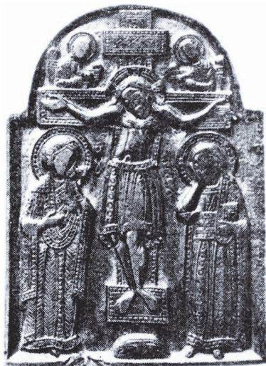
Рис. 4. Розп'яття.

Наприкінці XIX ст. Н.Ф. Біляшівський проводив розкопки на Княжій горі (Канівський р-н Черкаська обл.). Серед великої кількості культових речей і прикрас знайдено було шість добре пророблених високохудожніх іконок. Стеатитова іконка “Завірення апостола Фоми” (№ 16), сланцеві іконки “Захарій (?); архidiaкон Стефан або Лаврентій” (№ 17), “Ангел охоронець” (№ 18), глиняний образ “Георгій Побідоносець” (№ 19). Особливо вирізняється іконка “Розп'яття” (№ 20) кіотчатої форми із темного сланцю (рис. 4). Оскільки городище було майже повністю перекопане місцевими жителями, то Н.Ф. Біляшівський не зміг вказати датування знайдених речей 11 .