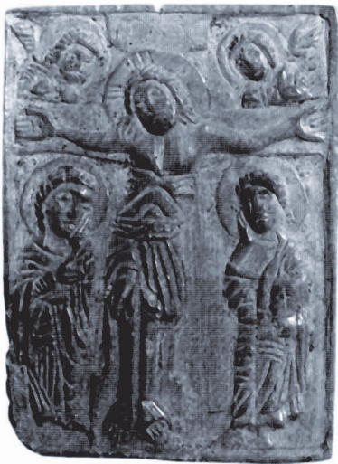
Рис. 7. Розп'яття.

Іконка № 358 шиферна, квадратна, з зображенням Богоматері Одигітрії знайдена під час розкопок на Бузі на Волині. Інформація про точне місце знахідки відсутня.