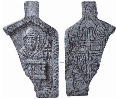
Рис. 2. Симеон Стовпник; процвітший хрест.

Дванадцять іконок знайдено було в Києві наприкінці XIX — на початку XX ст. на території Верхнього міста, а також на Подолі експедиціями, які очолювали І.А. Хойновський та Д.В. Мілеєв. Серед цих іконок виділяється одна, що має розміри 7 \times 4,5 \times 0,4 і вушко для підвішування з зображенням Симеона Стовпника і процвітшого хреста на звороті (рис. 2). Ще дві іконки знайдені