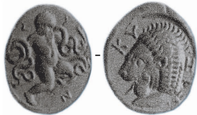
Рис. 7. Монета Кізіка. IV ст. до н.е.

Найбільш ранні зразки походять з Семибратніх курганів. Вони представляють собою обрізані по контуру фігури юнака повернутого ліворуч, який присів на одне коліно. У нього довге волосся, широкі плечі, вузька талія. У руках він ніби тримає якісь маловиразні предмети. На пластинках з Архангельської Слободи більш виділені пасма волосся та м'язи живота. Зачіска коротка, волосся позначено прямими пасмами. Чітко прокреслені м'язи на грудній клітині, животі та ногах. Пластини з зібрання Ханенка Б.І. відрізняються досить схематичним зображенням фігури: ледь намічені прямі пасма волосся та м'язи на руках, ногах, грудній клітині, але завдяки тому, що майстер чітко передав розкриті кисті рук з виділеними фалангами пальців ми бачимо, що в них немає жодних предметів. На противагу попереднім, на пластинках з Куль-Оби чітко видно, що в обох руках Геракл тримає предмети, які своєю формою нагадують яблука.