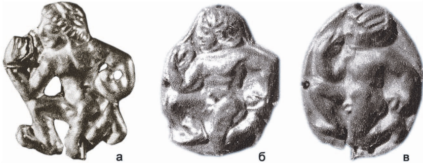
Рис. 6. а – Семибратній курган, пох. № 2. Кубань. V ст. до н.е.; б, в – Курган Куль-Оба поблизу Керчі. IV ст. до н.е.

Аналогічні пластини походять з кургану V ст. до н.е.: пох. № 2 Семибратній Курган (Кубань) 16 (рис. 6 а); IV ст. до н.е. курган Куль-Обі (поблизу Керчі) 17 (рис. 6 б, в).