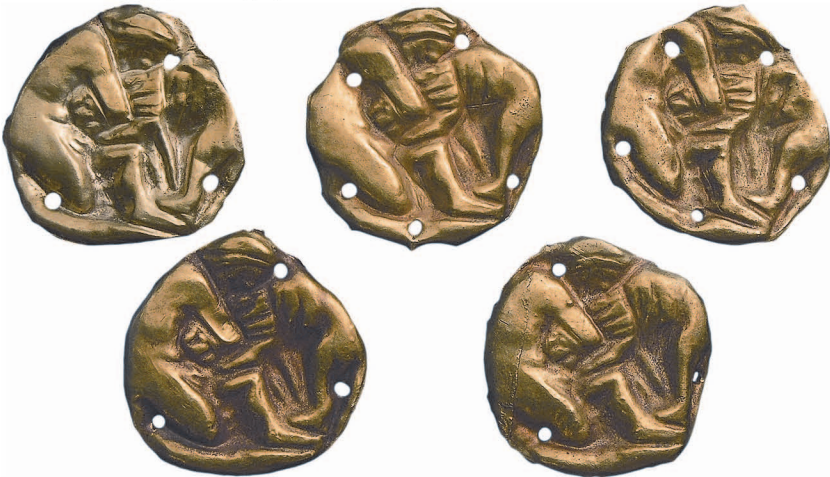
Рис. 1. Курган Драна Кохта з пох. №1 біля ст. Жовтокам'янка Дніпропетровської обл. IV ст. до н.е.

Перший варіант представлений бляшками з кургану Драна Кохта з пох. № 1 біля ст. Жовтокам'янка Дніпропетровської обл. IV ст. до н.е. (рис. 1). У похованні знайдені п'ять пластин-аплікацій круглої форми діаметром 22 мм.