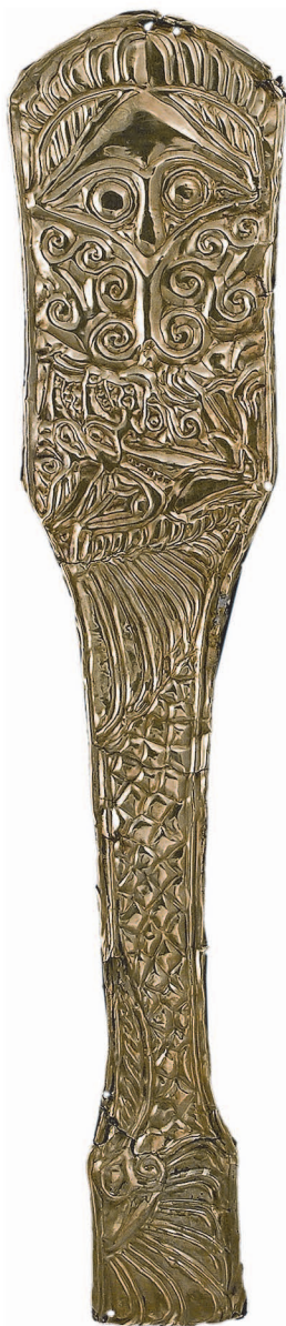
Рис. 4. Курган № 1 поблизу с. Вовківці Сумської обл. V ст. до н.е.

Другий варіант пластин з зображенням Геракла на скіфських прикрасах