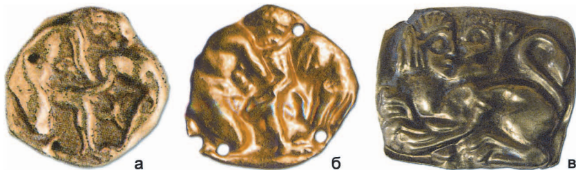
Рис. 2. а – Курган Чортотлик. Дніпропетровська обл. IV ст. до н.е.; б – Курган Куль-Оба поблизу Керчі. IV ст. до н.е.; в – Бердянський курган Запорізька обл. IV ст. до н.е.

Подібні за сюжетом та стилем виконання пластини знайдені у скіфських курганах IV ст. до н.е. 5 : Чортотлик (Дніпропетровська обл.) 6 (рис. 2 а); Чмирева Могила 7 та Шульговка (Новомиколаївка) (Запорізька обл.) 8 ; Верхній Рогачик (Херсонська обл.) 9 ; Куль-Оба (поблизу Керчі) 10 (рис. 2 б).