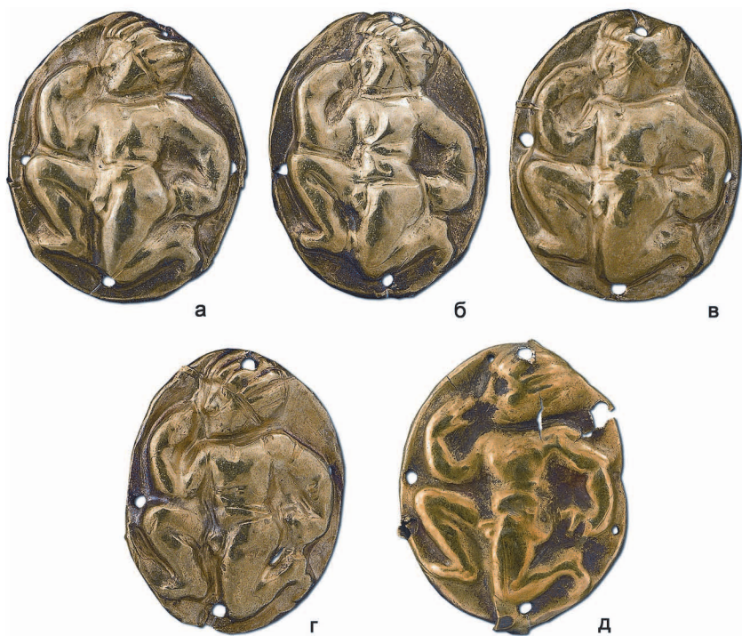
Рис. 5. а – курган № 5 поблизу с. Архангельська Слобода Херсонської обл. V ст. до н.е.; б – зібрання Б.І. Ханенка (Можливо з розкопок на Дніпропетровщині XIX ст.).

представлений на бляшках у кількості шістидесяти п'яти одиниць з кургану № 5 поблизу с. Архангельська Слобода (Херсонська обл.) V ст. до н.е. (рис. 5 а-г) та одному екземплярі (рис. 5 д) із зібрання Б.І. Ханенка (за архівними даними, можливо з розкопок на Дніпропетровщині XIX ст.). Розміри бляшок майже ідентичні, перші — 20×25 мм, другі — 20×26 мм. На цих пластинах овалної форми представлена фігура оголеного юнака, повернутого ліворуч. Юнак присів на одне коліно, його голова й ноги зображені у профіль, торс повернутий у фас. Правиця піднята, а ліва рука опущена. У руках він мовби тримає якісь предмети. Риси обличчя доволі схематичні. Зачіска коротка, волосся позначено прямими пасмами. Чітко прокреслені м'язи на грудній клітині, животі та ногах. На деяких пластинах зображення менш чіткі, можливо вони були зроблені штампом, який починав стиратися.