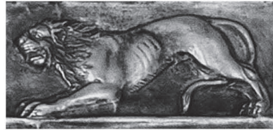
Рис. 5. Зображення лева на обкладинці горита з Мелітопольського кургану.

Достатньо схоже протистояння бачимо на кінці золотої обкладинки піхов меча з кургану Товста Могила, хоча лапа піднята тільки у пантери. Далі в композиції, за пантерою, розміщена теж подібна їй фігура великого котячого хижака, який напав на оленя. А також, фігурі лева подібні фігури (обернені в той самий бік та в протилежний) левів і пантер, що зображені нападаючими на різних тварин на золотій обкладинці горита з Мелітопольського кургану та фігура лева золотої пластини з села Вовківці Сумської області (рис. 5, 6) 4 .