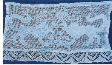
Рис. 8. Рушник першої половини XIX ст. з м. Ярославль.

першої половини XIX ст. з Ярославля. На ньому два леви з гривами показані обабіч дерева життя, а з їхніх лап ростуть квіти; китиці на кінчиках хвостів теж стилізовані як великі квітки (рис. 8) 6 .