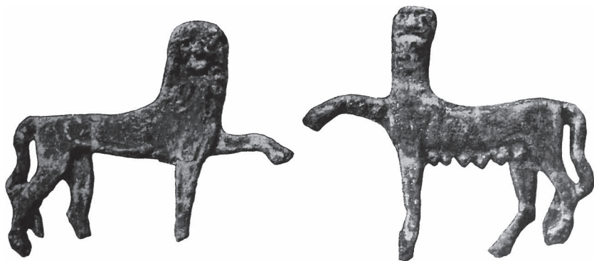
Рис. 7. Гіпсові прикраси від саркофагу.

біжників пам'ятки, розграбовані ними зі старовинного некрополя, що розташовувався на Хаджимушкайській вулиці Керчі, де неодноразово відкривали древні могили. Серед скуплених речей опубліковані досить крупні гіпсові фігурки лева і левиці — оздоби дерев'яного саркофагу, який датують III-I ст. до н.е. 5 Таке декорування саркофагу перегукується з традиціями скульптурного вирішення саркофагів Сідона. В Керчі відкрито адаптований місцевий варіант, зроблений з відносно простих матеріалів. Саркофаг, безперечно, виготовлено у Пантікапеї. Сюжет був популярним, очевидно, впродовж досить тривалого часу. Зокрема, в цих фігурках можна бачити територіальні й часові трансформації. Незмінна схема: лев і левиця (леви, лев і пантера) стоять одне навпроти одного в погрозових позах з піднятими лапами, тими, які рельєфно виглядають далі від глядача, так, що піднятими є їхні зустрічні лапи, у лева — ліва, у левиці — права. Проте самі фігурки могли komponувати по різному: на ампіку лев справа, на мелітопольських платівках — зліва. В іншому у гіпсових фігурок є свої особливості: котячі хижачки не присідають на передні лапи, голови повернуті у фас, хвости не закручені, у левиці підкреслені сосці, наповнені молоком. Майстер цих фігурок, як і майстер платівок, живих левів, напевне, ніколи не бачив.