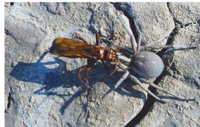
Рис. 10. Оса Cryptocheilus rubellus (кріптохіл червонуватий) тягне самку павука виду Hogna radiata.

Перебуваючи там, вона змогла з упевненістю встановити, що на платівках з маленькими істотами зображена, взята з природи Булганакського степу сценка добування дорожньою осою виду криптохіл червонуватий павука для забезпечення їжею своєї личинки (рис. 10). Складалося враження, ніби