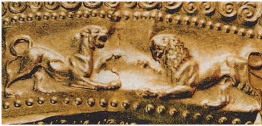
Рис. 4. Сцена протистояння лева і пантери на ампіку з кургану Три Брати.

У художньому плані мелітопольські платівки з протистоянням лева і пантери багаті похідними від зображення на ампіку — золотій діадемі, — із жіночого поховання кургану Три Брати біля Керчі (рис. 4). Сюжетна сцена прикраси — протистояння лева і пантери, в напружених, готових до сутички позах, у вигляді стрічкового фриза орнаментально повторена дев'ять разів. Рух, коли кішка пружно присідає на передню ліву лапу, а праву напружено піднімає трохи вгору в готовності до нападу або до відсічі — дуже характерний, красивий і виразний. Цілковита подібність художнього відбору в цих творах не може бути збігом: зокрема, рух лапи та закручений хвіст. Ми неодноразово подовгу спостерігали за поведінкою левів та леопардів у зоопарку. Вони ніколи не закручують хвіст у кільце. Це характерно тільки для деяких собак. Художник показав, а інший художник повторив, такий ефектний хоча й невластивий рух, задля композиційної доцільності при збереженні пропорцій та ще більшого посилення відчуття напруги. Зображення ж на ампіку, очевидно, у свою чергу може походити або від скульптурного твору, що був відкритий у Сідоні — так званого “Саркофагу Олександра” (на одній з торцевих частин зі сценою полювання є подібне зображення пантери) 3 , або від невідомого твору, на якому і був розроблений цей рух та стилізація хижаків з родини котятчих. Ампік виготовлений на високому художньому рівні, сильним майстром-аніمالістом. Художні особливості не