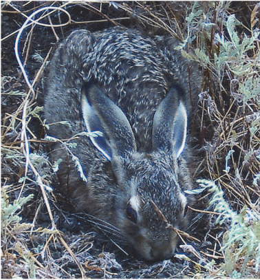
Рис. 11. Заєць в Булганакському степу (фото С.Т. Триколенко).

часового провалля: так само як і двадцять чотири століття тому оса тягне павука по порепаній землі Булганака. Це в свою чергу дозволило переконатися в тому, що виготовлені вони були, очевидно, саме в Пантікапеї, а також з'ясувати важливі аспекти життєвої філософії скіфів 7 . Ці пластинки відрізняються тим, що істоти на них показані зверху. В художньому плані саме так вони виглядають виразно, звично, знаково. Показ великих котячих хижаків і зайців збоку в профіль, та оси з павуком зверху, є змалюванням з тих точок, з яких люди, зазвичай, їх бачать.