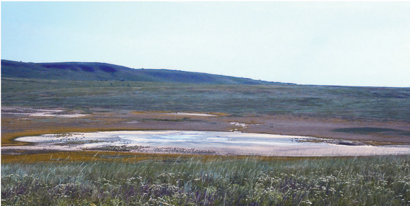
Рис. 9. Булганакський степ. В центрі – водойма, по краях якої багато осиних нір.

Впродовж кількох років влітку С.Т. Триколенко працювала в геологічній науковій експедиції в Керчі, в районі античного Пантікапею. Ця частина природного оточення не зазнала значних змін (рис. 9). Фауна Булганакса, подібні істоти та їх взаємовідносини дуже характерні.