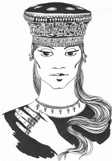
Рис. 2. Реконструкція головного убору за матеріалами з кургану № 22 поблизу с. Кам'янка (Миколаївська обл.).

відповідають циліндричній поверхні. О.М. Лесков зазначив щодо форми головного убору: “наявність не лише прямокутних, але й дугоподібно вигнутих платівок дозволяє, використовуючи досвід старих реконструкцій, припустити, що він мав вигляд кокошника” 38 . Але для оформлення верхнього краю убору, який нагадує стефану, використовували аплікації іншого абрису. Згадані пластини вирізняються розмірами, характером вигину: кожна з них нагадує частину окружності. Ми застосували метод макетування, щоб уявити контури фігури, утвореної з’єднаними між собою пластинами (рис. 3). Як бачимо, це дуга, між кінцями якої великий проміжок. Ймовірно, аплікації були прикріплені на денці шапки, форма якої зрізаний конус чи кошик. Розміри верхньої основи — 78 см (вирахували при макетуванні), а нижня — 56–60 см (дорівнює розмірам голови). Стінки убору спереду та з боків прикрашали золоті смуги. Верхній ряд — ажурні пластини з