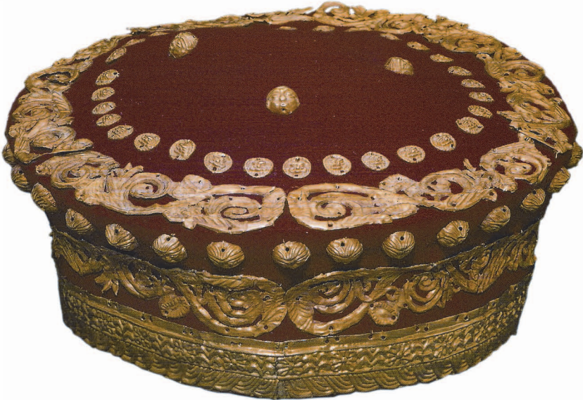
Рис. 1. Реконструкція головного убору за матеріалами з кургану Тетянина Могила (Дніпропетровська обл.).

Дугоподібні аплікації прикрашали також убори, які належать до іншого виду. Йдеться про шапочки, які за силуетом відповідають визначенню калафа або модія: тобто, такі, що нагадують кошик: невисокі, з увігнутими стінками, опуклими “денцями” чи та “маківками”. Реконструкцію уборів зроблено завдяки точній фіксації золотих пластин різної форми, які склали коштовний комплект. Насамперед, привертає увагу набір оздоб з кургану Тетянина Могила (Дніпропетровська обл.) 35 . Треба зазначити, що залишки убору добре зберегли не тільки його обриси, але й місце кожної пластинки (рис. 1).