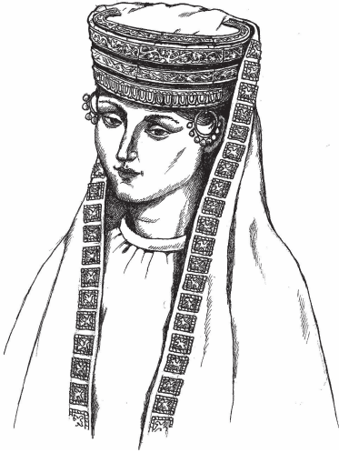
Рис. 4. Реконструкція головного убору за прикрасами з кургану № 22 (п.1) поблизу с. Вільна Україна (Херсонська обл.).

криті, а навпаки — гармонійно поєднані з калафами та іншими уборами (стефанами, стленгідами, тощо).