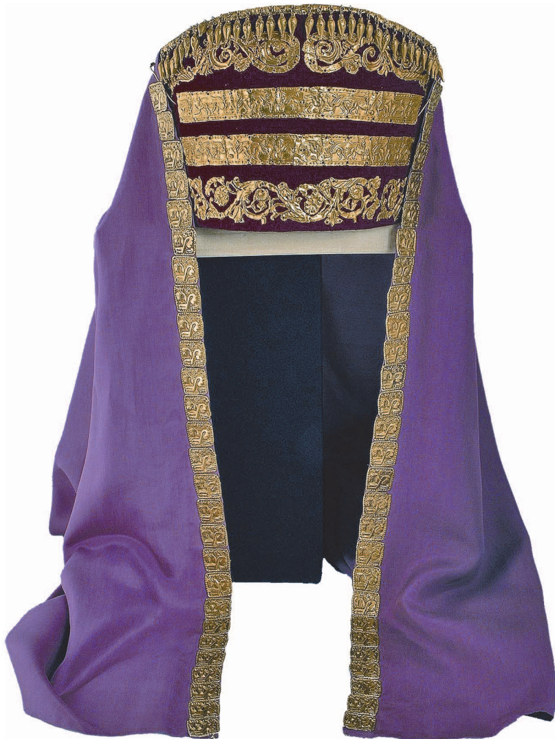
Рис. 5. Реконструкція головного убору за прикрасами з кургану № 22 (п.2) поблизу с. Вільна Україна (Херсонська обл.).

підкреслено зверху та знизу смужками із “перлинок” — маленьких опуклих кружалець. Над цими аплікаціями — дві ажурні дугоподібні пластини з рослинним орнаментом. Оформлення завершують декоративні обідки з амфороподібними підвісками (рис. 5).