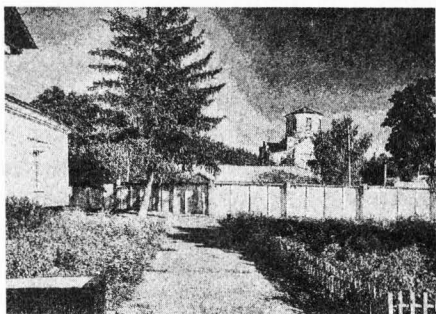
Рис. 5. Домницький монастир (сучасний вигляд).

Саме його сином (було у нього ще й дві дочки) є Андрій Ілліч Безбородько (1783–1814), залишки серця якого були покладені у срібний футляр (рис. 4). Він був останнім представником роду за чоловічою лінією, але, на жаль, помер у молодому віці. Про його життєвий шлях відомо небагато. Дійсний камергер і граф Андрій Безбородько 5 брав участь у поході антифранцузької коаліції європейських держав, командував I Полтавським регулярним військово-козацьким полком. Військові дії закінчилися весною 1814 р., а влітку цього ж року він по дорозі на батьківщину помер від ран у невеличкому польському містечку Жарки (сучасне Сілезьке воєводство). На відміну від батька та дядька, яких було поховано в Александро-Невській лаврі в Петербурзі, Андрія Безбородька поховали на Чернігівщині і, як виявилось, саме в Домницькому монастирі, заснованому гетьманом Іваном Мазепою у 1696 р. на місці явлення ікони Богородиці (рис. 5). Це всталося не випадково, адже відомо, що монастирем опікувалися ще генеральний суддя Андрій Якович, потім його син і батько Андрія – Ілля Андрійович Безбородько зі своєю дружиною Анною Іванівною. Останні надали кошти на відновлення монастиря, на будівництво для нього нових споруд, на виготовлення коштовного окладу для чудотворної ікони Домницької Богоматері 6 .