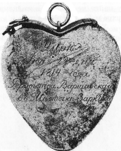
Рис. 1. Футляр у формі серця. Лицьовий бік. Рис. 2. Футляр у формі серця. Зворотний бік.