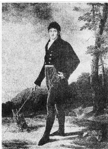
Рис. 4. Портрет А.І. Безбородька кисті французького художника Роберта Лефевра. 1804 р.

отримав титул світлішого князя Російської імперії та чин канцлера 3 . Всі його багатства після його смерті за відсутності нащадків перейшли до молодшого брата – Іллі Андрійовича (1756–1815), дійсного таємного радника, який зробив блискучу воєнну кар'єру. Але основна заслуга цього представника знаменитого роду – заснування в пам'ять покійного брата у м. Ніжині Гімназії вищих наук (відкрита у 1820 р.) 4 , для потреби якої він віддав свій будинок та сад. Згідно з уставом, цей учбовий заклад прирівнювався до університету. Зараз це державний педагогічний університет ім. Гоголя.