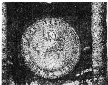
Рис. 4. Сюжет із зображенням Романа Солодкоспівця. Картон, золоті та срібні нитки. Шиття, гаптування.

Інший медальйон, у нижній частині виробу, має круглу форму і прикрашений майстерно вигаптуваною фігурою св. Романа Солодкоспівця, улюбленого персонажа іконографічного сюжету Покрови, який оспівував влахернське диво (рис. 4).