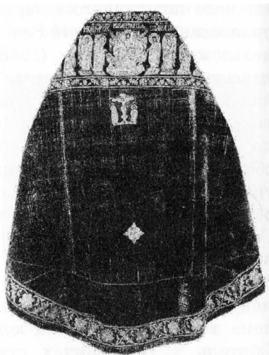
Рис. 5б. Фелонь священника. Загальний вигляд.

Ці вкладні речі, які збереглися до нашого часу складно ідентифікувати через відсутність дарчих написів, поміток, клейм. У 2004 р. вони були відреставровані музейним художником-реставратором Мінжуліною Т.В., якій вдалося усунути потертості, ліквідувати розриви тканини 17 . За художньо-стилістичними ознаками українського шитва вони належать до XVII ст. Щодо місця їх виготовлення, визначення можливе лише за припущенням. Порівнюючи зразки літургійного шитва музейної збірки та атрибутовані тканини з колекції Національного Києво-Печерського історико-культурного заповідника (НКПЗ № КПЛ Т – 208; Т – 978; Т – 148) (рис. 5а-б), можна припустити, що описані речі виготовлені у майстерні Київського Вознесенського (Печерського) монастиря, який впродовж XVII ст. був визначним осередком гаптарського мистецтва.