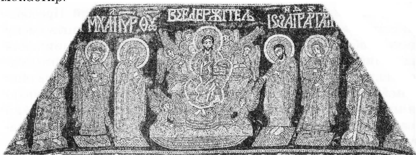
Рис. 5а. Фелонь священника (фрагмент). Невідомий майстер. Середина XVII ст. Оксамит, золоті та срібні нитки. Шиття "за лічбою", гаптування. (Фонди НКПЗ).

настоятеля храму ніс майбутній владика Павел (Лебедь), нині архієпископ Вишгородський, вікарій Київської митрополії, намісник Києво-Печерської Лаври. Рішенням Священного Синоду УПЦ від 28 жовтня 1997 р. при храмі відроджено монастир.