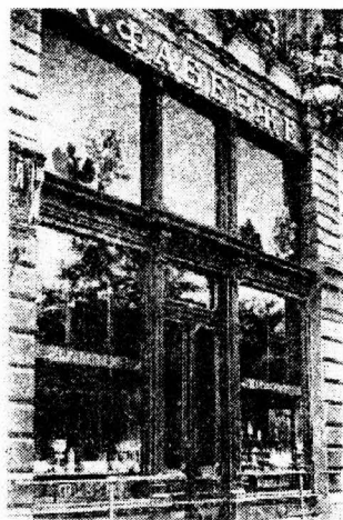
Рис. 2. Магазин в Одессе 1900 год.