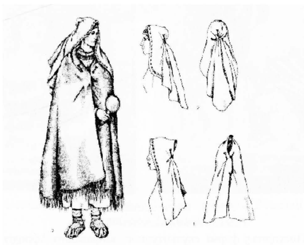
Рис.2. Реконструкція елементів убрання та костюма жінки за матеріалами з кургану №3 поблизу урочища Стайкин Верх.

5. Пряжки та кільця з виступами – прикраси волосся (?).