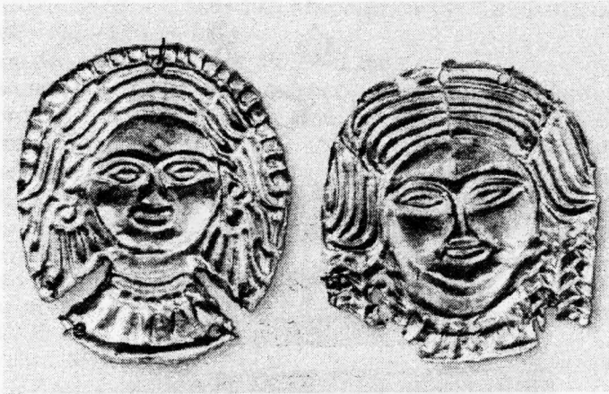
Рис.3. Золоті пластинки із кургану №1 (1897 р.) поблизу с. Вовківці.