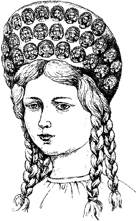
Рис.5. Реконструкція головного убору за знахідками в кургані №1 (1897 р.) поблизу с. Вовківці. (Художник З.Васіна)