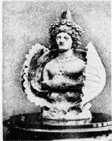
Рис.4. Фанагорійські вази. 1.Лекіф із зображенням Сфінкса. 2. Посудина у формі скульптурного зображення Афродіти.