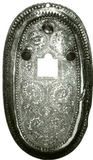
Рис. 6 Футляр Мезузы. Москва, 1835. Высота 16,7

Особый же интерес для исследования данной темы представляет другой футляр (инв. №107/108), сделанный из серебра (высота — 16,4 см, ширина — 8,2 см), клейма отсутствуют 22 . Идентифицируемый Х. Бенжамин — Польша XVIII столетие. Он имеет овальную форму, в центре — аркообразное окошечко, увенчанное короной, фланкируемое стоящими в профиль орлами с поднятыми крыльями, внизу — в антитетичном построении стоящие на задних лапах лев и единорог. Весь фон заполнен резными листьями и цветами с последующей гравировкой. Сверху покрыт стеклом с серебряной ленточной оправой с зубчатым внутренним краем (Рис.5,2).