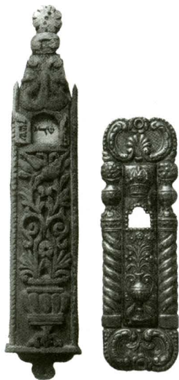
Рис.2,1 Футляр Мезузы. Галиция, XIX ст. (Высота 28,5 см)

В Музее Израиля (Israel Museum) в Иерусалиме среди прекрасных памятников еврейского искусства знаменитой коллекции Джозефа Штиглица (Stieglitz Collection) представлены два футляра Мезузы 20 . Один по мнению Chaya Benjamin (Хая Бенжамин — экскуратор коллекции иудаики Музея Израиля) является образ-