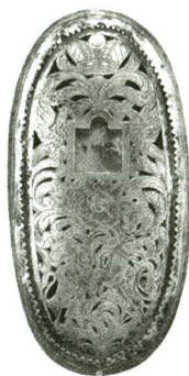
Рис.5,1 Футляр Мезузы. Словакия, XIX ст.