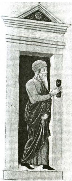
Рис.1. Еврей касается Мезузы, прикрепленной к правому косяку двери, выходя из дома. Фотография из Rothschild Miscellany, Италия, 1470. Музей Израиля, Иерусалим

На внутренней стороне свитка нанесены стихи двух из трех частей Шма (Второзаконие 6:4; 11:13–21), а на внешней стороне — слово Шаддай — Всемогущий. Толкуется также как аббревиатура Шомер далтот Исраэль — Охраняющий двери Израиля. Текст Мезузы содержит 22 строки. В момент прикрепления Мезузы произносится благословение "Благословен Ты, Господи... завещавший... нам укреплять Мезузу". Мезуза помещается, как правило, в футляр,