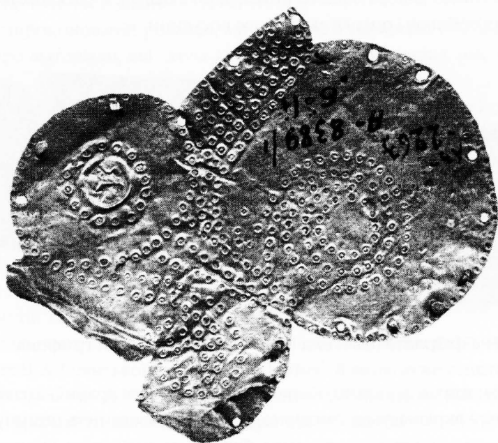
Рис. 2: Фігурна золота пластина зі стилізованим зображенням голови птаха

Ілюстрацією до наведених висновків є ще одна знахідка з поховання поблизу с. Рахманівка - платівка, вирізана з тоненької золотої фольги за контурами зображення стилізованої голови хижого птаха. За периметром пробито дірочки, крізь які оздобу прикріплювали до декорованого предмета (Рис.2). Розміри виробу: довжина - 90 мм, висота - 84 мм (від крайніх точок). Його поверхня є полем, на якому нанесено