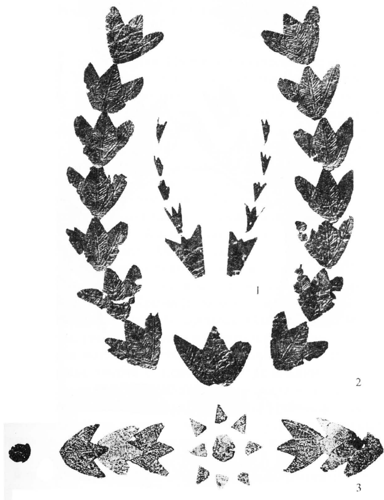
Табл. I. 1-2 – поховальні вінки з колекції Б.І. Ханенко, що мали за основу стрічку зі шкіри чи тканини. 3 - поховальний вінок з поховання № 4 могильника поблизу с. Заморське, Ленінський район, Крим.