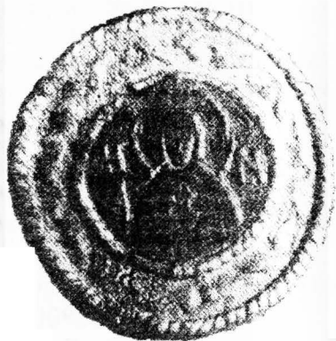
2. Кам'яна іконка в бронзовій оправі з Серенська, друга чверть XIII ст.

рельєфних іконках XII ст., (6). Оздоблені рослинними галузками німби типові для візантійських творів кам'яної пластики XII ст.