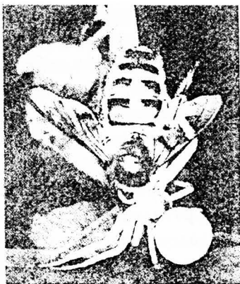
Рис 4. Вот он дождался удачи и схватил севшю на цветок пчелу

Мотив степових істот струмує бігунцем, в якому чередуються павуки і бджоли. Прочитуються загальні композиційні ритми. Зокрема, відстані між істотами з різних, розміщених поруч, платівок стають найбільшими фоновими інтервалами. Безсумнівно, на такі ув'язки розраховував давній художник, не замикаючи краї нашивних оздоб по вертикалі. В результаті доводки майстром кожної платівки — всі вони трохи відрізняються. Де інде різняться пропорції, обриси, інде окремі риси створінь виділені чіткіше. Складені разом на тканині ажурні скіфські платівки видаються особливим золотим мереживом. В численних творах давнього мистецтва різних жанрів творці не ставили за мету суто натура-