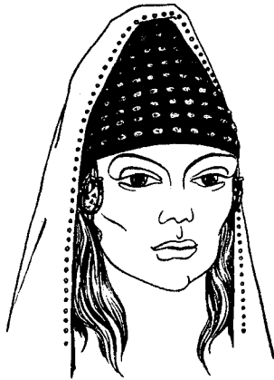
Рис.1. Реконструкція убору за знахідками з к. 4 поблизу с.Ізобильне Дніпропетровської обл.

Реконструкція конусоподібних головних уборів скифянок.