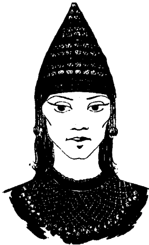
Рис 2. Убір з підвісками з Бердянського кургану.