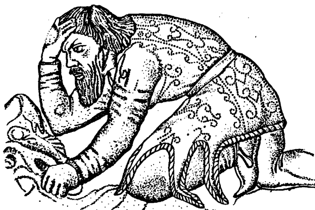
Рис. 2. Скіф з качкою. Фрагмент фризу на чаші з кургану Гайманова Могила.