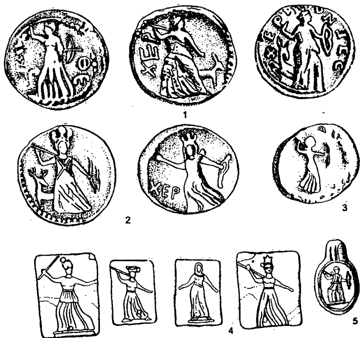
Рис. 1. Изображение прямостоящей Парthenос с луком и копьем на монетах Херсонеса I в. до н.э. – III н.э. (1-2); золотых аппликационных пластинах из Херсонеса I-II вв. н.э. (4); золотом медальоне из Херсонеса (5); бегущая Парthenос на монете Херсонеса I в. н.э. (3).