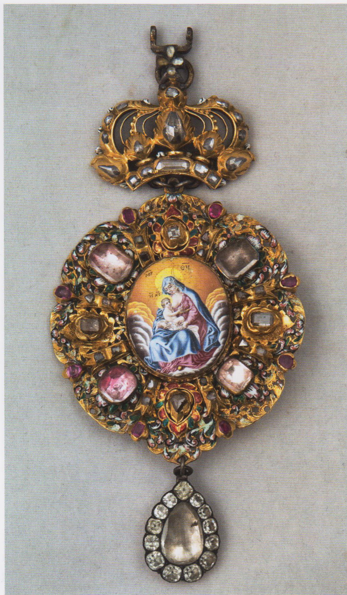
Панагия. Начало XVIII в.

Характерным для украинского ювелирного искусства в целом и этого периода в частности является украшение изделий жемчугом и драгоценными камнями, среди которых преобладают бриллианты, сапфиры, рубины. Поэтому так богато и нарядно выглядят митры — головные уборы высшего духовенства и панагии — небольшие нагрудные иконки на цепочках, которые носились архиереями поверх одежды.