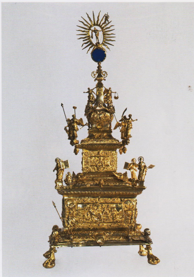
Дарохранильница. 1743. Киев, мастер Иван Равич

композициями на евангельские сюжеты, окружённые изысканными барочными узорами из завитков, связок плодов и цветов, головок ангелов и ломаных линий. По краям каждого яруса закреплены литые фигурки — стражники с копьями, евангелисты с раскрытыми книгами, ангелы с орудиями страстей Христовых. Увенчана дарохранильница грушевидным куполом, декорированным рельефными накладками и миниатюрными скульптурками ангелов, которые как бы парят в воздухе, касаясь купола руками и краями одежд. Вверху (традиционно для такого рода изделий) Равич разместил сцену «Воскресение».