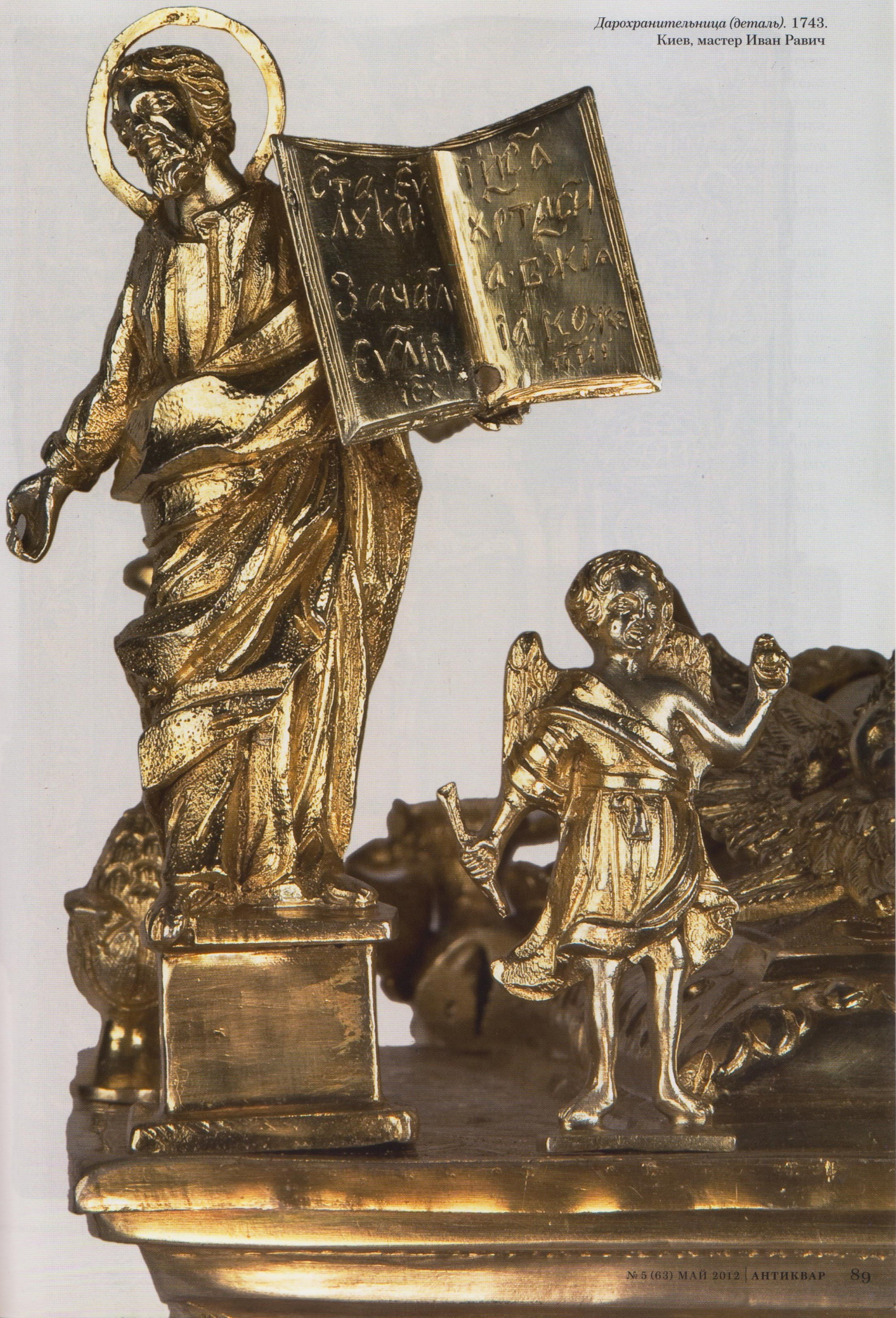
Дарохранительница (деталь). 1743. Киев, мастер Иван Равич