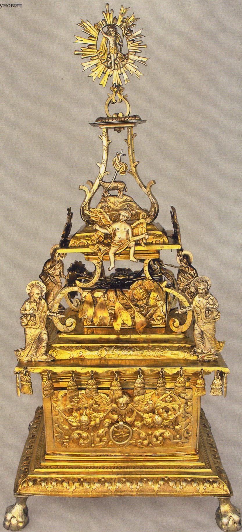
Дарохранительница. 30–50-е гг. XVIII в. Киев, мастер Матвей Нарунович