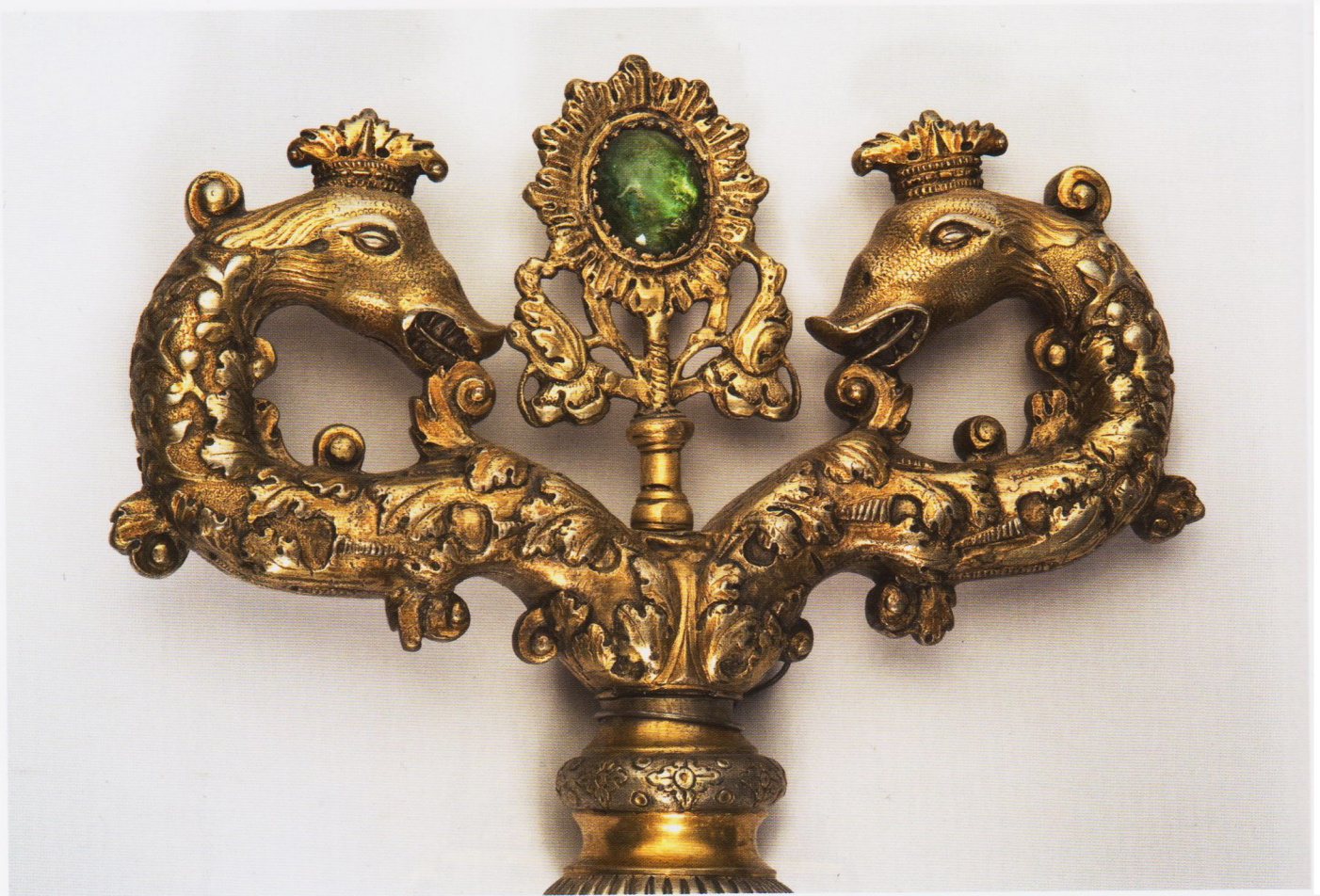
Навершие посоха. 30–50-е гг. XVIII в. Киев, мастер Матвей Нарунович