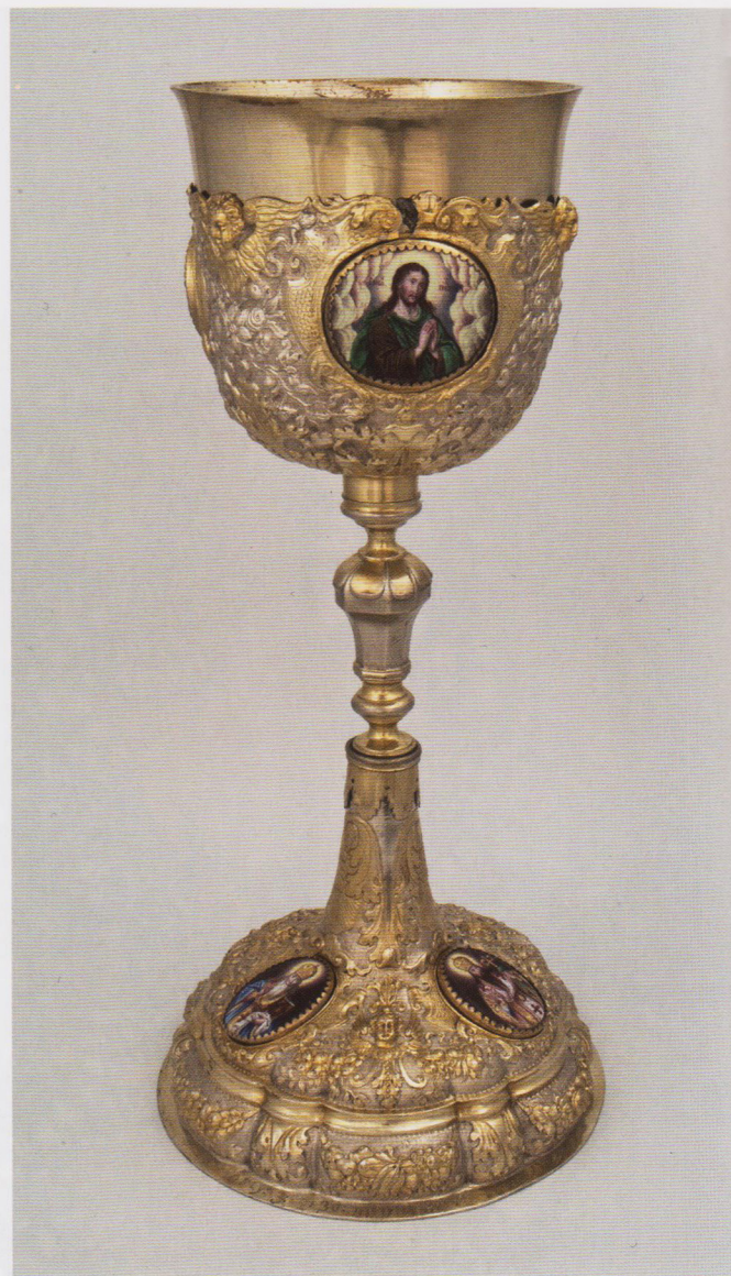
Потир. 30–40-е гг. XVIII в. Киев, мастер Иван Равич

Творчество Ивана Андреевича Равича (1677–1762), ювелира, который жил и работал на Подоле, достаточно широко представлено в музеях Украины и России — в общей сложности около 60 работ, главным образом предметов культа. В нашем музее хранится также одно его изделие не церковного назначения — чайник, изготовленный около 1715 г. Его украшением, помимо узора из причудливо переплетённых лент (чеканного пока ещё в низком