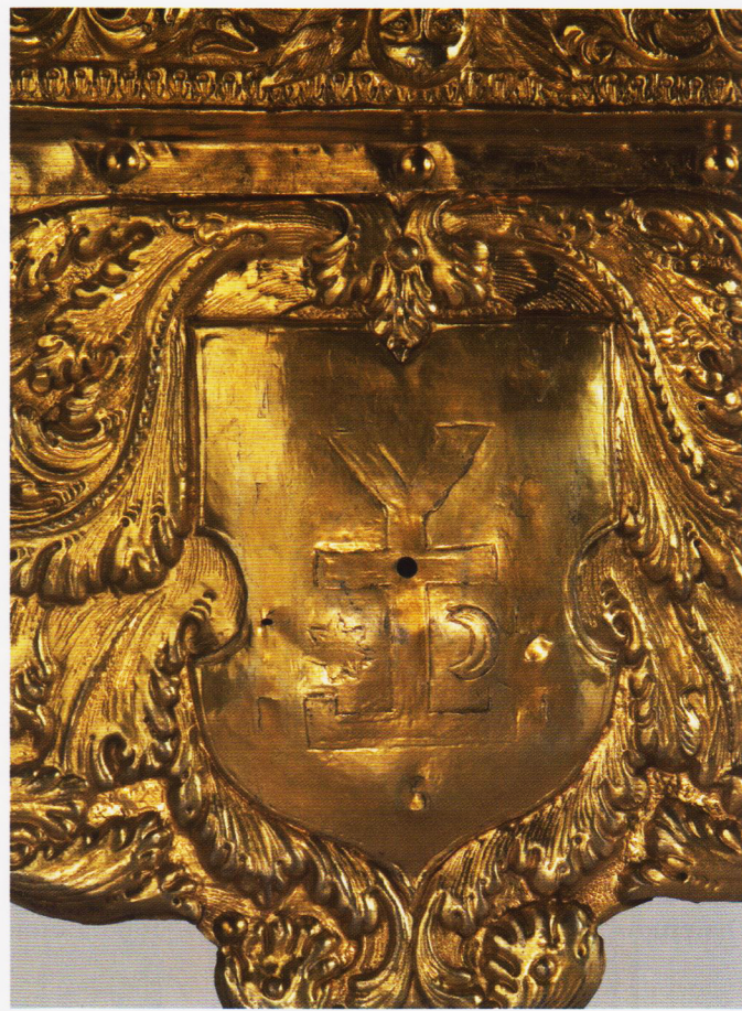
Оклад иконы Дегтярёвской Богоматери с гербом Ивана Мазепы. Конец XVII — начало XVIII в. Киев

Атрибутировать изделия киевских ювелиров XVIII в. значительно проще, поскольку на них, как правило, имеется ряд клейм: клеймо мастера (кириллическими или латинскими буквами), городское клеймо с надписью «КЮВ», пробы металла (на серебряных предметах чаще всего цифра «12» согласно каратной, а, возможно, и лотовой системе). В 1780-х гг. на продукции киевских ювелиров появляется новое клеймо в виде миниатюрного герба города (архистратиг Михаил с мечом и щитом). Впрочем, не все мастера придерживались традиции клеймить свои работы: в коллекции музея довольно много предметов, атрибуция которых вызывает затруднения.