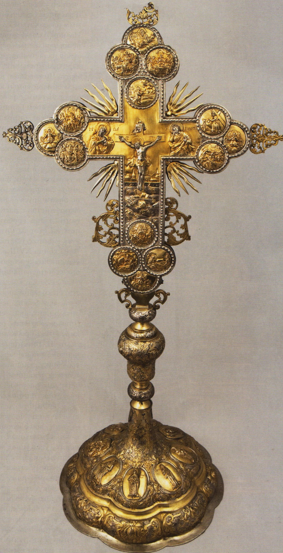
Крест. 1757. Киев, мастер Фёдор Левицкий