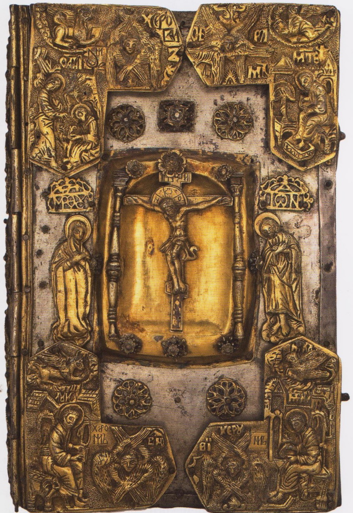
Евангелие в серебряном окладе. 1658. Киев