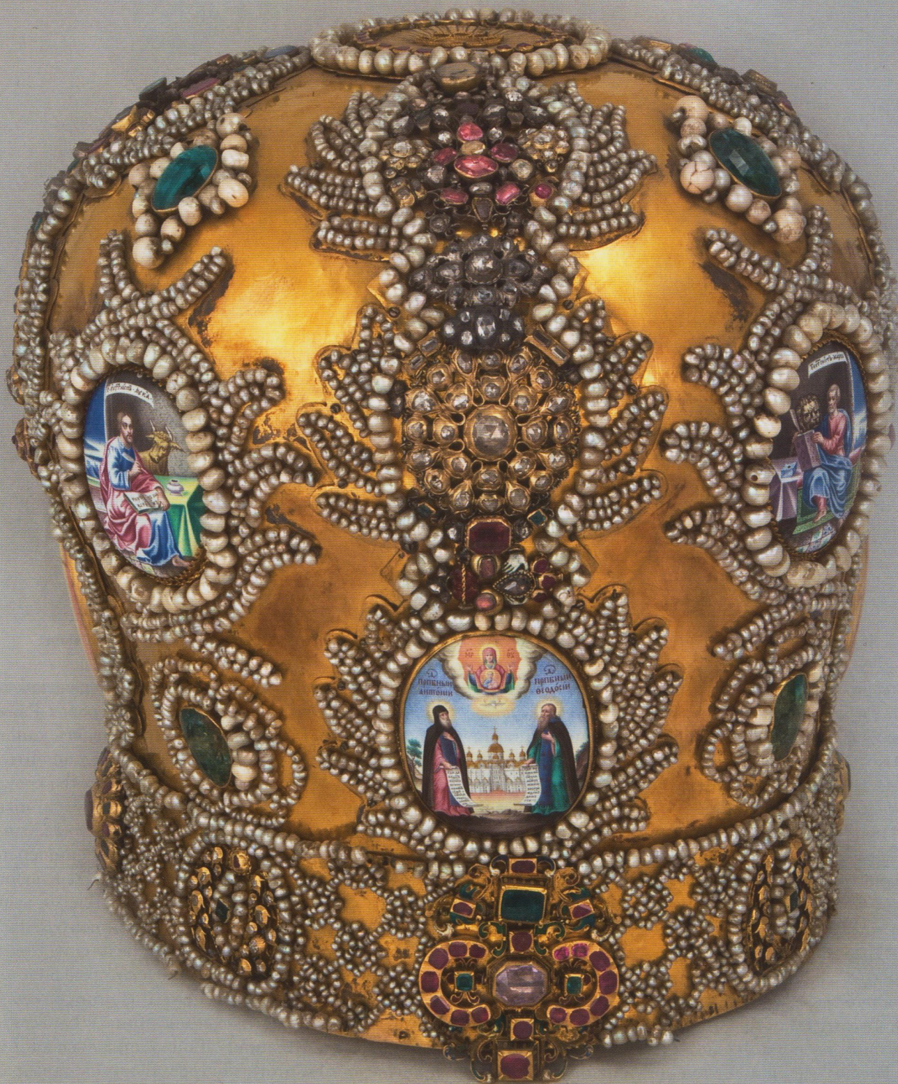
Митра золотая. Начало XVIII в.