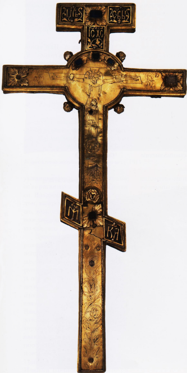
Крест. 1546. Львов

УКРАИНСКОЕ ЮВЕЛИРНОЕ ИСКУССТВО XVII—XVIII ВВ.