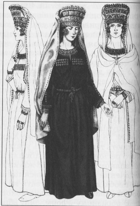
Рис. 2. Реконструкція костюма скіф'янки за матеріалами з поховання у Великому Рижанівському кургані (Черкаська обл.). В ансамблі прикрас етнографічна деталь – шпильки

Різнокольорове намисто зі склоподібної маси сприймали, мабуть, як амулет, тому часто бачимо або низки, або окремі намистинки у жіночому вбранні: це був або додатковий, або основний засіб декору, відповідно до соціального статусу особи. Напівкоштовне каміння, можливо, вважали талісманами і саме тому зрідка включали до складу костюмних комплектів.