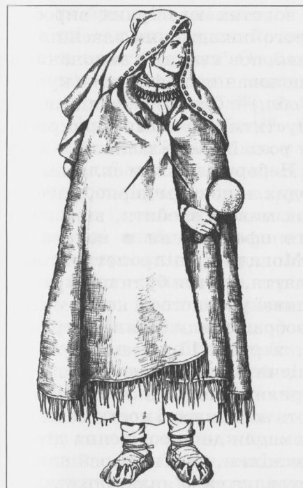
Рис. 3. Вбрання жінки з населення Лісостепового Лівобережжя (реконструкція за знахідками з к. 3 поблизу уроч. Стайкин Верх (Сумська обл.). В комплекті прикрас: ножні браслети та великі шпильки

Лівобережний Лісостеп. Етнолокальну своєрідність костюмів жінок цього регіону становили браслети для ніг та шпильки. Інколи ножні браслети складали єдиний ансамбль з наручними. Обручі для ніг були «модними» переважно в V ст. до н.е., а пізніше їх вже не носили. У VII-VI ст. до н.е. набори прикрас містили: 1) намисто, браслети (наручні та ножні), 2) браслети, шпильки. У V ст. до н.е. оздоби складали такі комбінації: сережки, намисто, браслети-перев'язки; сережки, намисто, шпильки, ножні браслети. У IV ст. до н.е. комплекти прикрас нагадують костюмні комплекси скіф'янок-степовичок. З'явилися повні набори, які включали в себе золоті оздоби. Вони відбивають особливості костюмів соціально виділених осіб. Зокрема, в наборах ювелірних виробів зрідка трапляються персні, жінки перестали носити браслети на ногах, натомість, модними стають античні прикраси 23 (рис. 3).