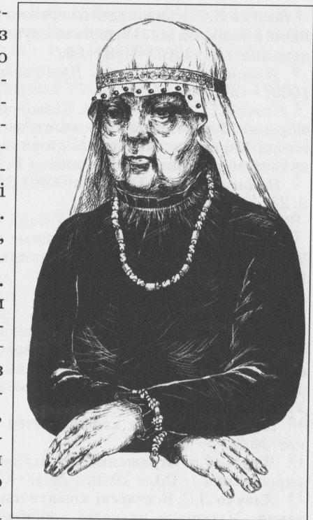
Рис. 5. Костюмний комплекс літньої амазонки: намисто, браслети-перев'язки (к. 18, поблизу с. Львове, Херсонська обл.)