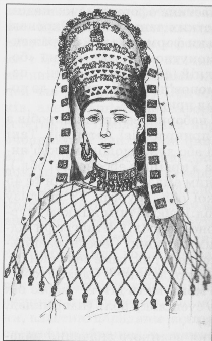
Рис. 1. Костюм скіф'янки з сережками-кораблицями, істмією, сітчастою нагрудною прикрасою (к. Мала Лепетиха, Херсонська обл.)