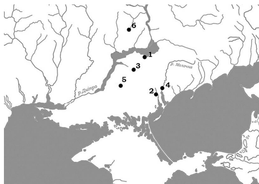
Рис. 2. Карта розташування курганів з дрібними пластинками із зображеннями членистоногих: 1 – Гайманова Могила; 2 – Володимирівка курган; 3 – Вишнева Могила поховання; 4 – Мелітопольський курган; 5 – Огуз; 6 – Олександрополь.

Типи було виділено на основі зображення, форми пластинок, а також їх виконання. Сюжет протистояння двох істот походить з трьох курганів, що