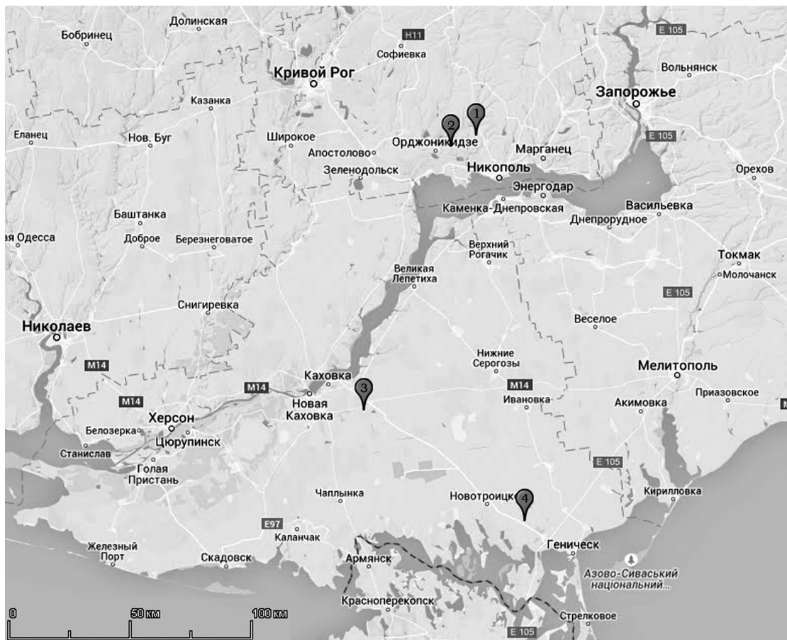
Рис. 2. Карта розташування курганів: 1 – Чортомлик; 2 – Товста Могила; 3 – Червоний Перекоп курган; 4 – Водославка курган

На нашу думку, у випадку з довгими пластинами одягу першочерговим є символізм загальної композиції, а не окремих її персонажів. У такому разі комахи та птахи виступають як супутники світового дерева. Воно було символом богині-матері